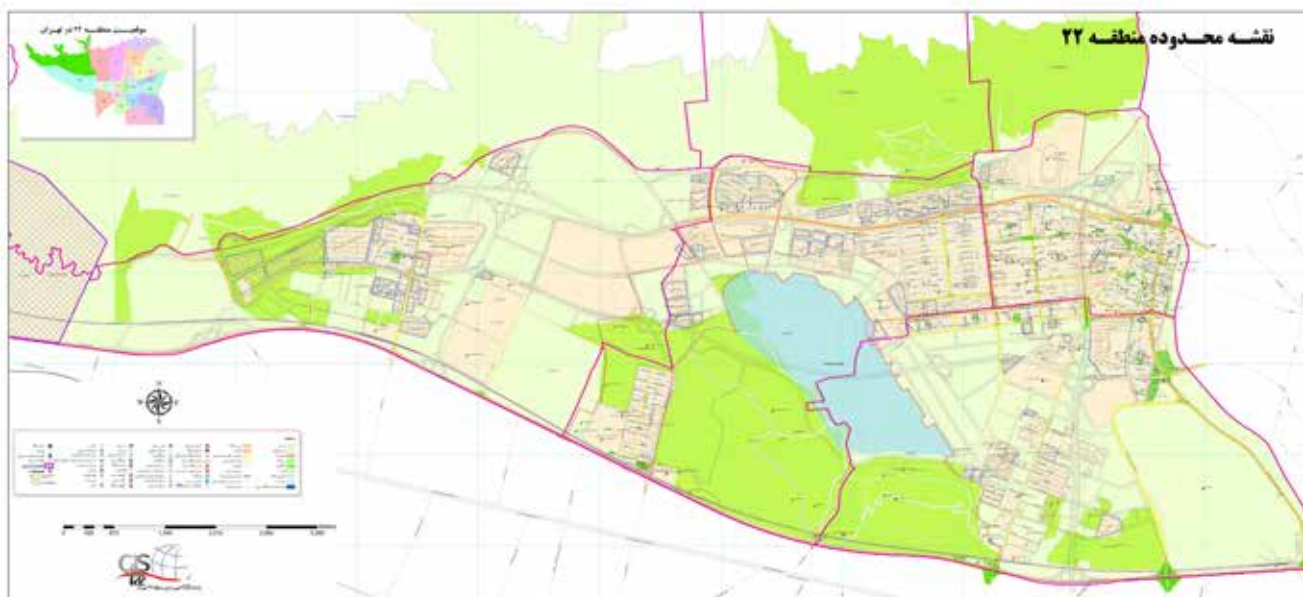
تصویر ۱. نقشه محدوده منطقه ۲۲.