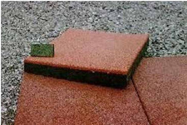
تصویر ۳: کفپوش لاستیکی