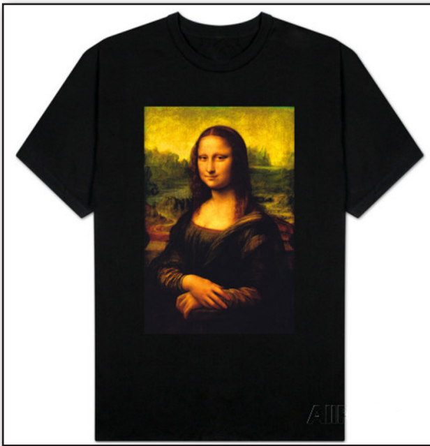
تصویر ۱. استفاده از تصویر هنری (مونالیزا) جهت فروش کالا.