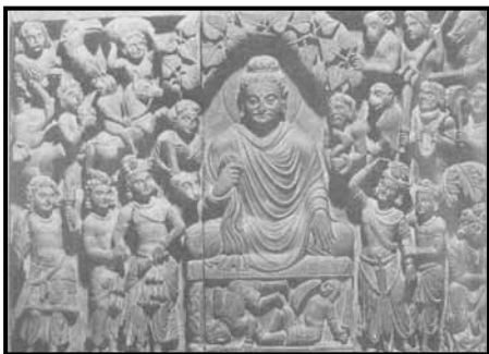
تصویر ۴. موعظه بودا: بخشی از نقش برجسته سنگی. عهد کوشان، سبک گاندهارا (قندهار)، قرن دوم میلادی، گالری هنری فریر، واشینگتن، دی. سی. امریکا.

این اندام به صورت کوتاه و پهن با موهایی موجدار و نقوشی از چین لباس بر تن آنها تراشیده شده اند. نقوش حیوانی مانند اسب، فیل و شتر نیز لابه لای آنها کار شده است. نقوش گیاهی به ویژه در بالای سر بودا دیده می شود. در زیر پای بودا و بر دیواره تخت او دو شخصیت یکی واژگون و دیگری در حالت استراحت دیده می شوند. دو گروه خیر و شر یعنی خدایان و اهریمنان که به صورت غالب و مغلوب هستند تصویر شده اند. (تصویر ۴)