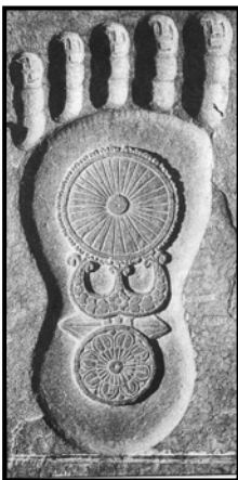
تصویر ۱۱. جای پای بودا، از منطقه بودگایا (Bodhgaya) ایالت بیهار، هند، سنگ

سومین نماد نیمه شمایی بوداست که مستقیماً به شخصیت تاریخی مذهبی او اشاره دارد. جای پا نزدیک‌ترین نماد به شمایل است. یکی از این نمادها یک جفت جای پای بودا، از جنس سنگ است، که با خطوط صیقلی، مدور و نرم در سطحی دایره‌ای شکل که در واقع گل نیلوفری می‌باشد که گلبرگ‌های آن در اطراف نقش شده اند دیده می‌شوند. (تصویر ۱۱) و دیگری جای پای بودا، سنگ برجسته‌ای مزین به ورق طلا و نقش و نگارهای مختلف می‌باشد. (تصویر ۱۲)