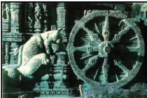
تصویر ۷. نماد چرخ- معبد سوریا (surya)، واقع در کونارک (konarak)، هند مورخ ۱۲۴۰ میلادی، سنگ

در این تصویر چرخ دارما از سه قسمت اصلی چرخ، دسته و پایه تشکیل شده است. چرخ یا گردونه با یک دایره کوچک به عنوان نقطه مرکزی با شعاع‌های ۱۶ گانه خطی به حلقه میانی و آن هم به دسته چرخ که دایره یا گردونه را به پایه ای متصل می کند. دسته چرخ به شکل اژدهایی است که پای یک الهه را در دهان دارد. این اژدها به صورت قرینه در طرفین قرار گرفته در حالیکه نقوشی بر بدن آن حک شده است و یک گل نیلوفر آبی هفت پر در بین آنهاست. (تصویر ۷)