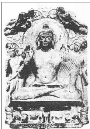
تصویر ۱۶. بودای نشسته ماتورا، سده های ۳ و ۲ میلادی. موزه باستان شناسی کرزون، ماتورا

در برخی شمایل ها بودا با هیكلی تنومند و پهلوانی شبیه خدایان یونانی و رومی با عضلات پر و برجسته به نمایش درآمده است. چنانکه در تصویر ۱۶ مشاهده می شود: بودا در حالت نشسته به صورت چهارزانو، چهره، آرایش مو و گوشه های کشیده همه از عناصر هنر بودایی می باشد. اما حالت دست ها و چشم های باز و خیره و چین لباس که روی دستها نمایان است حاکی از تاثیر هنر یونان و روم می باشد. وجود دو بز یا آهو به صورت قرینه در پایه ی تخت، صفحه ای از گل نیلوفر در پشت سر بودا و شاکتی های قرینه در طرفین آن از دیگر عناصر این نقش برجسته است که تاثیرات هنر هندویی است.