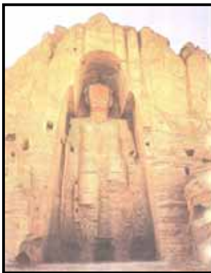
تصویر ۱۵. بودای غول پیکر، سنگ، بلندی ۸۳ متر، سبک گوپتا، اوایل قرن ۵ میلادی

بامیان ۳۷ (افغانستان کنونی) که در دل کوه کنده شده است. این مجسمه بودا را به صورت ایستاده با حالتی که تحت تاثیر فرهنگ و هنر یونانی و رومی است بالباسی پر از چین های منظم با چهره ای آرام و معنوی و گوشه های بلند و کشیده نشان می دهد. (تصویر ۱۵)