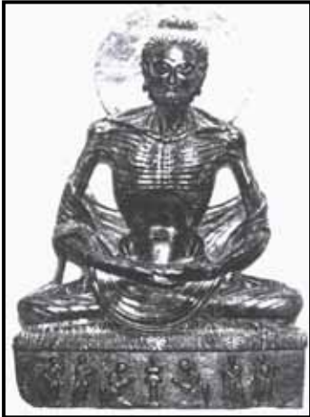
تصویر ۳. بودای ریاضت کش، شمایل سنگی، بلندی ۸۵ سانتی متر، عهد کوشان، از گاندهارا (قندهار)، قرن دوم و سوم میلادی، موزه لاهور، پاکستان.

این شمایل که با عنوان بودای روزه گیر نیز معرفی شده است شاید اشاره به بوداست که در جستجوی حقیقت شش سال روزه گرفت و امساک غذا را به حدی رساند که روزانه به یک دانه برنج و حتی یک ارزن اکتفا می نمود. شبی در زیر سایه درخت گامبو ۱۷ که آن را درخت انجیر نیز ذکر کرده اند، نشسته و به مراقبه مشغول بود؛ در حالت خلسه هنگامی که از تسلط حواس پنجگانه رهایی یافته بود نور قلبش بر کلبه تاریک وجودش تابید و به اولین مرتبه اشراق و تنویر مشرف گردید. شعی در دل خویش حس کرد، گویی به علت اصلی رنج و غم جهان دست یافته بود. گوتاما در پای درخت انجیر هفت شبانه روز چهارزانو نشست و در خود غوطه ور شد. او منور شده بود و در پرتو وجود تابناک خویش حقیقت عالم را در یافته بود. وی از دور تسلسل "سمسارا" ۱۸ که همه رنج و درد بود خارج شد و دریچه جهان جاوید بر او گشوده گشت. (تصویر ۳)