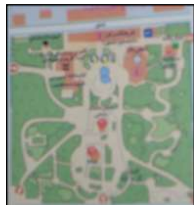
تصویر ۷ - پارک شفق.