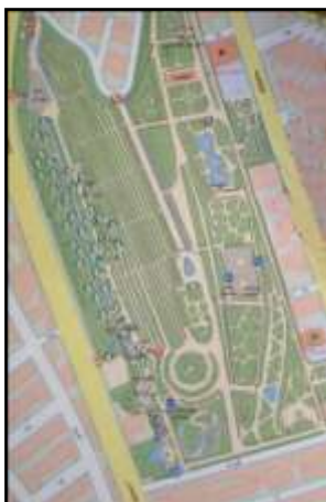
تصویر ۱۲ - پارک ساعی. اطلس پارک های تهران، ۱۳۸۶