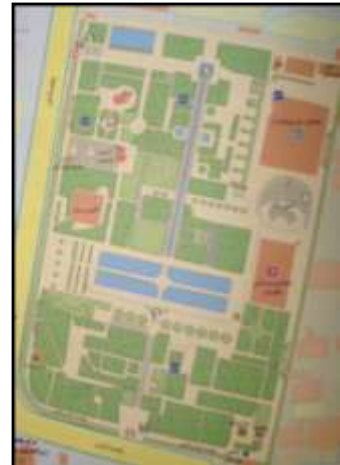
تصویر ۵ - پارک نیاوران.