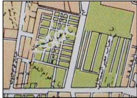
تصویر ۱ - باغ ابوالفتح خان و باغ معیر الممالک.

تصاویر ۱ و ۲، نقشه‌های نمونه‌هایی از باغ‌های اوایل و اواسط دوره قاجار هستند که در داخل حصار ناصری قرار داشته‌اند. دست کم تبعیت از الگوی هندسی باغ ایرانی در آنها کاملاً مشهود است.