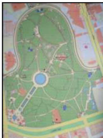
تصویر ۱۳ - پارک لاله. اطلس نتیجه گیری پارک های تهران، ۱۳۸۶