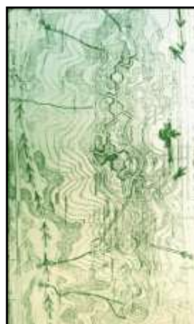
تصویر ۱۱ - پارک طالقانی.

از روند تحولات یاد شده می توان اینگونه نتیجه گرفت که بوستان های شهری امروز ما زاینده تحولاتی در عرصه زندگی اجتماعی و شیوه های باغ سازی است که همگام با سایر جنبه های معماری و شهرسازی از دوره قاجار آغاز شده، لیکن محصولات عمده آن با نیم قرن تاخیر پا به عرصه شهر های ما گذاشته است. با توجه به ساختار اجتماعی، اقتصادی و شیوه متداول معماری و شهرسازی ایران در عصر قاجار و اوایل دوره پهلوی، نیاز به پارک به مفهوم امروزی آن احساس نشده و احداث یا نام گذاری چنین فضاهایی بیشتر جنبه تقلیدی و تجدد گرایانه داشته است. لذا ورود واژه پارک به محافل کشور و اطلاق آن به برخی از باغ های دوره ناصری، تنها باعث ایجاد تحولاتی در شیوه باغ سازی و برخی از عناصر باغ شده و پارک به معنای امروزی آن برای استفاده عموم از دوره پهلوی دوم متداول گشته است. شکل گیری پارک های مهم در دوره پهلوی دوم نیز عمدتاً بر اساس نگرش های حاکم بر عرصه منظرسازی معاصر غرب و گاهی با دخالت مستقیم طراحان غربی انجام پذیرفته است، گرچه ردپای باغ ایرانی در طراحی پارک های معاصر همچنان به چشم می خورد.