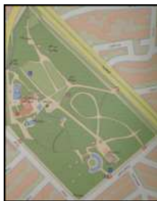
تصویر ۸ - پارک قیطریه.