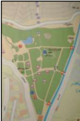
تصویر ۶ - پارک جمشیدیه.