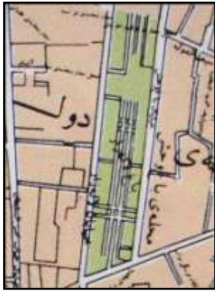
تصویر ۲ - باغ لاله زار.

با بررسی آثار برخی از باغ‌های به جای مانده از آن زمان و همچنین با مراجعه به متون و نقشه‌های اولیه پایتخت، می‌توان دریافت که الگوی طراحی این باغ‌ها برگرفته از همان سبک باغ سازی ایرانی است. باغ نگارستان در شمال میدان بهارستان از جمله باغ‌هایی از آن دوره است که قسمتی از آن باقی است و رد پای الگوی باغ ایرانی در آن به چشم می‌خورد.