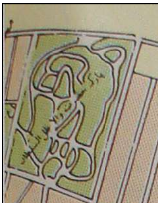
تصویر 4 - پارک ظل السلطان.

" خداوندان مجد و شرف بزودی در مسئله گل و گیاه و کاشتن و اراستن آنها با یکدیگر به مبارزات سخت پرداختند. دولتمردان دست و دل باز از دیگر کشورها، قلمه ها، تخم گل و گلدان های گوناگون فراهم آوردند و باغبانان حاذق و گلکاران فایق، با شتاب تمام در دامان کوهسار البرز و پیرامون تپه ها و سطح هر بیابان، صفه و هر سامان باغ های فراخ برآوردند و بیاراستند. . . . در کامرانیه که در دامنه البرز قرار داشت باغی بزرگ با باغچه بندی ها و گلکاری های به طرز اروپا احداث کردند. در گرمخانه این باغ در بجهوه گرمای تابستان و شدت سرمای زمستان انواع گل ها و ریاحین به قولی سبزی ها به عمل می آمد و در سال مبالغ گزافی صرف باغبانی و گل کاری و سرایداری و دیگر خدمات این محل ها می شد. " [همان]