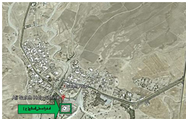
تصویر ۱. موقعیت امامزاده علی‌الصالح (ع) در شهر صالح‌آباد.

ریشه اولین بنای امامزاده علی‌الصالح (ع)، به زمان هلاکوخان مغول می‌رسد (درخشنده، ۱۳۹۰ : ۱۷۹) یعنی قرن هفتم هجری و حاکمیت نظام کوچ‌نشینی در سرزمین ایلام، که می‌تواند عامل اصلی تشکیل نشدن شهر به واسطه وجود امامزاده تا زمان اسکان اجباری عشایر باشد. شهر صالح‌آباد در حدود ۴۰ کیلومتری جنوب غرب شهر ایلام در استان ایلام قرار دارد. در دهه ۳۰ دارای ۷۵۸ نفر جمعیت بوده و در سال ۱۳۴۳ از دهستان به بخش تبدیل شد و شهر صالح‌آباد امروزی مرکز آن و تابع شهرستان مهران است (طرح هادی شهر صالح‌آباد، ۱۳۸۵ : ۴۸). نام قدیم منطقه صالح‌آباد، هجدان‌دشت بوده است که بعدها به دلیل وجود امامزاده، به نام فعلی تغییر یافت (تصویر ۱).