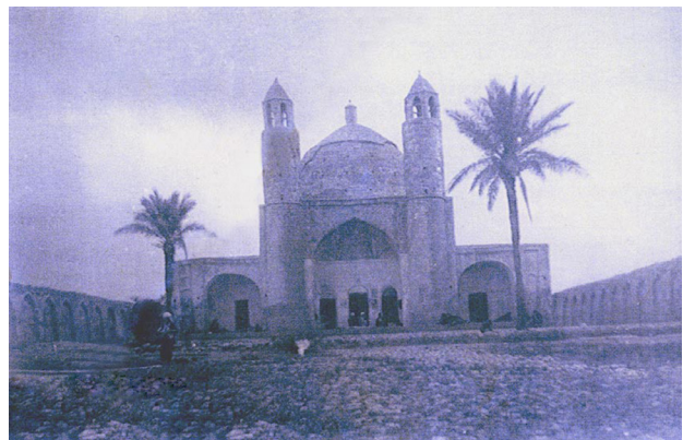
تصویر ۲. عکس قدیم امامزاده علی‌الصالح (ع).