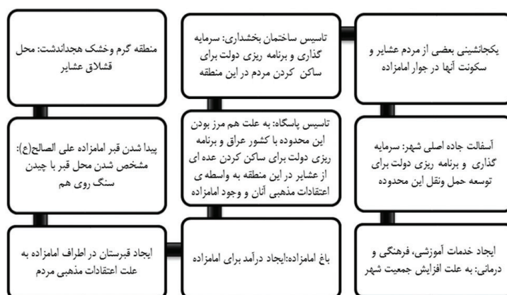
نمودار ۱. روند شکل گیری شهر صالح آباد.

بررسی سیر تکاملی شهر صالح آباد و پیشینه حضور امامزاده علی الصالح (ع) در این منطقه نشان می دهد که امامزاده از دو جهت در شکل گیری شهر صالح آباد مؤثر بوده، یکی از نظر حضور و سکونت مردم در این منطقه به علت اعتقادات مذهبی و دوم از نظر جلب مشارکت و سرمایه گذاری دولت برای ایجاد شهر. با توجه به مرزی بودن صالح آباد، این شهر از نظر امنیتی و سیاسی یک قدرت برای دولت محسوب می شود (نمودار ۱).