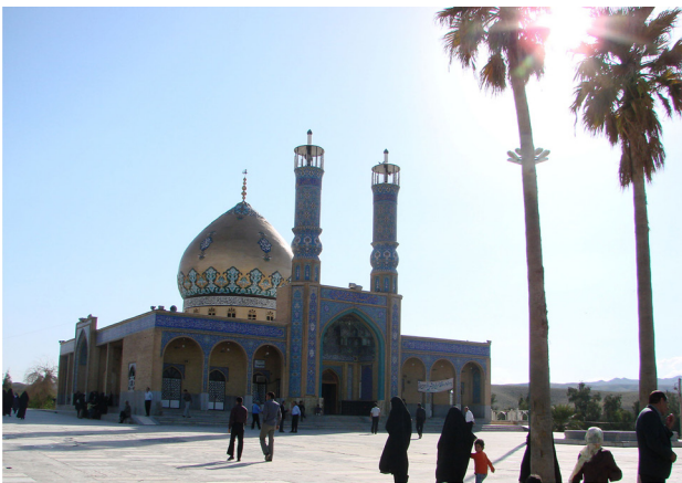
تصویر ۳. امامزاده علی‌الصالح (ع)، بنای فعلی.