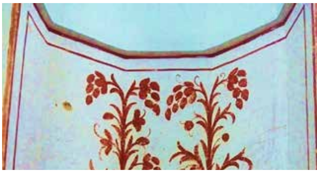
تصویر ۱۱. فرش قاب‌قابی با گربه‌سانان، ایران، سده‌های ششم و هفتم میلادی.

یکسان است که بخشی از آن سالم مانده، اما خال‌های موجود بر پوست زیتونی‌رنگش گویای پلنگ‌بودن آن است. در مقابل این حیوانات هم نقوش کوچک گیاهی وجود دارد. در حاشیه قاب‌های چهارگوش کوچک‌تری با نوارهای راه‌راه آبی و سفید وجود دارد که از قاب‌های اصلی زمینه به‌طرز غیرمتعارفی بزرگ‌ترند. نظایر کاربرد قاب مربع در حاشیه در نمونه‌های دیگر نیز به چشم می‌خورند (بنگرید به تصویر ۳).