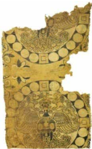
تصویر ۶. قطعاتی از یک لباس، چین یا آسیای میانه، سده‌های ششم و هفتم میلادی. مأخذ: Spuhler, 2014, 110.

تفاوت بنیادین دارند. قیاس نحوه صف‌بندی حیوانات در این دو فرش آشکار می‌کند که آنها به قصد پهن کردن به صورت موازی با هم، مثلاً برای استفاده در راه منتهی به تخت پادشاه، بافته نشده‌اند (Spuhler, 2014, 40).