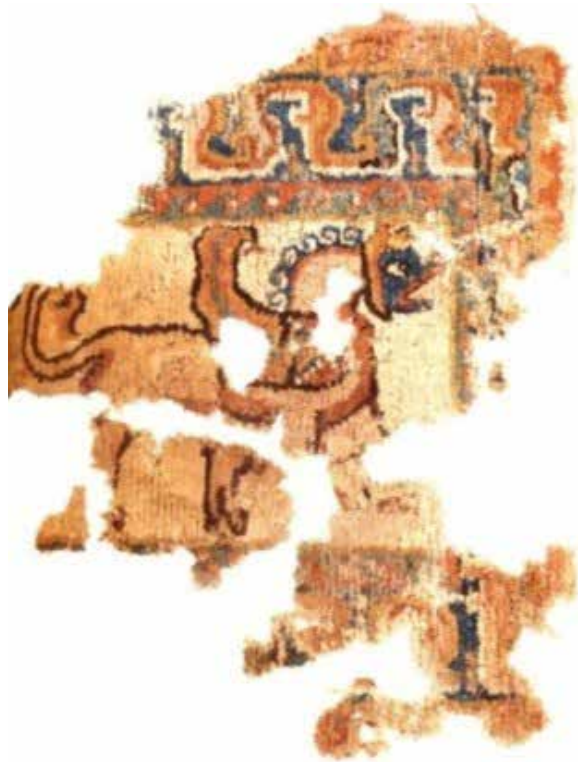
تصویر ۷. موجود اساطیری، شرق ایران، سده‌های چهارم تا ششم میلادی.

این می‌تواند نمایانگر حمله شیر به میش از پشت سر باشد. بخشی از دم شیر یا هر حیوان درنده‌ای در سمت چپ نزدیک به حاشیه قابل مشاهده است. صحنه‌های نبرد حیوانی سبک رایجی است که در آثار هنرمندان ایرانی از روزگار باستان تا ساسانیان و حتی در دوره اسلامی حضور داشته است. در تصویر ۹ سرگوزن نری با انار یا شکوفه‌ای به دهان در امتداد بخشی از پاهای عقب موجودی با دم رو به بالا به رنگ سبزآبی، قرار گرفته که قابل شناسایی نیست. حاشیه آبی‌رنگ آن با برگ‌های دندان‌دار رنگارنگ پر شده است. نگاره سگ دونده