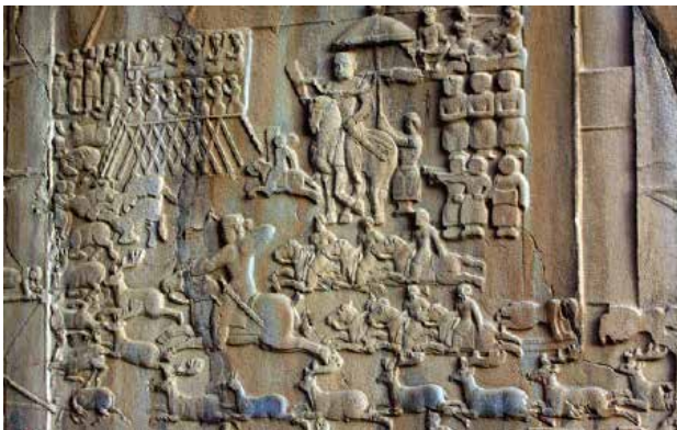
تصویر ۱. شکار گوزن، طاق بستان.

• نمونه‌های به‌دست آمده از کاوش‌های باستان‌شناسی فرش‌پاره‌هایی توسط «کوزلف» از دل یخ در منطقه «نوین‌اولا» ۲ بیرون آورده شد که به احتمال نزدیک به یقین، جزء کالاهایی بود که از آسیای غربی به چین می‌رفته است. از آنجا که تاریخ فرش‌پاره‌های «نوین‌اولا» اوایل سده اول میلادی و میانه دوره اشکانی است، انتساب آنها به دوره اشکانی درست می‌نماید؛ همچنین ۴۰ فرش‌پاره گره‌دار در غار عطار عراق یافت شده است که براساس آزمایش کربن ۱۴، مربوط به سده سوم قبل از میلاد تا سده سوم میلادی (دوره اشکانی و اوایل ساسانی) هستند (Fujii & Sakamoto, 1993, 35-46).