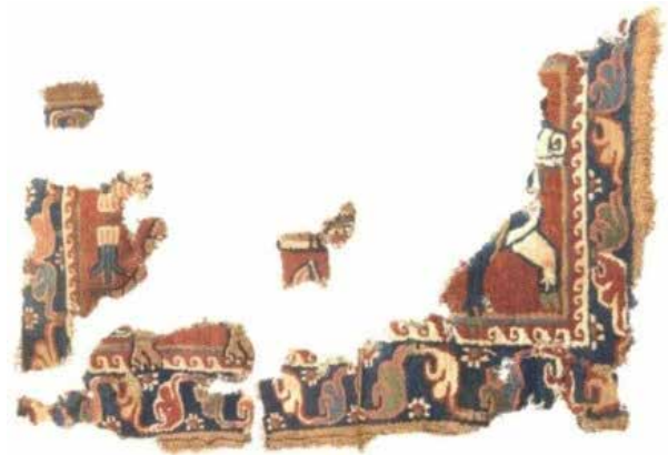
تصویر ۸. صحنه نبرد حیوانی، شرق ایران، سده‌های پنجم و ششم میلادی.