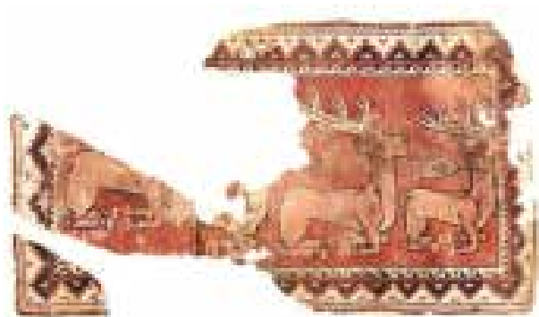
تصویر ۱۰. گوزن‌های نر شکار شاهانه، شرق ایران، سده‌های پنجم و ششم میلادی. مأخذ: صباحی، ۱۳۹۵، ۳۷.

تیره که از طوماری‌های برگ کنگره‌دار و نیم‌شکوفه‌ها با فواصل منظم تشکیل شده است، از سمت زمینه یک حاشیه باریک وجود دارد که در آن طرح سگ دونده قرمز و سفید نقش بسته است. خارجی‌ترین حاشیه با رنگ زردقهوه‌ای سراسر محیط فرش را در بر گرفته است. دو پنجه شیر با چنگال‌های متمایز بر حاشیه باریک سگ دونده دست‌اندازی کرده است.