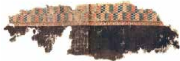
تصویر ۴. تکه‌ای از حاشیه با طرح موزاییکی، شرق ایران، سده‌های دوم تا چهارم میلادی. مأخذ: صباحی، ۱۳۹۵، ۳۷.