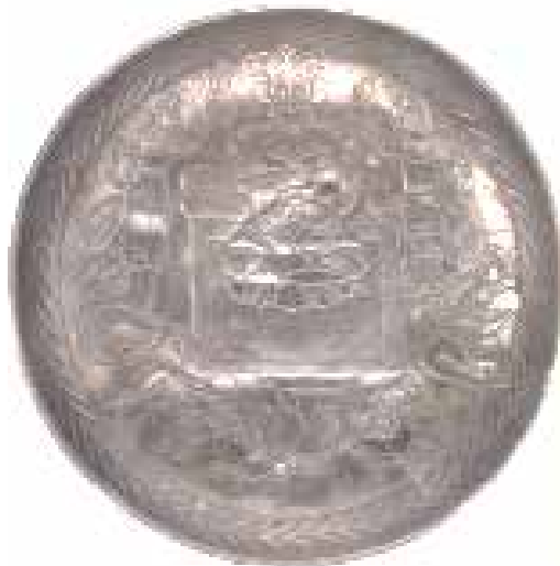
تصویر ۲. نقش پادشاه نشسته بر فرش، بشقاب نقره‌ای دوره ساسانی، قطر ۲۵/۷ سانتی‌متر، موزه دولتی ارمیتاژ سنت پترزبورگ.

قالی‌هایی که کاخ‌های سلطنتی را مزین می‌کرده اغلب با موضوعاتی تزئین یافته بود که متناسب با وقایع مختلف درباری و زندگی شاه انتخاب می‌شد و مفهوم رمزی و نمادین داشت. قالی‌هایی که نمایانگر چهار فصل بودند و اتاق مخصوص خسرو دوم را مزین کرده بودند شهرت زیادی داشتند (بوسایلی و شرانتو، ۱۳۸۳، ۱۰۳) اما مهم‌ترین فرش ساسانی که اطلاعات کاملی از آن توسط مورخان برجای مانده فرش بهارستان معروف به «بهار خسرو» است. گفته شده که این قالی را خسرو انوشیروان برای سرسرای کاخ ساسانی در تیسفون سفارش داده بود. محمد بن جریر طبری در توصیف فرش بهارستان می‌گوید: «بساطی یافتند از دیبا شست ارش اندر شست ارش ... به زمستان باز کردند بدن وقت، وقتی که هیچ جای گل شکفته نبود و به جهان اندر سبزی نبود و آن بساط را گرداگرد کناره‌اش همه به زمرد و زبرجد سبز یافته ... و عمر آن همه گوهرها و آن بساط را پاره‌پاره کرد و هرکس را به قسمت راست کرد» (طبری، ۱۳۵۲، ج. ۱، ۱۷-۱۸). فرش بهارستان هنگام فتح تیسفون به‌دست جنگجویان فاتح افتاد و به‌عنوان یک غنیمت جنگی به قطعاتی تقسیم شد و هر قطعه آن به فردی واگذار شد (ابن مسکویه، ۱۳۷۶، ج. ۱، ۳۲۶). نظرگاهی که امروزه نسبت به فرش بهارستان وجود دارد در آن روزگار به‌ویژه در میان اعراب وجود نداشت و آنها تنها از دید اقتصادی به این فرش توجه داشتند (آبخیز و همکاران، ۱۳۹۵، ۱۴).