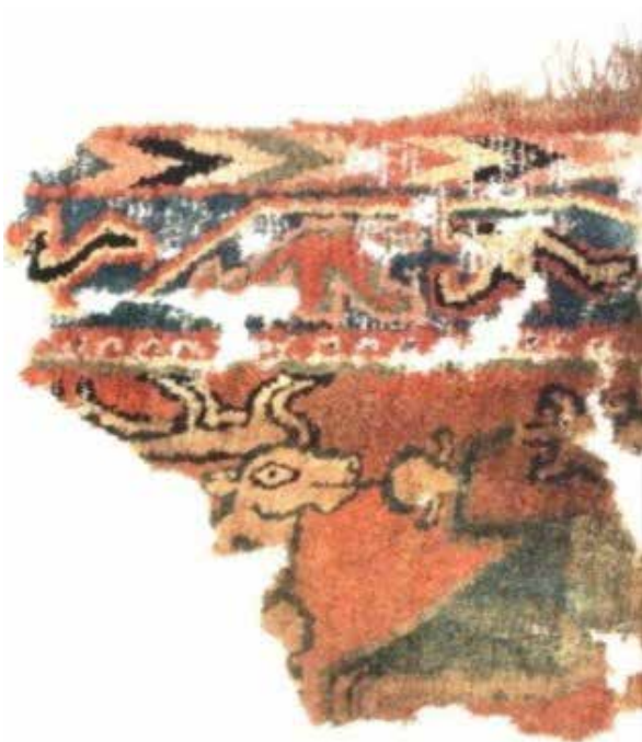
تصویر ۹. تکه‌ای با سر گوزن نر، شرق ایران، سده ششم میلادی.