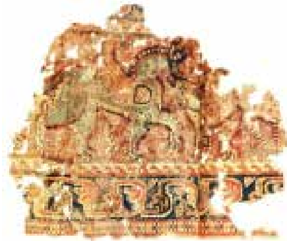
تصویر ۵. ردیفی از موجودات اساطیری، شرق ایران، سده‌های چهارم تا ششم میلادی.