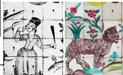
د (راست: وضع موجود؛ چپ: وضع قدیم)