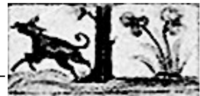
ز (وضع قدیم)