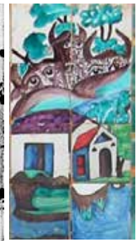
ح (وضع قدیم)