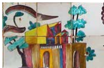
و (وضع موجود)