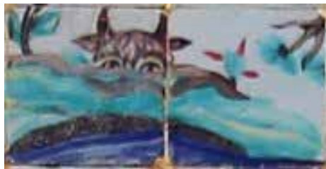
ب (وضع موجود)