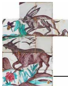
ه (وضع موجود)