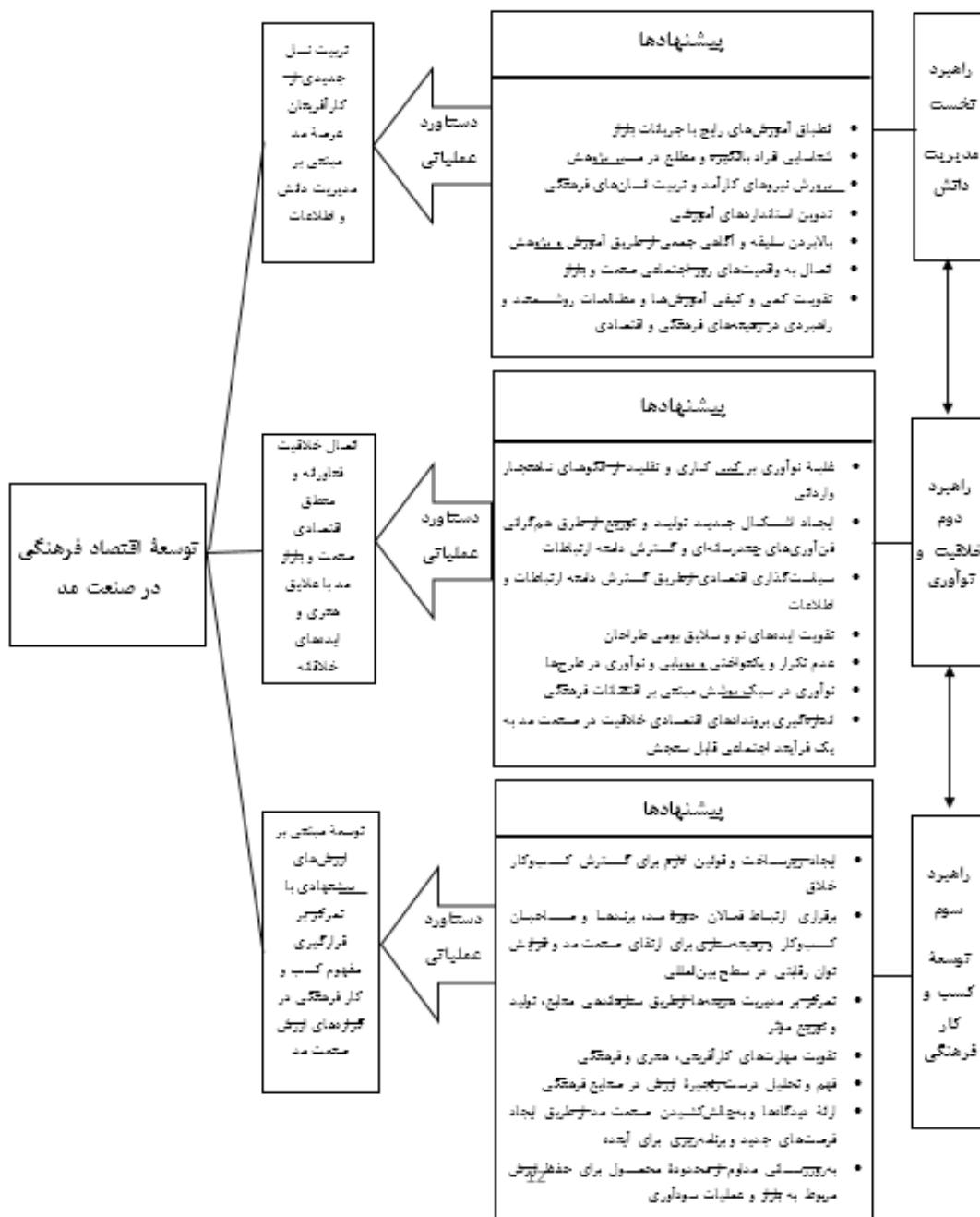
تصویر ۲. کاربست یافته‌ها: ایجاد یک مدل برای برکشیدن اقتصاد خلاق در صنعت مد ایران.