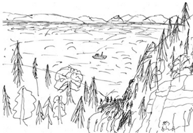
تصویر ۱. نمونه‌ای از تصاویر ذهنی و نقشه‌های شناختی مبتنی بر روش‌های گوناگون. مأخذ: Ueda et al., 2012; Oliver, 2007; de Jonge, 1962. Fig1. Mental images & maps based on various techniques. Source: Ueda, et al., 2012; Oliver, 2007; de Jonge, 1962.