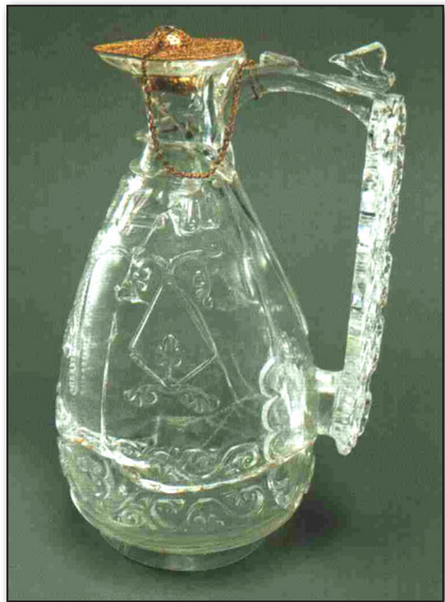
تصویر ۲. ابریق. گنجینه سنت دنیس پاریس. قرن دهم میلادی.