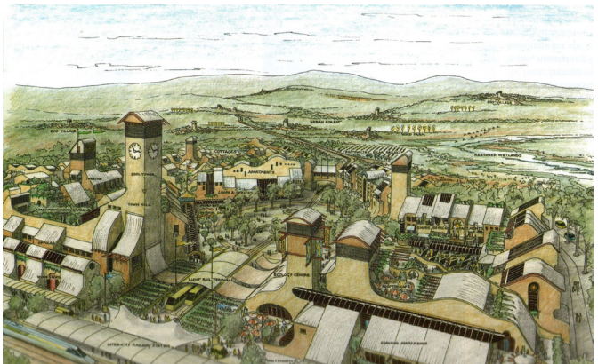
تصویر ۳. طرح از بوم‌شهر ترسیم شده توسط داونتون مأخذ: Downton, 2009: 316. Fig. 3. Conceptual drawing of Ecocity by Downton, Source: Downton, 2009: 316.