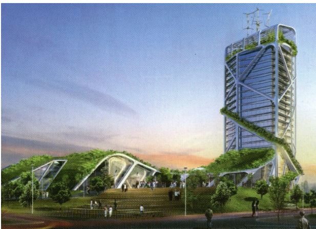
تصویر ۴. طرح از بوم‌شهر براساس ایده یانگ مأخذ: Yeang, 2009: 10.

از این دیدگاه پنج عامل برنامه‌ریزی در یک بوم‌شهر وجود دارند که شامل کالبد و چهار بخش توسعه شهری ساختار شهر، حمل و نقل، جریان مواد و انرژی و عوامل اقتصادی اجتماعی است. کالبد به محیط‌های طبیعی و مصنوعی اشاره دارد که تحت تأثیر شهر واقع شده‌اند و به کمک شهر به یکدیگر متصل شده و باعث ایجاد چارچوبی عمومی جهت درک عملکرد درونی شهر می‌شوند. ساختار شهری به واقعیت کالبدی شهر باز می‌گردد که به عنوان یک سامانه درونی در نظر گرفته و شامل تقاضای زمین، کاربری زمین، فضای سبز، افق دید، آسایش شهری، فضای عمومی و ساختمان‌هاست. شیوه‌های متعدد حرکت با سرعت کم، حمل و نقل عمومی، حمل و