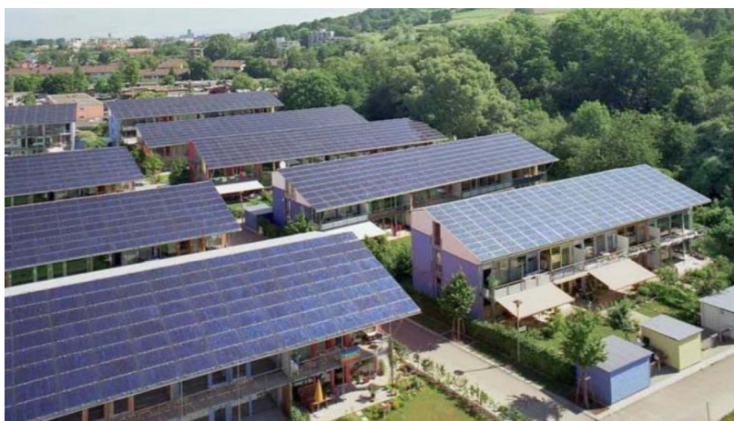
تصویر ۵. نمونه اجرا شده بوم‌شهر در فنلاند.

تجزیه و تحلیل معیارهای شاکله بوم‌شهر از دیدگاه نظریه‌پردازان مختلف، معیارهای مشترکی را حاصل کرد که خصوصیات بستر بومی در ذات آنها نهفته است. بدین معنا که تحقق این معیارها در شهرهای مختلف نه تنها شاکله‌ای واحد برای بوم‌شهرها به دست