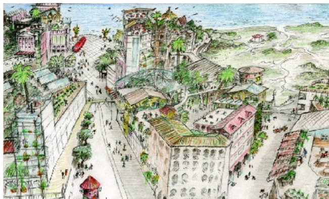
تصویر ۲. طرح از بوم‌شهر ترسیم شده توسط ریچارد رجیستر

به یک اندازه حق حیات دارند" (Register, 2006: 12). وی تعریف خود را به صورت طراحی شاکلۀ مطلوب بوم‌شهر به تصویر می‌کشد. تصویر ۲ نمونه‌ای از این طرح‌ها است. رجیستر در مجموع شاخصه یک بوم‌شهر را در پانزده مورد بیان می‌کند که شامل دسترسی بر مبنای مجاورت، هوای تمیز، خاک سالم، آب سالم و تمیز، منابع و مواد پاسخگو، انرژی پاک و تجدیدپذیر، غذاهای سالم و در دسترس، فرهنگ سالم، ساخت ظرفیت‌های اجتماعی سالم و مشارکت، اقتصاد سالم و عادلانه، تحسیلات مادام‌العمر، کیفیت زندگی، تنوع زیستی سالم، ظرفیت برد زمین و یکپارچگی بوم‌شناسانه می‌شود (Ecocitybuilders, 2013). او برای هر یک از این شاخصه‌ها معیارهایی تعیین می‌کند. معیارهای مربوط به شاکلۀ بوم‌شهر از دیدگاه رجیستر مستخرج از این شاخصه‌ها عبارتند از: – کاربری مختلط و اختلاطی از مساکن جمعی و خصوصی – بافت فشرده و مرکز محور به نحوی که بیشتر نیازها در فاصله قابل پیاده‌روی و دوچرخه‌سواری تأمین شود. – شاخص بودن شبکه‌های حمل و نقل پیاده، دوچرخه، ریلی و حمل و نقل عمومی در تمامی نقاط شهر – افق دید واضح و رنگ‌های شفاف در روزی آفتابی – آسفالت‌زدایی، برداشتن آسفالت از فضای عمومی به منظور جایگزین کردن فضای سبز، پارک و درخت – استفاده از شیوه‌های کاشت و گونه‌های گیاهی بومی، باغ‌سازی