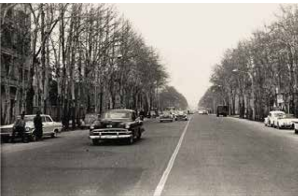
تصویر ۹. خیابان ولیعصر، تهران (۱۳۳۴).