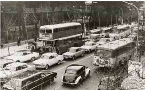
تصویر ۱۱. خیابان ولیعصر، تهران (۱۳۴۰).

گذرهای اصلی و فرعی در شهرها همانند رگه‌ای حیاتی عناصر و آلمان‌های مهم شهر از جمله محله‌ها را به صورت ارگانیک