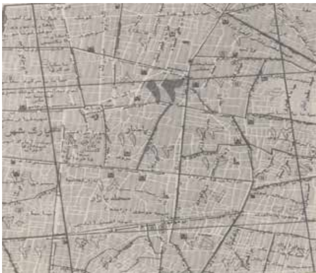
تصویر ۱۴. نقشه منطقه ۱۲ شهر تهران دوره پهلوی دوم، ۱۳۵۵. مأخذ: کیانی، ۱۳۷۰.

پس از خاتمه جنگ تحمیلی در دهه دوم پس از انقلاب و توسعه بی‌رویه شهر تهران توسط مهاجران میزان جمعیت تهران بدون رویه رو به افزایش گذاشت و خارج از حریم طرح جامع تهران در همه جهات شهر تهران توسعه کرد خصوصاً در جنوب شرقی و غربی، شهرهای اغماری بی- شماری شکل گرفتند که بسیاری از آنها در طرح جامع جدید جزء حریم شهر تهران به شمار آمدند و یا به عنوان شهرستان تابعه استان تهران شناخته شدند.