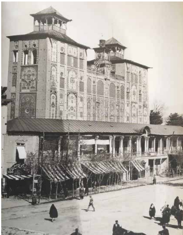
تصویر ۸. عمارت شمس العماره - تهران.