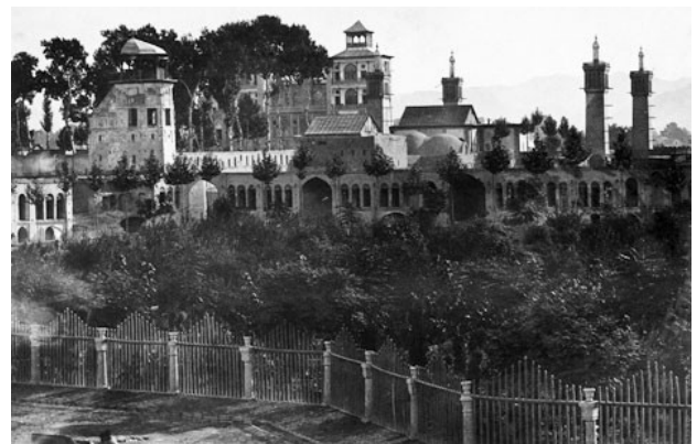
تصویر ۷. کاخ گلستان، تهران.