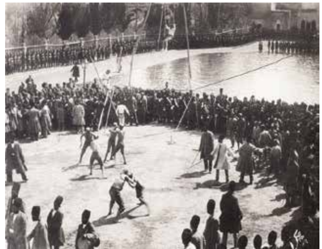
تصویر ۳. اولین نمایش آکروپاتیک و کشتی پهلوانی در تکیه دولت در دوره ناصری. مأخذ: طالب زاده، ۱۳۸۵: ۳۳.

این قبیل فضاهای میانه در بافت تاریخی شهر تهران