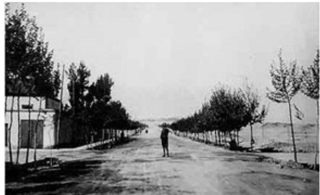
تصویر ۱۰. خیابان ولیعصر، تهران (۱۳۱۵). مأخذ: طالب زاده، ۱۳۸۵.