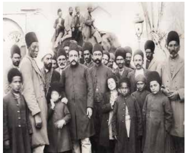
تصویر ۴. اولین نمایش فیل در تکیه دولت در دوره ناصری.