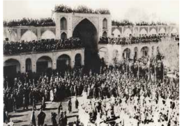
تصویر ۵. مراسم عزاداری در سبزه میدان.

با ورود به مجموعه بازار از دهانه سبزه میدان بخش بزرگی از زندگی در شهر سنتی تهران قابل مشاهده است که در