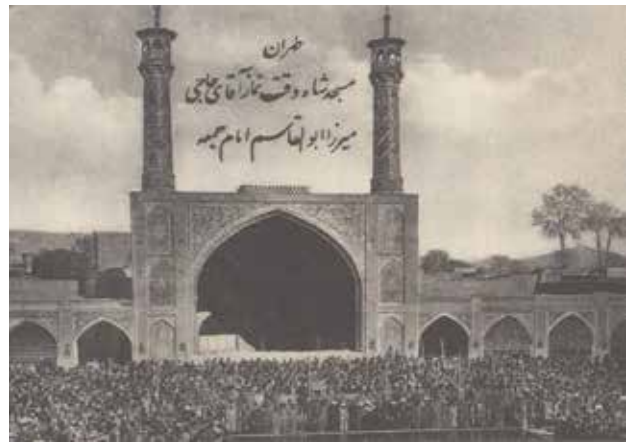
تصویر ۶. مسجد شاه - تهران.