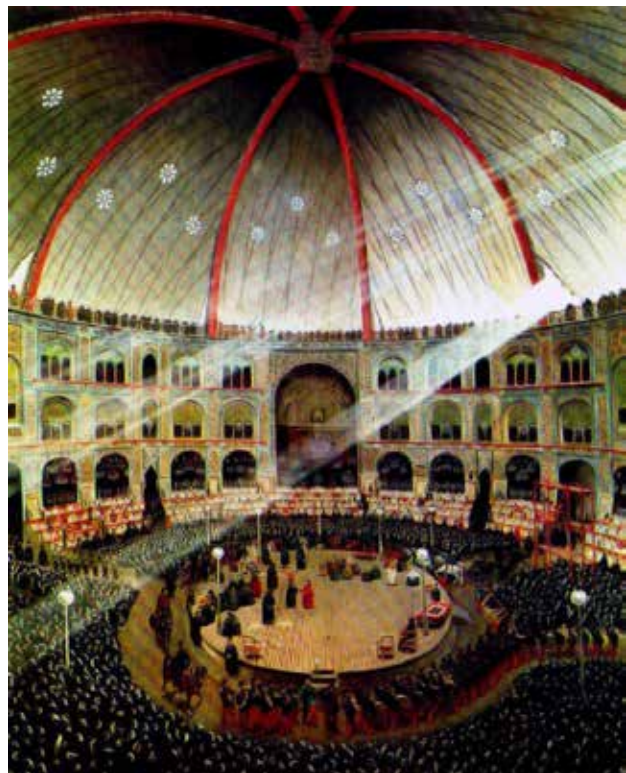
تصویر ۲. تکیه دولت.

این علاقه به حدی بود که با وجود مخالفت‌هایی که در زمینه حضور خارجی‌ان در این برنامه‌ها وجود داشته. ناصرالدین شاه از سفرا و افراد اروپایی مقیم تهران دعوت به‌عمل آورد تا در این مراسم حضور یابند. و از نزدیک این مراسم را تماشا کنند (همایونی، ۱۳۸۰: ۱۳۱-۱۳۰).