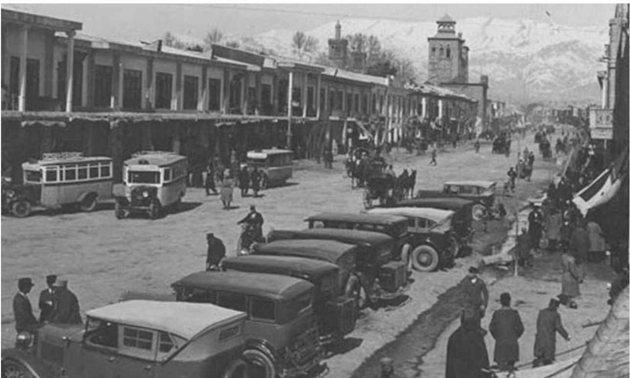
تصویر ۱۲. خیابان ولیعصر، تهران (۱۳۰۰).