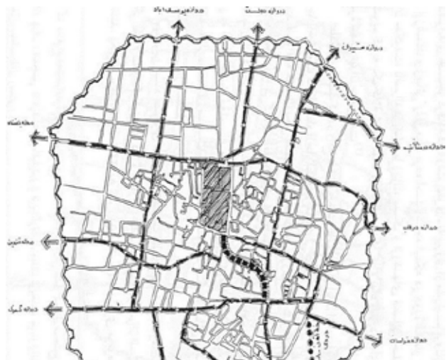
تصویر ۱۳. نقشه ارتباطات اصلی شهری به دروازه‌ها و بازار دارالخلاف، ۱۳۱۱. ه.ش.