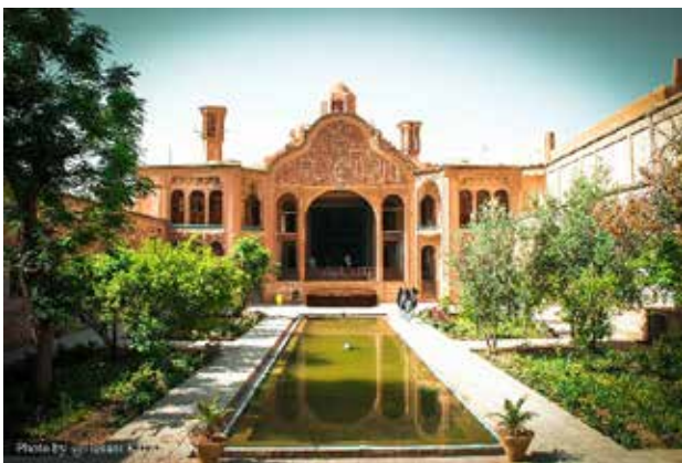
تصویر ۲. حیاط (خانه بروجردی‌ها) به مثابه یک قرارگاه زنده.

می‌شود. در این مرتبت، محیط حیاط نه‌تنها زنده است که ظرفی برای زندگی پدید آورده و به مثابه یک قرارگاه رفتاری عمل می‌کند (تصویر ۲)؛ (Rapoport, 2007: 58-64). فرهنگ ایرانی‌اسلامی برای این قرارگاه، بسته به رفتارهای انسانی حاکم بر آن اعم از سکونت و غیره، مرزهایی نامرئی قائل شده است ۴۸ تا مکمل مرزهای مادی مرتبت قبلی باشد. براساس آموزه‌های قرآنی، سکونتگاه نخستین و پایانی انسان بهشت است ۴۹ . درمقابل این سکونتگاه حقیقی، زندگی در زمین موقتی بوده و تنها یک قرارگاه یا مقر تلقی شده است ۵۰ . دل‌ن بستن به قرارگاه و آمادگی برای رسیدن به سکونتگاه اصیل و جاویدان نیاز به تذکرات نمادین بوده که در حیاط تجلی زیبایی می‌یابد. نظام چهاربخشی باغچه‌های حیاط گوشه‌ای از بهشت‌وارگی آنرا به نمایش می‌گذارد. انعکاس نماهای کالبدی در آب، بر رمز و رازهای عالم فرازمینی تأکید دارد. حضور شاعرانه باد در فضای حیاط و تصادم آن با عناصر طبیعی و زمینی، نمادپردازی‌های دیگری را نمایان می‌سازد. باد در کلام خدا مرتبتی بشارت‌دهنده و آگاهی‌بخش دارد ۵۱ . در ادبیات ایران نیز موقعیت‌های خبرده با استعانت از باد صبا تصویر شده است ۵۲ . در کلام خدا صعود از مرتبت خاک به سوی احدیت به واسطه دمیدن نفس رحمانی بوده که بر مضامینی همچون روحبخشی ۵۳ و فراخوانی ۵۴ تأکید دارد. تنها در پناه اتصال به این روح قدسی است که مصنوعات زمینی به مرتبتی بالاتر وارد می‌شوند ۵۵ . اتصال مستقیم زمین با آسمان در فضای حیاط، بر این مضامین صحنه گذاشته و آن را به شکل نمادین نمایان می‌سازد. بازی نور و سایه و تلاش در