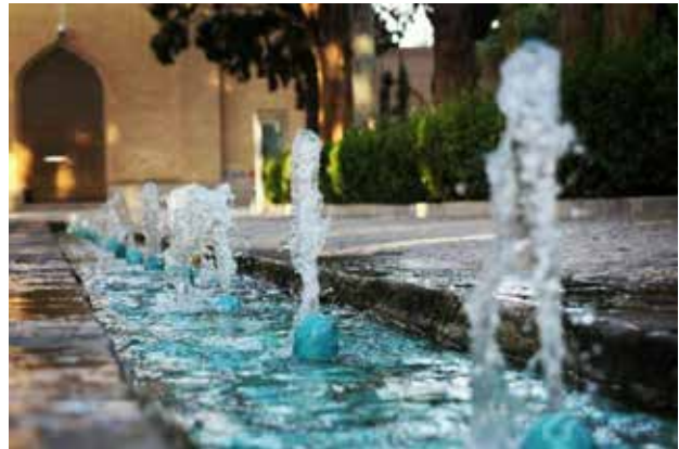
تصویر ۳. حیاط (باغ فین) در پرتو نمادپردازی‌های متعدد به مثابه سکونتگاهی الهی و معنوی.

محدوده یا جایگاه مادی کمک می‌کنند. این جایگاه علاوه بر مرزهای فیزیکی، از طریق مرزهای نامرئی معین نظیر حریم و غیره که برگرفته از بینش اسلامی است، تقویت می‌شود. محدوده فضایی ایجادشده، در درون خود عناصر متعددی از جمله حوض آب، کفسازی‌ها، باغچه‌ها، گل‌ها، درختان، انسان و غیره را احاطه می‌کند. انسان با حضور در این حیاط از اتفاقات جاری در آن آگاهی می‌یابد. به عبارت دیگر آگاهی یافتن از امور حیاط نیازمند احاطه حسی (یعنی بصری، لامسه، ...) بر آن است. علاوه بر این حضور همین عناصر طبیعی به حیات حیاط کمک می‌کند. بسیاری از جنبه‌های طبیعی و مادی موجود در حیاط نمادها یا نشانه‌هایی معنوی را در خود به نمایش می‌گذارند؛ به‌گونه‌ای که شمایی از سکونتگاه جاویدان بهشتی را برای انسان متذکر می‌شود. مقایسه تعاریف ارائه‌شده از محیط و حیاط که از زبان، بینش و معماری اسلامی حاصل شده است، چند نکته در خود دارد: نخست آنکه دلالت‌های معنایی محیط در زبان فارسی و بینش اسلامی قرابت نزدیکی دارند. از سوی دیگر دلالت‌های معنایی حیاط در زبان فارسی، بینش اسلامی و معماری ایرانی‌اسلامی قرابت نزدیکی دارند. علاوه بر این، مقایسه تعاریف فوق مؤید نزدیکی محیط و حیاط است.