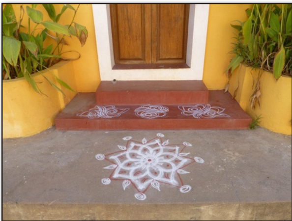
تصویر ۶ نقاشی کولم در مقابل ورودی خانه.

«تردید و بروز جدایی حقیقت از زیبایی (نظریه دکارت) در قرن ۱۸. و قوت‌بخشی حسی و دریافت تجربی و همچنین تسلط نظام سرمایه‌داری در قرن بیستم و ایجاد ملاک‌های ارزشیابی و دادوستدی در جامعه، هنر را نیز به کام خود کشید و به‌مانند کالایی در مسابقه مبادلات قرار داد (موزه‌ای شدن و کلکسیون‌داری)» (امامی‌فر، ۱۳۸۷: ۹۶). اما «عصیانگری و شورش علیه ضوابط خشک مدرنیسم از یک‌طرف و تنوع و تکثرگرایی زندگی صنعتی معاصر انسان متجدد، دنیای شرطی شده علائم و نشانه‌ها را به وجود آورد و در این میان هنرمند معاصر توانست بر روی این موج قوی بنیان‌شکن سوار شود و سعی کند که با شیوه‌های جدید به بیان بعضی از مفاهیم از دست‌رفته اقدام کند» (همان). هنر هنرمند جدید و ایده‌محور به دلیل تعدد رسانه‌های بکار گرفته،