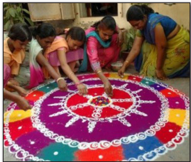
تصویر ۱. زنان در حال نقش کردن کولم.