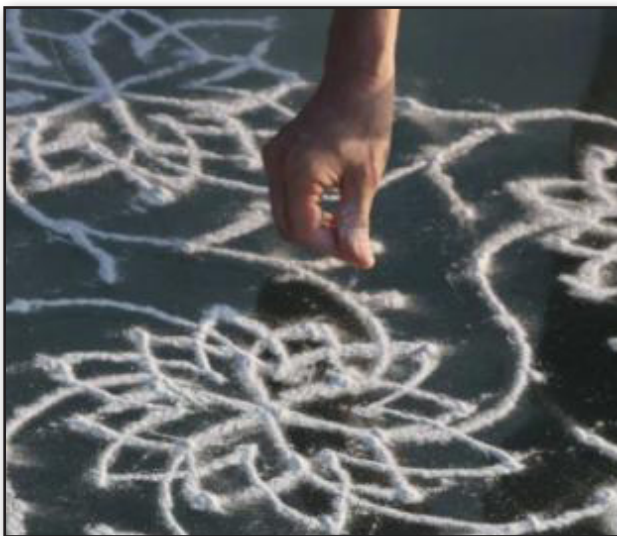
تصویر ۲. نقوش هندسی کولم.

کولم، نقاشی زمینی است که به‌منظور تزئین حیاط خانه‌ها، درب منازل و معابد و اتاق‌های نیایش توسط زنان محلی هندو در ایالت «تامیل نادو» ۳۹ ، بر روی زمین کشیده می‌شود. این زنان به‌طور