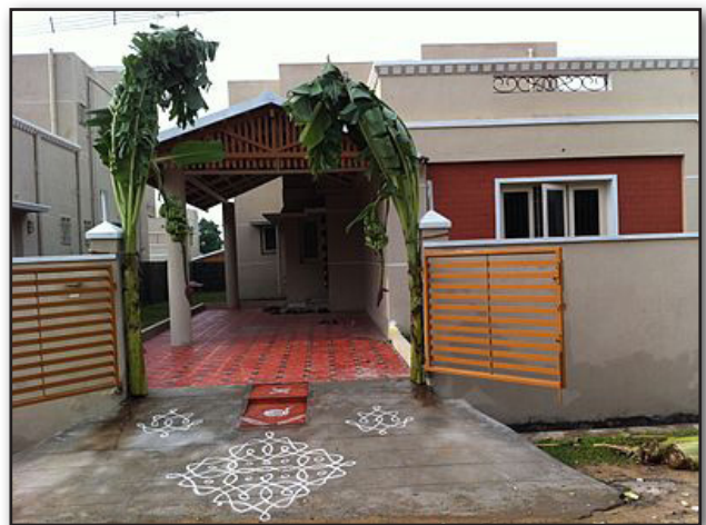
تصویر ۳. نقش کولم بر ورودی خانه‌ها.

در دوره‌ای زندگی می‌کنیم که دیگر نمی‌توان از دنیای جدید تلقی زمانی یا مکانی صرف داشت؛ یعنی گرچه این دنیای جدید در زمان و مکان خاصی تحقق پیدا کرده و رشد یافته، اما از مختصاتی