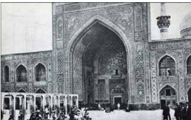
تصویر ۲. نمونه واقعی، عکس ایوان مسجد گوهرشاد، ۸۴۱-۸۲۰ هجری.

بهباد» طراح فرش و قالی که در زمان پهلوی اول، مؤسس مدارس نوین نقاشی در ایران شد.