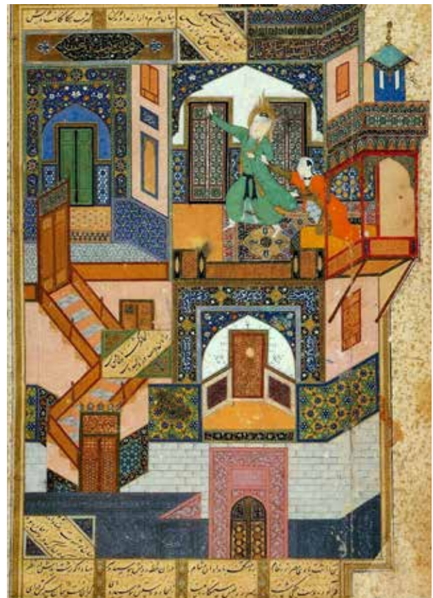
تصویر ۳. نگاره گریختن یوسف از زلیخا، اثر بهزاد، مکتب هرات، از بوستان سعدی، نسخه محفوظ در کتابخانه قاهره، ۸۹۳ ق ۱۴۸۸ میلادی.

برخی از اصول معماری ایرانی از جمله درون‌گرایی، رابطه هندسی و معنایی عمیقی در عناصر تصویری در نگاره‌ها ایجاد کرده است و عناصر شکلی و اجزای آن نیز نقش مهمی در نگاره بررسی شده (مکتب بهزاد) دارند. این اصول در فضای نگارگری با هدف نمادینه کردن آن به کار رفته‌اند و به همین خاطر فضای نگارگری فضایی نمادین و مفهومی است. به عنوان مثال، در موارد متعدد، از عنصر «در» (نگاره انتخابی گریز یوسف از زلیخا، جدول ۵)، علاوه بر مفهوم کارکردی آن، به عنوان محلی برای گذر از برون به درون، با الهام از اصل «درون‌گرایی» استفاده شده است. در بعضی موارد، حتی مفهوم نمادین نیز دارد. علی‌رغم وجود تفاوت‌هایی که در نوع بیان و مصور کردن این اصول در هر دو هنر (از جمله تناسبات