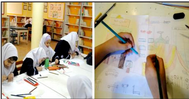
تصویر ۲. کودکان در حال طراحی محیط دلخواه خودشان، در محل کانون پرورش فکری کودکان قوچان.

Fig1. Justification of children in the "Child-Friendly City" (CFC) at the center of Intellectual Development of Children Quchan.