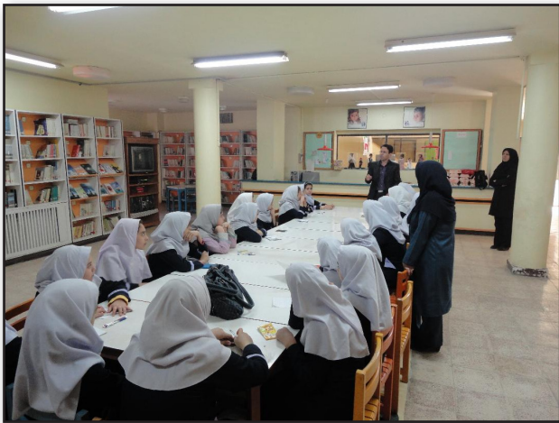
تصویر ۱. توجه کودکان در مورد شهر دوستدار کودک در محل کانون پرورش فکری کودکان قوچان.

Fig1. Justification of children in the "Child-Friendly City" (CFC) at the center of Intellectual Development of Children Quchan.