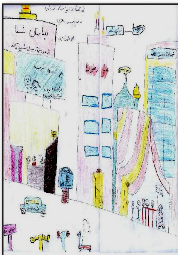
تصویر ۴. شهر مورد نظر کودکان.