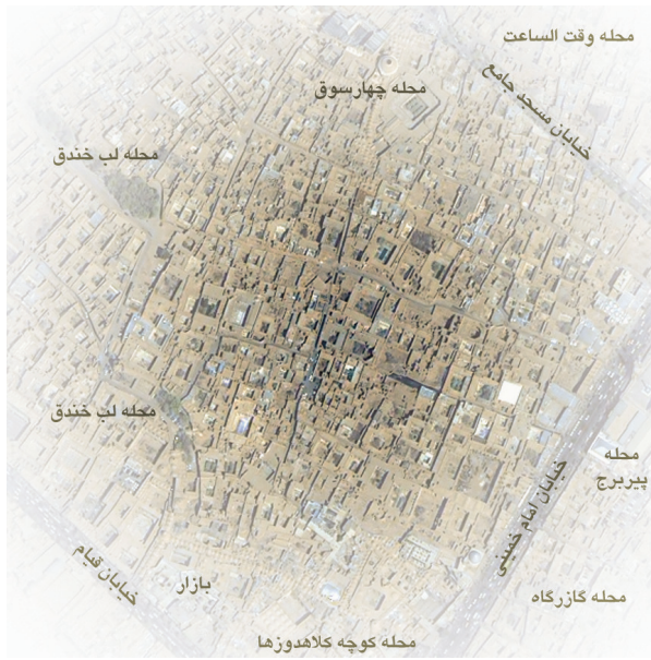
Fig.1. The neighborhoods respectively from top to bottom: neighborhood of Dār-osh-Shafā, neighbourhood of Sahl Ibn Ali, neighbourhood of Posht-e Bāgh.

تصویر ۱. موقعیت محله‌ها به ترتیب از بالا به پایین؛ محله دارالشفاء، محله سهل‌بن‌علی و محله پشت باغ.