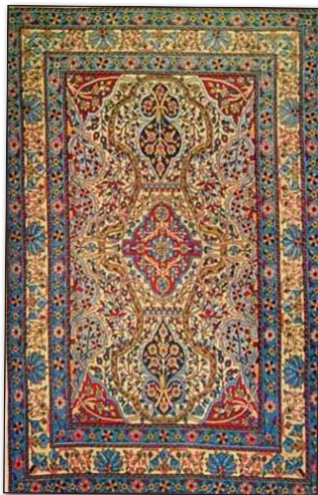
تصویر ۲. قالی ترنج‌دار، محل بافت: یزد.