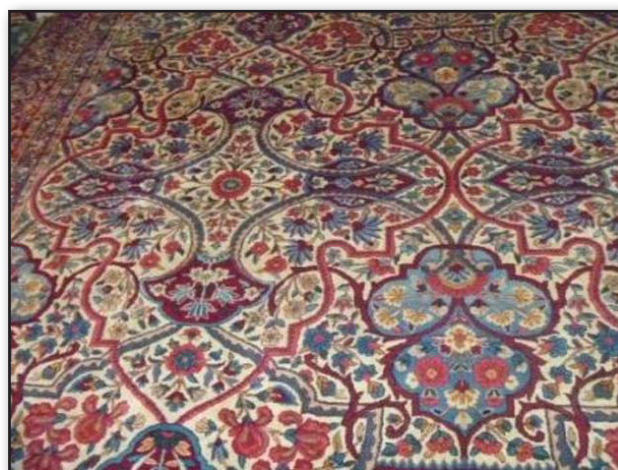
تصویر ۴. قالی با طرح سردار جنگی، مجموعه آقای غفاری.

بدون شک نام این قالی با لقب سردار نصیرخان بختیاری در ارتباط است، لیکن از لحاظ هم‌نشینی نقوش و محتوای کلی طرح که با