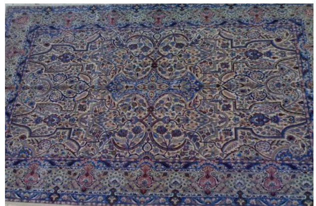
تصویر ۶. قالی با طرح امیرجنگی موجود در اتحادیهٔ قالی دستباف استان یزد.