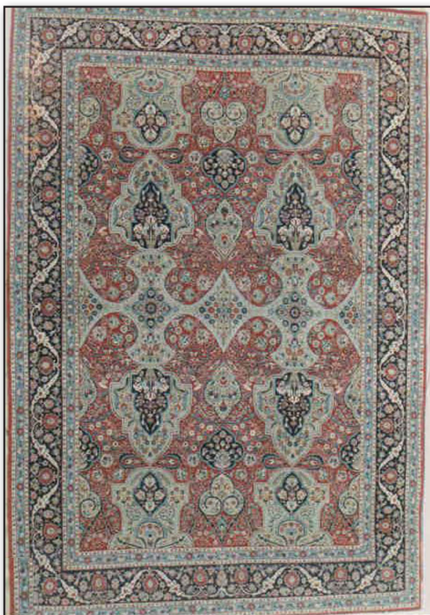
تصویر ۵. قالی با طرح سردار جنگی.

طرح امیر جنگی متشکل است از واگیره‌ای که در طول و عرض قالی تکرار می‌شود. این طرح دارای قاب‌هایی با رنگ یکسان و