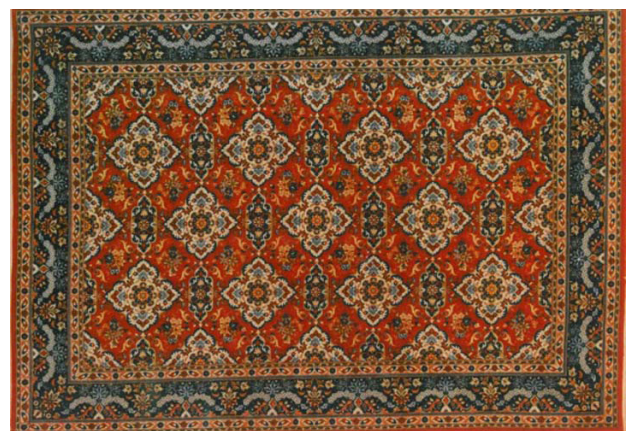
تصویر ۹. قالی با طرح تال و خونچه.