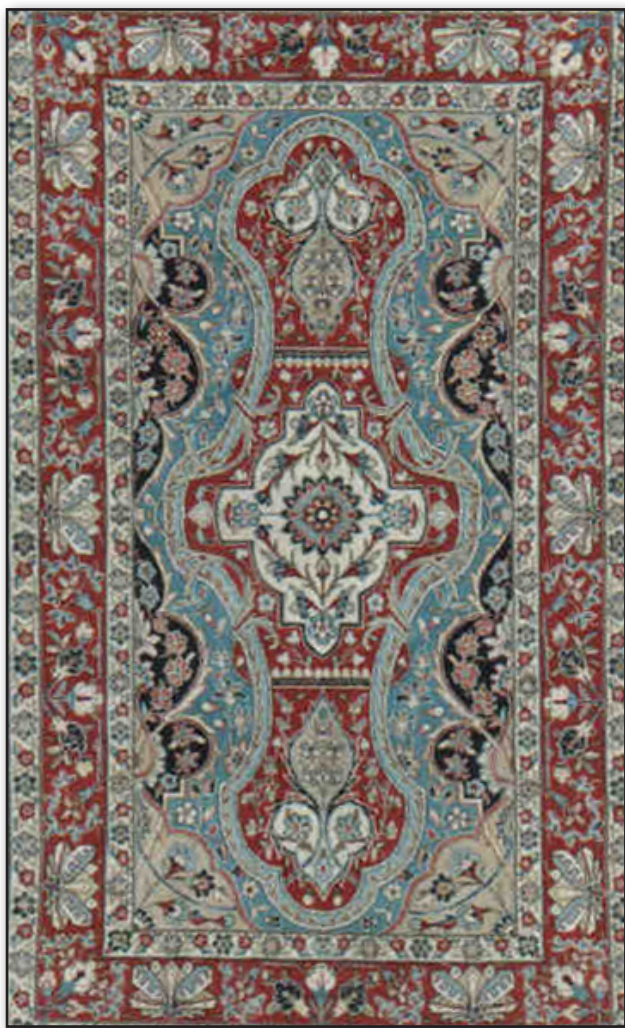
تصویر ۳. قالی ترنج‌دار، از مجموعه قالی‌های احیاء شده در یزد.

نقش ماهی و گل هشت‌پر از مهم‌ترین و پرکاربردترین نقوش به کار رفته در هنرهای بومی یزد به ویژه هنر سفالگری، زیلوبافی و النگوسازی به شمار می‌روند. به نظر نگارنده ثابت بودن رنگ سرمه‌ای برای زمینه این قالی، نشانی از آب برای حیات ماهیان است. کمبود آب، باران‌خواهی و تأکید بر تکرار آن به واسطه واگیرهای بودن طرح و در نهایت حضور این قالی زیر پای نمازگزاران