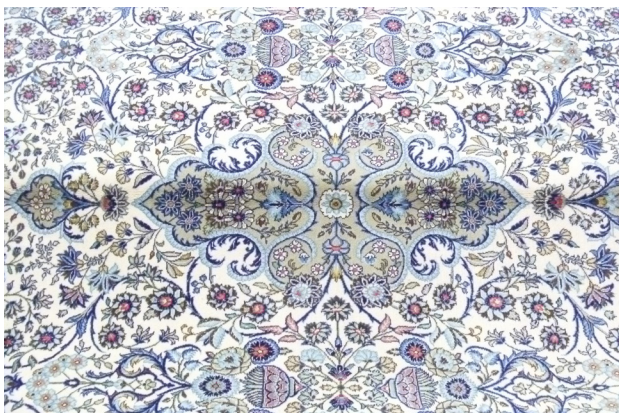
تصویر ۷. نمونه امروزی قالی امیر جنگی، مجموعه آقای علی مُندگاری.

"این قالی معمولاً در هفت‌رنگ، لاجوردی یا سرمه‌ای، لاکه، کرم یا سفید قهوه‌ای، دارچینی و فیروزه‌ای بافته شده است. فیروزه‌ای از رنگ‌های مهم قدیمی بوده که بعدها منسوخ شد. این قالی معمولاً در