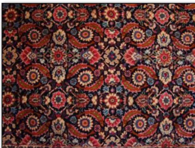
تصویر ۱. قالی دستباف یزد با طرح هراتی، موجود در مسجد تاریخی نظرکرده یزد عکس: منیره عطرگیران.

در برخی قالی‌ها، مانند آنچه در تصویر ۱ مشاهده می‌شود، بافنده تلاشی برای پنهان کردن نقش ماهی نداشته و حتی با نشان دادن آن به رنگ قرمز و ایجاد تالو با رنگ سفید در فلس‌های آن، به نقش ماهی تأکید ورزیده است. در میان دو ماهی گلی با ۱۶ پر وجود دارد که این ویژگی در نمونه‌های دیگر موجود در یزد دیده نشد.