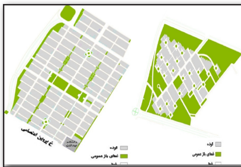
تصویر ۲. تصویر راست: فضاهای باز و ساخته شده کوی علوم پایه در یک تفکیک دوربرگردان. تصویر چپ: فضاهای باز و ساخته شده کوی انصاریه در یک تفکیک ترکیبی. Fig 2. Right-open and built spaces in Olom Pave neighborhood in a cul-de-sac pattern-Left: open and built spaces in Ansariye neighborhood in a grid-cul-de-sac pattern.

نمودار ۲. راست: جایگاه تفکیک اراضی در طرح‌های گسترش موفق جهانی. چپ: جایگاه تفکیک اراضی در گسترش‌های شهری در ایران.