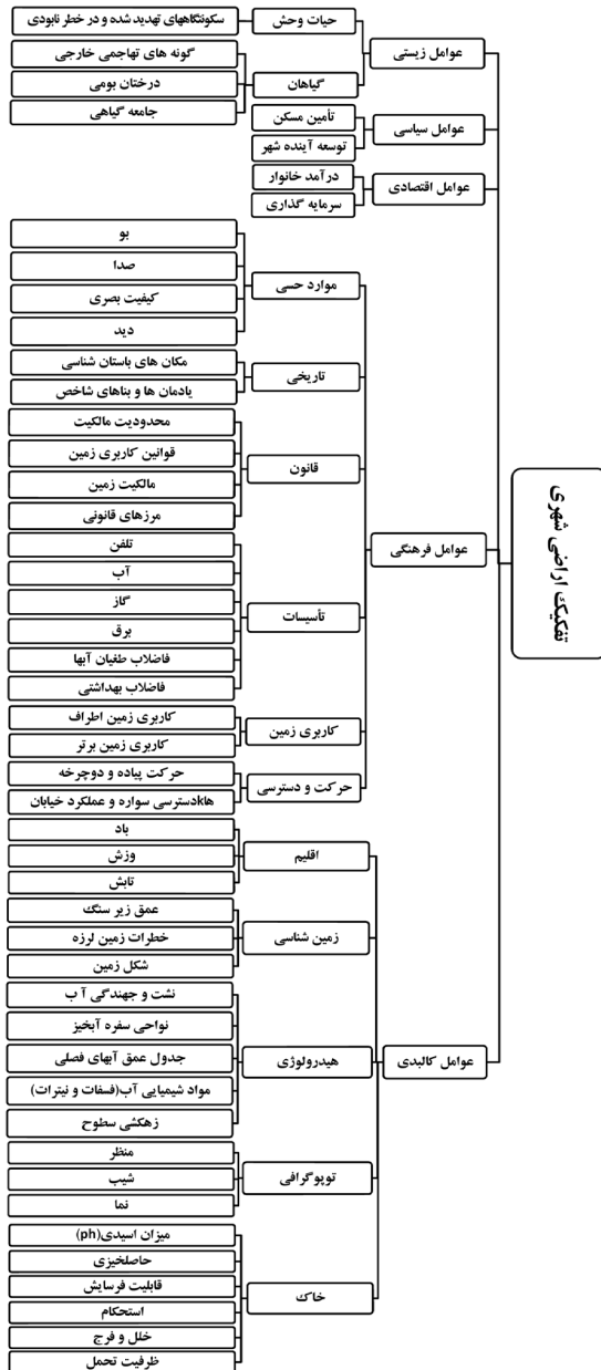
Diagram 1. Influential factors in urban land subdivision in successful global examples.

مسکونی است؛ در حالی که براساس دیدگاهی که در اینجا مورد بحث قرار گرفت، باید آن را مفهومی فراتر از مفهوم یاد شده تلقی کرد (نمودار ۲).