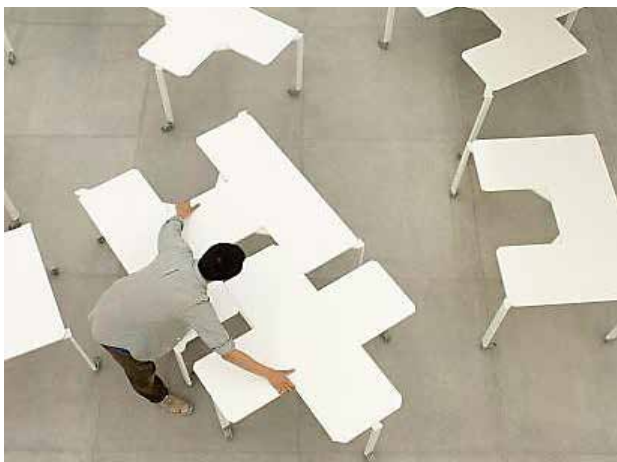
تصویر ۸. میز Tetris توسط اسلایدهای اداری طراحی صنعتی با هم در قالب‌های مختلف قرار می‌گیرد.

کاهش هزینه‌ها، افزایش بهره‌بری، تنظیم براساس اصول ارگونومیکی انسان، کاهش زمان تولید محصول، افزایش فروش محصول و... (تصویر ۷ و ۸).