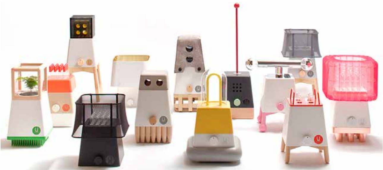
تصویر ۵. این اشیای زرق و برق دار چراغ‌های مدولار هستند که شامل یک واحد پایه مشترک و پیوسته‌های مختلف برای سفارشی کردن لامپ است.

امکان پیش‌ساخته‌سازی را برای اجرا ممکن می‌سازد و باعث ایجاد بنایی با کیفیت از لحاظ مصالح کاربردی می‌شود که به شیوه کارخانه‌ای به دست می‌آید. این روش از دوباره‌کاری‌ها که خود هزینه‌های مضاعف دارند، جلوگیری می‌کند و حتی انعطاف‌پذیری در مسکن را نیز به راحتی فراهم می‌کند (اسدی و بیگزاده، ۱۳۹۴).