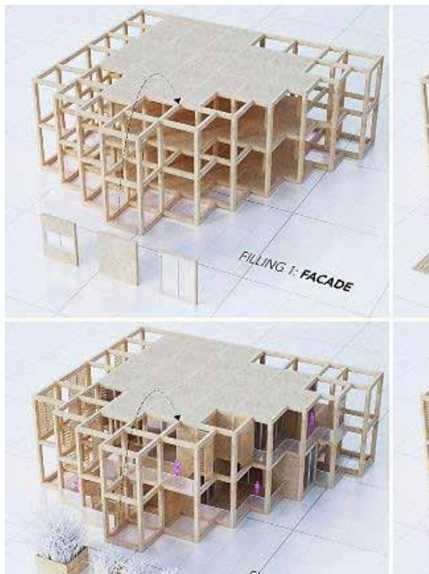
تصویر ۶. «روستای» چوبی مدولار برای نمایشگاه باغبانی پکن که توسط Penda طراحی شده و به عنوان راهبردی برای نوسازی بافت فرسوده روستایی شناخته می‌شود. مأخذ: اشرف گنجوی و دهقانی، ۱۳۹۵.