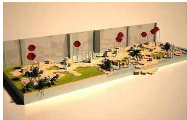
تصویر ۲. پروژهٔ Zigzaghi در شهر Favara ایتالیا که از سطح افقی (سطح زمین و صندلی) و سطح عمودی (سیستم‌های روشنایی و صوتی) ساخته شده است.

موتورهای جستجوگر، شبکه‌های اجتماعی، گروه‌های تخصصی، محافل علمی و مشاهدات میدانی به صورت روزانه استفاده کرد. گام سوم، مصاحبه با خبرگان و متخصصین امر است و هدف از انجام آن، ارزیابی و تکمیل یافته‌های حاصل از مرور منابع و پویای محیطی است. این خبره‌ها کسانی هستند که شناخت درستی از مباحث طراحی، ساخت، تولید و پیامدهای استفاده از رویکردهای طراحی نظیر پیش‌ساختگی و مدولاریته دارند. از این رو به دلیل پیگیری مداوم این موضوع، آنها قادر هستند تا نظرات کارشناسانه‌تری ارائه کنند. گام چهارم، برگزاری جلسات ذهن‌انگیزی است. در بسیاری از پژوهش‌ها، گام چهارم و پنجم هم‌زمان با هم شروع می‌شوند. یعنی جلسات ذهن‌انگیزی با ترسیم و تکمیل اطلاعات مستخرج از پانل‌ها همراه می‌شود. در جلسات ذهن‌انگیزی، افراد فارغ از جایگاه خود در یک محیط