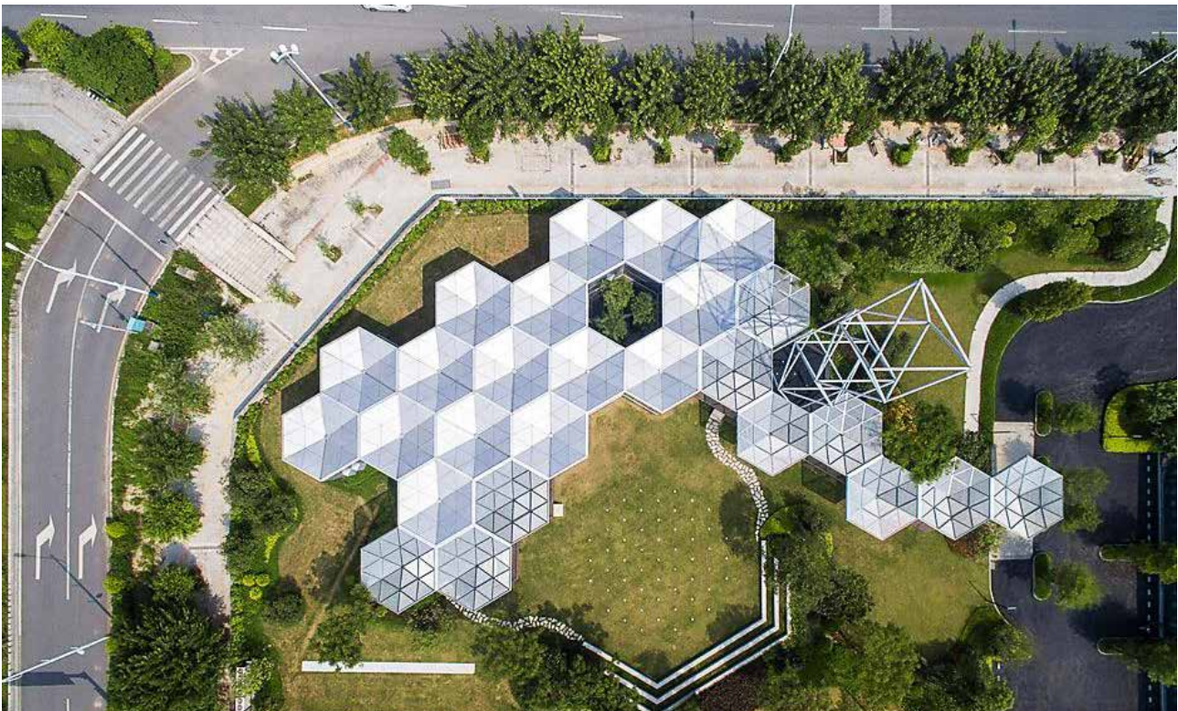
تصویر ۱۰. معماری باز و توسعه سیستم ساخت و ساز مجدد با تسلایت شش گوشه‌ای توسط راهبرد مدولاریته در گوانگجو چین.

و نوآوری را در مصرف‌کننده به وجود آورد و او می‌تواند هربار بسته به نیاز خود یا شرایط محیطی با واحدهای بنیادینی که در اختیار دارد و با استفاده از اصول مدولاریته، دست به آفرینش‌گری هنری و اقتصادی و صنعتی بزند. لذا طی بررسی‌های صورت گرفته، مدولاریته یکی از اصول راهبردی در طراحی محصولات آینده است.