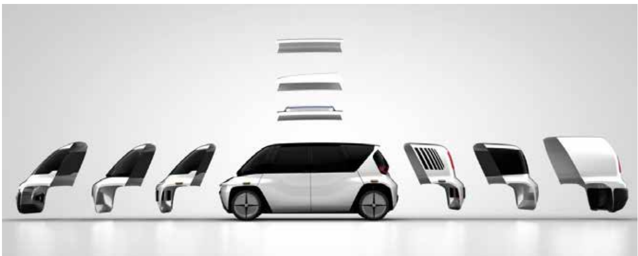
تصویر ۹. استارت‌آپ Open Motors در چین که بر طراحی وسایل نقلیه مدولار و تعمیر و نگهداری شرکت‌های دیگر تمرکز کرده است. مأخذ: پیربابایی و امرایی، ۱۳۸۸.

محصولات مدولار را به طور کلی می‌توان در دو نوع دسته‌بندی کرد. نوع اول، طرح خوشه‌ای است که شامل انتخاب‌های میسر برای ترکیب و طرح در زمان خرید است. در این نوع، کاربر در هنگام خرید محصول، اجزای آن را انتخاب می‌کند و محصول موردنظر خود را به دست می‌آورد. این حالت که مشتری از میان عناصر از پیش تعیین‌شده، ترکیب مورد علاقه خود را برمی‌گزیند، مشتری‌مداری اشتراکی ۲۷ نام دارد. نوع دوم شامل امکاناتی است که پس از خرید در اختیار کاربر قرار داده می‌شوند و کاربر می‌تواند از طریق ترکیب مدول‌های استاندارد، ترکیب‌های مورد علاقه خود را از لحاظ فرمی و در مواردی از لحاظ عملکردی، ایجاد کند (تصویر ۱۰). این حالت که در آن محصول پس از خرید نیز قابل تغییر است، مشتری‌سازی پذیرشی ۲۸ نام دارد و بیشترین خلاقیت در این بخش به چشم می‌خورد (پیربابایی و امرایی، ۱۳۸۸).