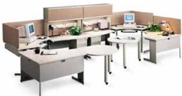
تصویر ۷. معماری داخلی Allied. مدولار: تقسیم‌بندی فضای اداری با قابلیت برپایی و جمع سریع برای انطباق با کارکنان و طراحی داخلی بدون تغییر کل ساختمان.

باید در نظر داشت در طراحی مدولار، مسیر تولید در خطوط تولید یکنواخت است، به طوری که کلیه محصولات از مسیر مشخص و یکنواختی عبور می‌کنند و فرایند تولید همگی، یکسان است. فقط در مونتاژ نهایی مطابق با سلیقه مشتریان، قطعات اضافی جایگذاری می‌شود (خضریان و همکاران، ۱۳۹۵؛ اسدی و بیگزاده، ۱۳۹۴). سازماندهی و مونتاژ نیز براساس قوانین هندسی انجام می‌شود (بیرانوند و همکاران، ۱۳۹۳؛ اسدی و بیگزاده، ۱۳۹۴). توسعه قابلیت تعویض و استانداردسازی قطعات، یک پیشرفت برای طراحی مدولار است (ثبوتی و احمدی، ۱۳۹۴).