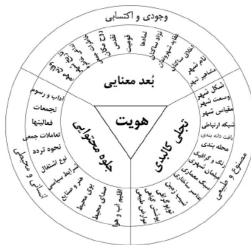
تصویر ۵. ابعاد ماهیتی شهر.

هویت یک مفهوم متصف به انسان است که به لحاظ اِتصاف شهر به انسان و تعاملات او برای شهر نیز استفاده می‌شود. از این رو است که مفهوم هویت در فلسفه اسلامی با غرب تفاوت‌هایی دارد و ریشه آن هم در شناخت شناسی و اعتقاد به ابعاد مختلف وجودی انسان است. لذا مناسب‌ترین واژه برای هویت در مفهوم غربی آن "این همانی" است که فرآیند تطبیق پدیده با تصورات ذهنی ناظر است. مفاهیمی چون روح، ذات، سرشت و طبع برای هویت مفاهیمی شرقی هستند و اغلب در فلسفه اسلامی مترادف با هویت انسانی قرار دارند. هرگاه صحبت از هویت یک شهر به میان می‌آید مفهومی با علل مرکب مورد فهم غالب است و مادام که