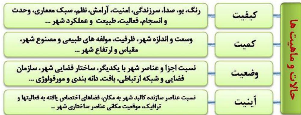
تصویر ۳. ابعاد و مؤلفه‌های شاکله هویت شهر. مأخذ: نگارندگان.