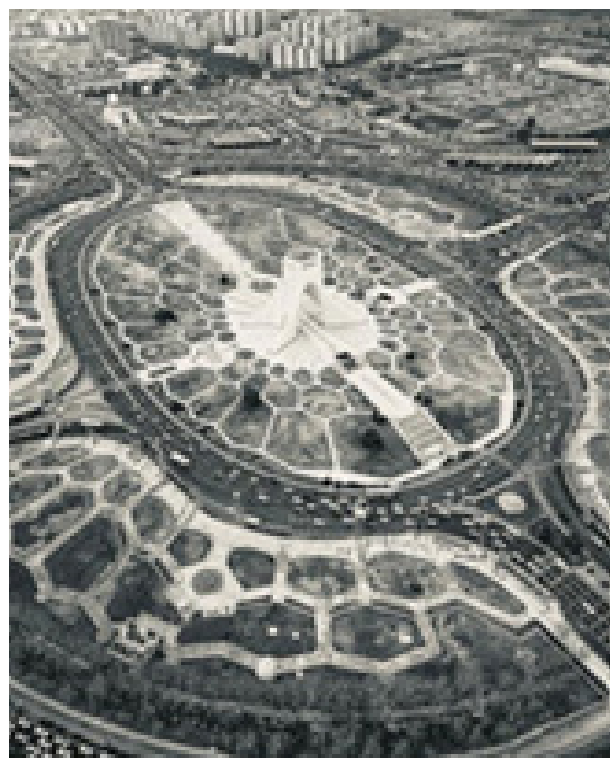
تصویر ۳. بازار وکیل شیراز و میدان نقش جهان الگوهایی در شکل‌گیری مجموعه‌های شهری معاصر مانند میدان آزادی. مأخذ: www.emaratkhorshid.com .