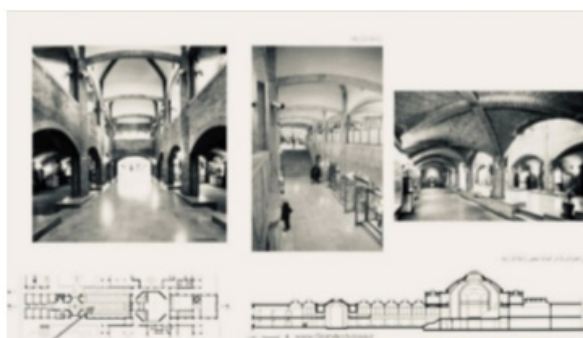
تصویر ۴. عکس از بازار وکیل شیراز و ساختمان میراث فرهنگی.

مخاطب را در آغوش بگیرد. حیاط در بناهای ایرانی رکن اساسی دارد و مثل یک میکروکلایمت عمل می‌کند. طراح وقتی طراحی می‌کند در دنیای خیلی تاریکی است بعد باید چیزی کشف کند. فلسفه طراحی اولیه دانشگاه نیز این بوده که طراح حیاط را یافته که روشنی بوده در تاریکی، حیاط