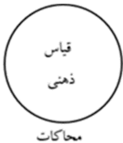
تصویر ۱. ارتباط محاکات با قیاس.