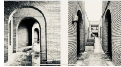
تصویر ۵. دانشکده مدیریت دانشگاه تهران.