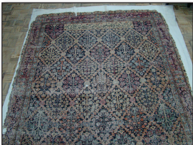
تصویر ۱. متن قالی وقفی.