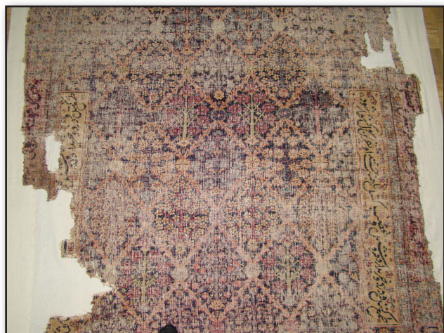
تصویر ۳. متن قالی وقفی.