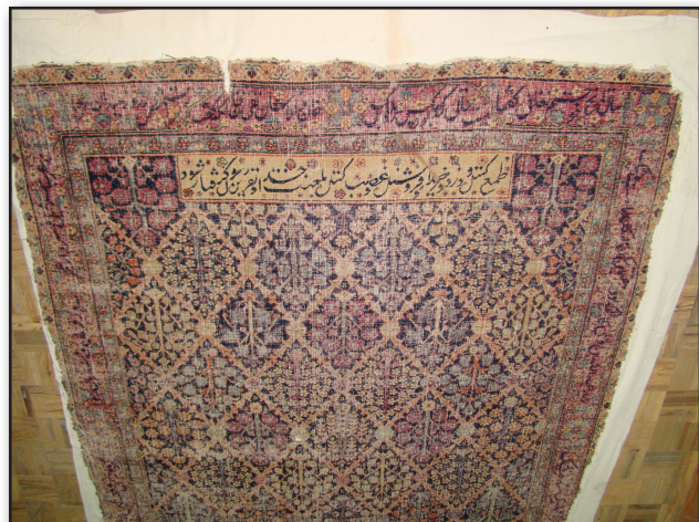
تصویر ۲. متن قالی وقفی.