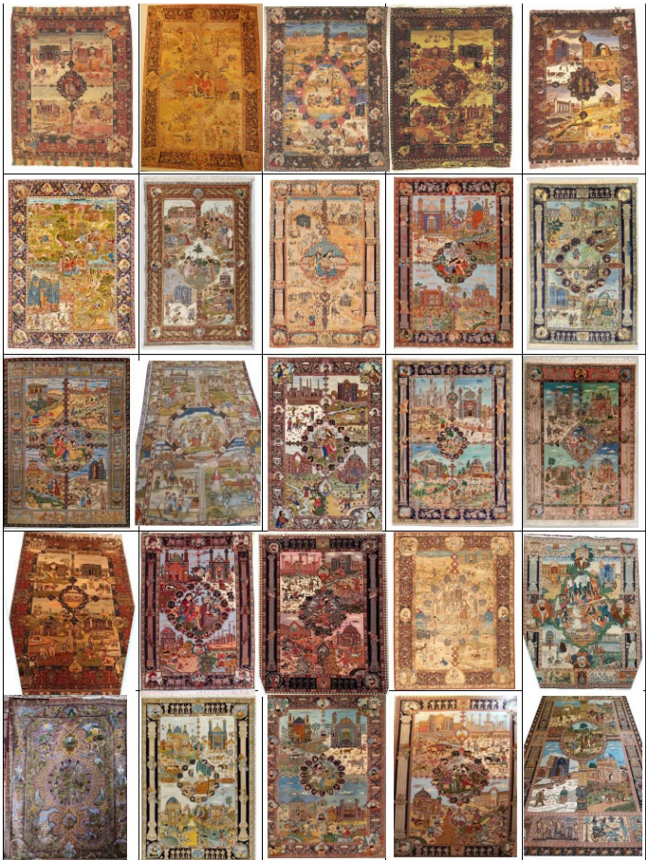
تصویر ۱. تصاویر جامعه آماری پژوهش. (نمونه ۲۶ در تصویر ۳ آمده است).