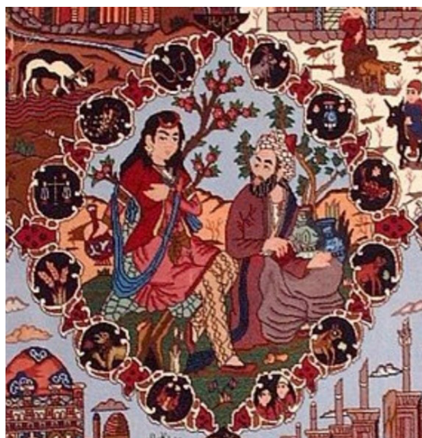
تصویر ۸. منظره‌نگاری در فضای ترنج، بخشی از قالی.

• آبراهامیان، یرواند. (۱۳۸۰). معرفی یک سند: تجارت در قدیم الایام