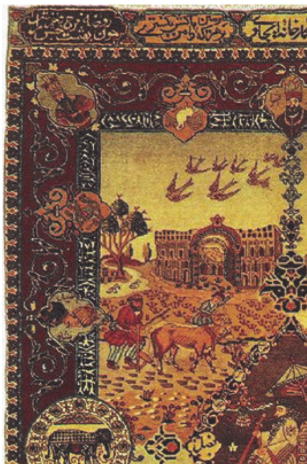
تصویر ۶. بنای طاق کسری در پس‌زمینه فصل پاییز و صحنه شخم‌زدن، بخشی از قالی.

جنبش‌های اجتماعی و اندیشه‌های تجددخواه اوایل قرن بیستم در مواجهه با فرهنگ غالب و صنایع مترقی غرب و اشراف به تزلزل در مبانی هویتی جامعه ایران، در پی بازسازی هویت و غرور از دست‌رفته ملت ایران برآمدند. ایشان شعارهای تجددطلبانه خود را حول مفاهیمی چون ملیت، فرهنگ و ایرانیت شکل دادند. در این سال‌ها و در پی کشفیات باستان‌شناسان غربی ابعاد مختلف تمدن‌های عظیم ایران قبل از اسلام آشکار و باعث تحسین دنیای متمدن غرب شد. انتشار نتایج پژوهش‌های تاریخی و برپایی نمایشگاه‌های مختلف از آثار مکشوفه، احساس غرور توأم با افسوس نخبگان سیاسی و فرهنگی-اجتماعی ایران را برانگیخت. این افراد هرکدام سعی کردند در آثار و نوشته‌های خود نشانه‌های عظمت و شکوه تاریخی ایران را بازتاب دهند. انتشار روزنامه‌هایی با عناوین و محتوای