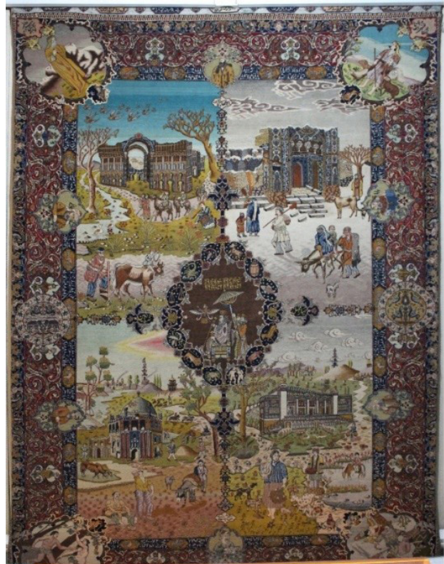
تصویر ۳. قالی چهار فصل، محفوظ در موزه فرش ایران، طرح میر مصور، مأخذ: آرشیونگارندگان.

مسجد کبود تبریز با ۱۵ بار تکرار در زمینه فصل زمستان، بیش از هر بنای تاریخی دیگری در فضا سازی مربوط به فصل زمستان به کار گرفته شده است. زمستان های سخت تبریز نسبت به شهرهای دیگر دارای بناهای تاریخی، شاید یکی از دلایل استفاده از این بنا در پس زمینه صحنه های مربوط به فصل زمستان در قالی های چهار فصل است. ابنیه ناشناخته، شش مورد، بنای تخت جمشید سه مورد و مدرسه چهارباغ اصفهان و مسجد شاه اصفهان هر کدام با یک مورد دیگر بناهای مصور در زمینه مربوط به فصل زمستان قالی های چهار فصل هستند (جدول ۴).