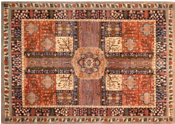
تصویر ۲. قالی چهارباغ، عصر صفوی، موزه ویکتوریا آلبرت لندن.

را به کناری نهاده و صرفاً از قابلیت روایتگری و باز نمود تصویری یک مفهوم عامیانه و مردمی در طراحی قالی‌ها استفاده کردند. خالقان طرح این قالی‌ها، ساختار فرهنگی و تاریخی موجود در قالی‌های چهارباغی صفوی را بستری مناسب برای پیاده‌سازی ایده‌های خلاقانه خود یافتند. این طرح‌های تصویری و ابداعی جدید «چهارفصل» نامیده شدند که تولید آنها از دوره قاجار شروع و کم‌وبیش تا به امروز ادامه یافته است. در این طرح، هریک از فضاهای چهارگانه اقتباس شده از طرح چهارباغی به مصور کردن صحنه‌ای عامیانه و عمدتاً روستایی اختصاص دارد که در پس‌زمینه آن یکی از بناهای تاریخی نام‌آشنای ایران مصور شده است. پژوهش‌های میدانی نشان می‌دهد، حسین میرمصور ارزشمندی (۱۸۸۱-۱۹۶۳ م.) از دانش‌آموختگان هنرستان میرک و نقاش نوآور تبریزی در اواخر قاجار نخستین طرح قالی چهارفصل را ابداع کرد. نخستین طرح‌ها در کارگاه قالیبافی «ایجاد» بافته شد (تصویر ۳). میرمصور علاوه بر نقاشی از موضوعات و روایت‌های حماسی و ملی ایران، به عنوان فردی صاحب‌سبک و جریان‌ساز در طراحی قالی تبریز نیز شناخته می‌شود. به طوری که عمده شهرت قالی تبریز در زمینه طرح‌های نوآورانه و تصویری در اوایل قرن بیستم، نتیجه ابداعات و خلاقیت‌های میرمصور در ارائه گونه‌های بدیع از قالی‌های تصویری بوده است (قره باغی، ۱۳۹۹).