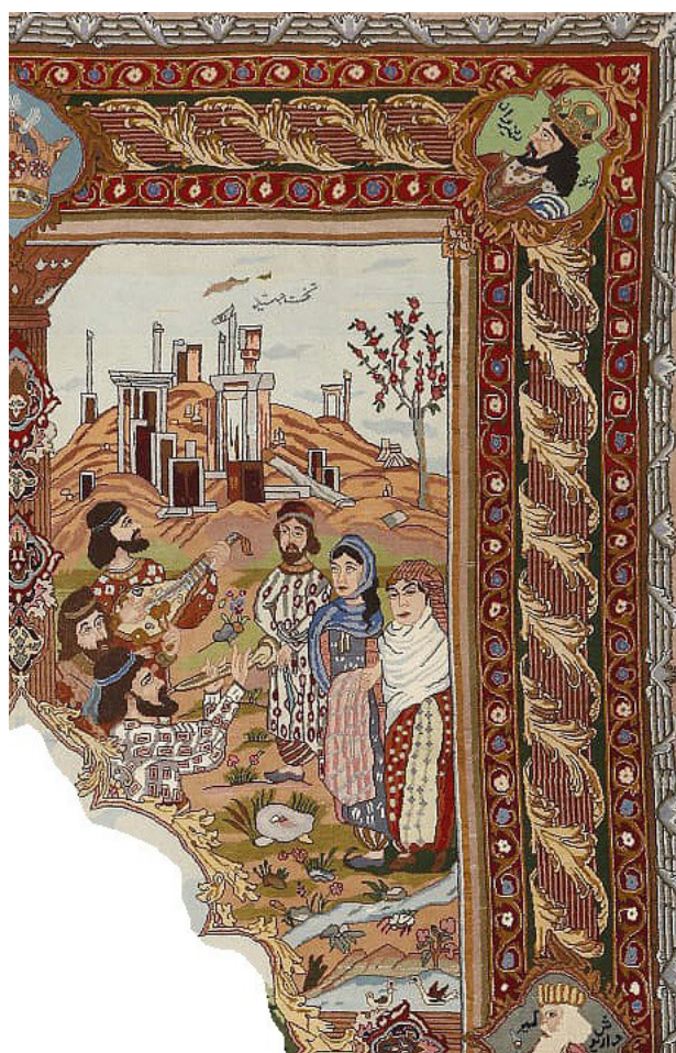
تصویر ۴. بنای تخت جمشید در پس‌زمینه فصل بهار و بزم روستاییان، بخشی از قالی.

مطالعات اجتماعی هنر نشان می‌دهد، در نقطه مقابل هنرهای زیبا که اغلب نمایشگر نظم اجتماعی طبقه حاکم هستند و از سوی نهادهای فرهنگی و هنری حمایت شده و به رسمیت شناخته می‌شوند، هنرهای عامه و مردمی قرار دارند که به علت پیوندهای درهم‌تنیده با توده‌های اجتماعی و جوامع بومی، آرمان‌ها، نیات درونی و فرهنگ گذشته و حال تولیدکنندگان را به نمایش می‌گذارند. در این بین قالی‌های تصویری به‌عنوان نمونه کاملی از هنرعامه، بازتاب‌دهنده نیات و ایدئولوژی‌های طبقات میانی و متوسط جامعه هستند. «قالی‌ها بیش از آنچه انعکاس‌چیزی در جامعه باشند، متن‌هایی هستند که سنت‌ها را با پویایی و سیالیت خود بازنمایی می‌کنند ... و اسناد دست‌اولی هستند که مانند ادبیات، پویایی، تحرک و تداوم تاریخی خود را دارند» (Spooner, 2011, 231). قالی‌ها همچنین ظرفیت آن را دارند که به‌عنوان یک رسانه مردمی و فراگیر خواست‌ها و