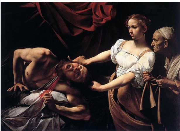
تصویر ۴. جودیت سر هولوفرنس را می‌برد، اثر کاراوادجو، ۱۵۹۹ م. مأخذ: Guttuso, 2005, 105.

آنچه در آثار کاراوادجو قابل تأمل است استفاده از تکنیک کیاروسکورو که خروج نور از دل تاریکی و همچنین شیوه تنبیرسم یا تاریک‌نگاری است به گونه‌ای که در آثار او کاربست تبیان تیره و روشن بسیار بارز است. نقاشی‌هایی که به گونه‌ای صحنه‌ای تئاترگونه‌اند. نمایشی که بار دراماتیک بسیار و بیان تراژدی‌وار دارد چراکه آثار او بیشتر القاکننده حس‌های انسانی از جمله شفقت و ترس هستند که در انسان موجب کاتارسیس می‌شود. دورانی که کاراوادجو نقاشی می‌کرد مردم عادی برای آموزش زیبایی و تاریخ هنر به کلیسا نمی‌رفتند، دنبال تماس با خداوند بودند و کاراوادجو این مسئله را به زبانی که آنها می‌توانستند درکش کنند برای آنها فراهم کرد. نقاشی‌های کاراوادجو به اندازه خالقشان تحریک‌آمیز بودند.