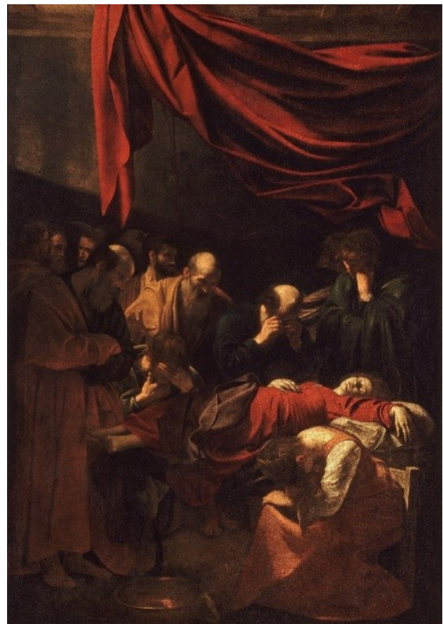
تصویر ۲. مرگ باکره، اثر کاراوادجو، ۱۶۰۶ م.، موزه لوور پاریس. مأخذ: Guttuso, 2005, 135.