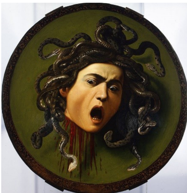
تصویر ۱. نقاشی مدوسا، کاراوادجو، ۱۵۹۷، گالری یوفیزی.

کاراوادجو ۸ ، نقاش ایتالیایی (۱۵۷۱-۱۶۱۰ م.) هنرمندی نوآور، که با سمت‌گیری واقع‌گرایانه بر بسیاری از هنرمندان باروک ۹ اثر گذاشت، نام خود را از نام شهر زادگاهش در نزدیکی میلان برگرفت. در میلان زیر نظر یک نقاش پیرو منریسم ۱۰ آموزش دید. به رم رفت (۱۵۹۳ م.) و مدتی برای نقاشان دیگر کار کرد. در این زمان دچار فقر بود و نامش