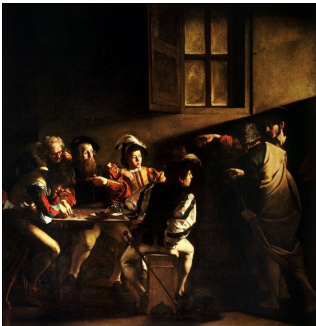
تصویر ۵. ندای مقدس متیو اثر کاراوداجو، ۱۶۰۰ م. محل نگهداری: موزه سن لوئیچی فرانسه. مأخذ: Guttuso, 2005, 109.

موضوع این تابلو مربوط به داستانی از انجیل است که در آن دو تن از حواریون بعد از ماجرای تصلیب مسیح، شام خود را با غریبه‌ای شریک می‌شوند و در جریان شام متوجه می‌شوند که فرد غریبه درواقع عیسی است که دوباره زنده شده است. این باعث ترس و تعجب دو حواری شده است در حالی که صاحب کافه در پشت سر آنها با حالتی عادی به این ماجرا نگاه می‌کند. در واقع