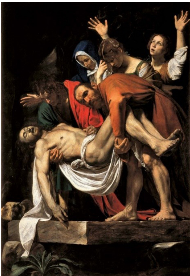
تصویر ۳. خاکسپاری مسیح، اثر کاراوادجو، ۱۶۰۴ م.، محل نگهداری: گالری عکس واتیکان، شهر واتیکان.

کاراوادجو کتاب مقدس را بدون شک به کرات خوانده و بر کلمات آن غور کرده است. او یکی از بزرگترین هنرمندانی بود که مانند پیشینیان خود، «جوتو» ۱۱ و «دورر» ۱۲ می‌خواست رخدادهای مقدس را، چنانکه گویی در خانه همسایه‌اش رخ می‌دهند در برابر چشم خویش مجسم کند و برای هرچه واقعی‌تر و ملموس‌تر نمایاندن شخصیت‌های متون کهن، از هیچ کوشش ممکن‌تری دریغ نمی‌ورزید، حتی از نور و سایه به نحوی استفاده می‌کرد که به تحقق این هدفش کمک کند. نور او، بدن انسان را جذاب و دلپسند نشان نمی‌دهد: نوری است تند و در تضاد سایه‌های غلیظ،