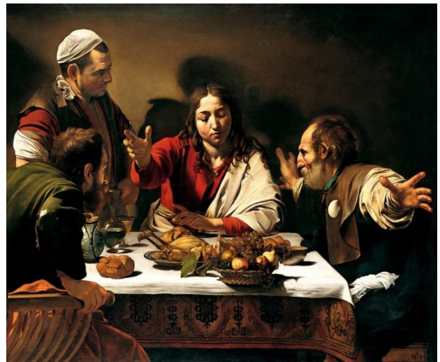
تصویر ۶. تابلوی شام در عمواس، اثر کاراواجو، ۱۶۰۱ م. محل نگهداری: نشنال گالری لندن.

کاراواجو همانند عکاسی عمل کرده است که دقیقاً آن لحظهٔ شوک دو حواری را برای ما ثبت کرده و به زمان ما فرستاده است.