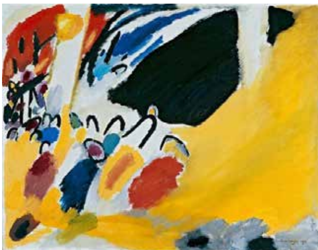
تصویر ۶. کنسرت ۱۹۱۱ م. موزه لن‌باخ هاوس در مونیخ، اثر واسیلی کاندینسکی.

نمایش بگذارند. ولی در هنر اسلامی اینگونه نیست. ساختار مشخص و از پیش تبیین یافته‌ای وجود دارد، بسان قوانین مقدس، حدود و شرعیات دینی که هنرمند وفادارانه ملزم به رعایت و مراقبت آن است و هرگونه عدول از آن ناپذیرفتنی است. همین امر منجر به وجود اشتراک در آثار هنرهای اسلامی می‌شود. نقوش هندسی هنرهای سنتی تذهیب یا نقش قالی یا نقوش کاشی‌های مساجد، همه و همه از قانون تکرار الگویی مشخص پیروی می‌کنند که در قالب چهار ضلعی، پنج ضلعی و یا شش ضلعی تشکیل شده‌اند و نقوش غیرتقلیدی قابل گسترش محسوب می‌شوند. بنابراین هنرمند اسلامی در برابر ناخودآگاه خود ممتنع نیست ولی نقاش مدرن غربی به لحاظ وجوه روانی میدان عمل را به دست ناخودآگاه مهارنشده‌ی خود سپرده است. همین امر موجب می‌شود که هنرمند از پیش دقیقاً نداند که قرار است حاصل آفرینشش چه باشد؛ در جریان کار، رفته رفته اثر خود را تکمیل می‌کند. و ناخودآگاه در بی‌خودی هنرمند او را با خود می‌برد تا فرایند اثر هنری کامل شود. این امر در سایر آثار هنری نیز وجود دارد اما در هنر انتزاعی به مراتب بیشتر است. حتی در یک رمان، کلیت و پلاتی وجود دارد ولی در جریان نوشتن، شخصیت‌ها خود را پرورش می‌دهند و رفته رفته تکمیل می‌شوند. اما مثلاً یک استادکار سنتی و نگارگر از پیش دقیقاً می‌داند که قرار است براساس چه متنی، نگاره‌ای را بسازد و با چه فرایندی روبرو خواهد شد. این تفاوتی است که زیبایی‌شناسان در قرن هجدهم، بین هنر و صنعت قائل شده‌اند. و «پیر سوانه» در فصل اول کتاب خود، «مبانی زیبایی‌شناسی» به تفصیل به آن می‌پردازد: «صنعت‌گر از پیش دقیقاً می‌داند قرار است با چه روبرو