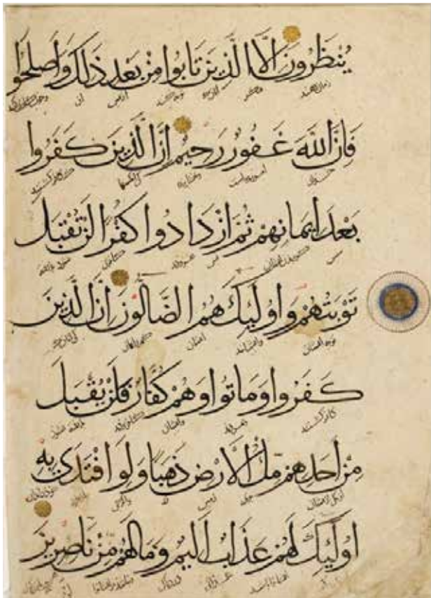
تصویر ۴. خط محقق، خوشنویسی قرآن مجید، نمونه ای از هنر انتزاعی اسلامی.

از طرفی، این که هیچ چیز، حتی به شیوه نسبی و گذران نباید میان انسان و حضور نامرئی خداوند ایجاد مانع کند» (مطهری الهامی، ۱۳۸۴، ۱۴۷).