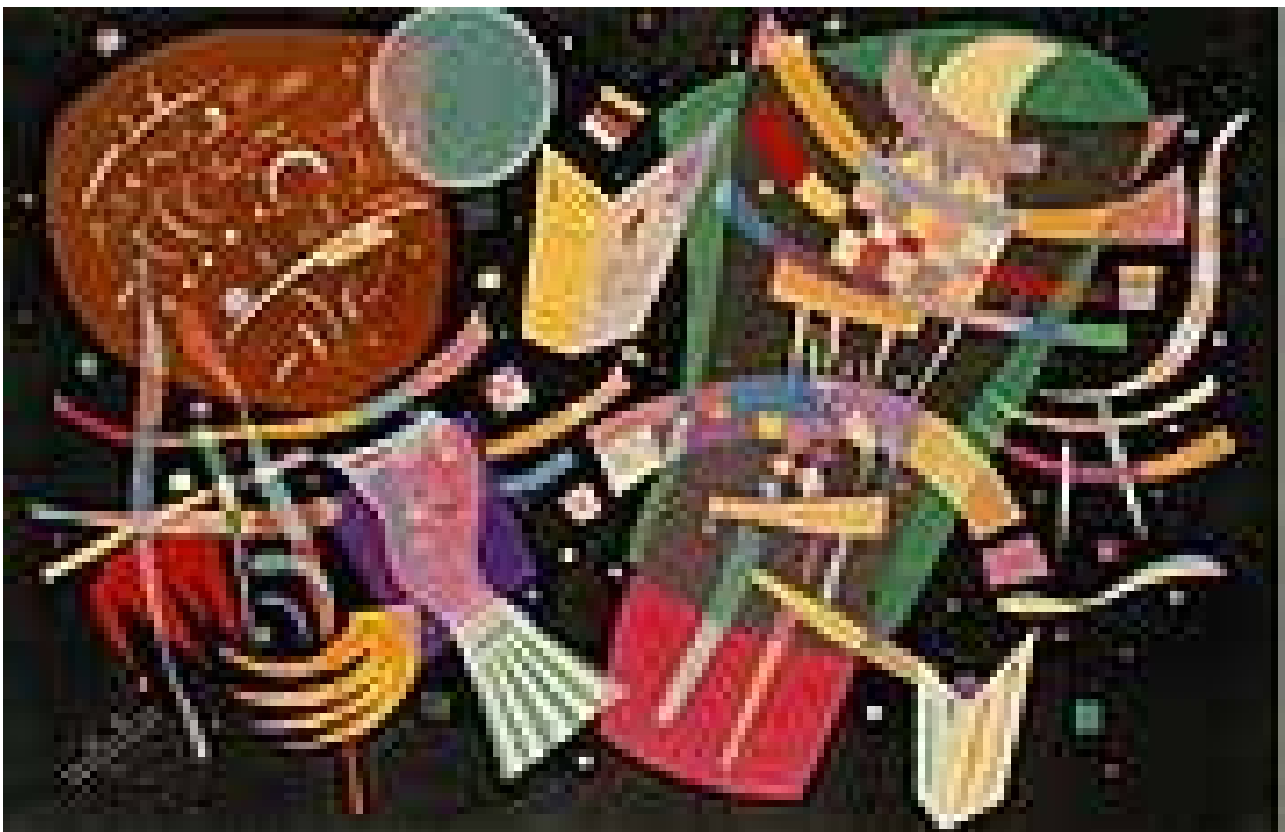
تصویر ۷. ترکیب‌بندی ۱۰، اثر واسیلی کاندینسکی.

درک و دریافت مخاطب از این آثار نیز مورد دیگری از این مطالعه است. از آنجا که این آثار از چیزی در طبیعت تقلید نمی‌کنند، دریافت مشخص و ثابتی نمی‌توان از آن داشت. یعنی می‌توانیم ادعا کنیم که نقاشی شام آخر تمام جهانیان