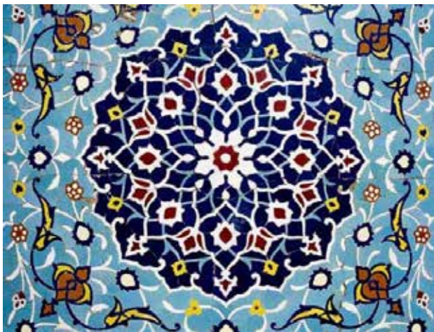
تصویر ۱. شمسه و نقوش اسلیمی، نمونه‌ای از هنر انتزاعی اسلامی، مسجد امام اصفهان.

«احدیت در عین حال که به غایت «عینی و انضمامی» است، به نظر انسان، تصویری انتزاعی می‌نماید. و این امر، به علاوه بعضی عوامل مربوط به ذهنیت سامی، مبین خصلت انتزاعی هنر اسلامی است. محور مرکزی اسلام، احدیت و وحدانیت است، ولی هیچ تصویری قادر به بیان آن نیست. مع هذا تصویرسازی در اسلام به طور مطلق منع نشده است. تصویر مستوی به عنوان هنری غیردینی به دیده اغماض نگریسته می‌شود، به شرط آنکه نه نقش خداوند باشد و نه سیمای پیامبر؛ ولی برعکس «تصویری که سایه بیفکند»،