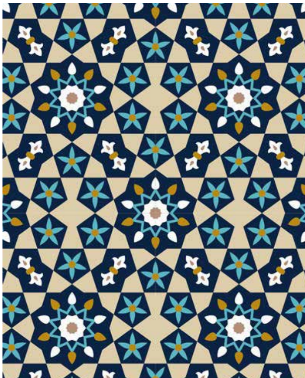
تصویر ۳. نقوش هندسی اسلامی، نمونه‌ای از هنر انتزاعی اسلامی.

استثنائاً، یعنی اگر نمایشگر حیوانی است که نقش‌پردازی شده، به تسامح پذیرفته و احتمال می‌شود، و چنین امری ممکن است در معماری قصور یا در طلاکاری [تذهیب] صورت پذیرد. به طور کلی، تصویر گیاهان و جانوران موهوم به صراحت مورد قبول قرار گرفته، اما فقط تزئینات نباتی با اشکال نقش‌پردازی شده جزء هنر مقدس محسوب شده است» (همان، ۱۳۱)؛ (تصویر ۲).