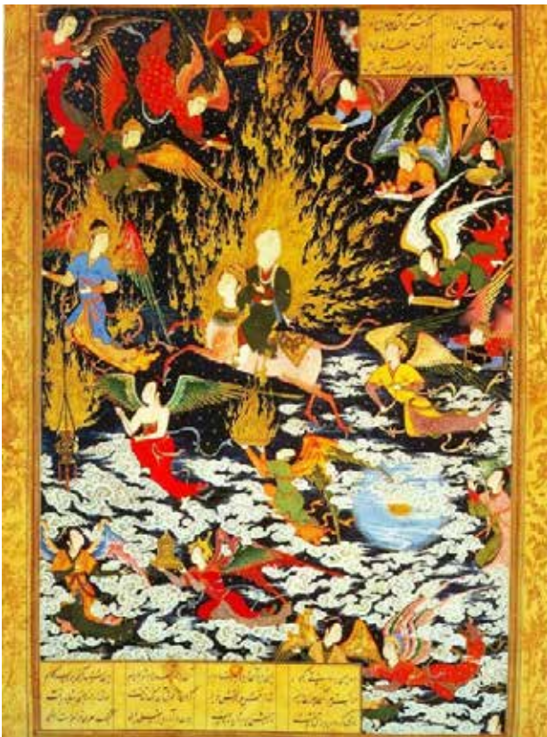
تصویر ۲. نگاره معراج حضرت محمد (ص)، اثر سلطان محمد تبریزی، نمونه‌ای از هنر انتزاعی اسلامی.