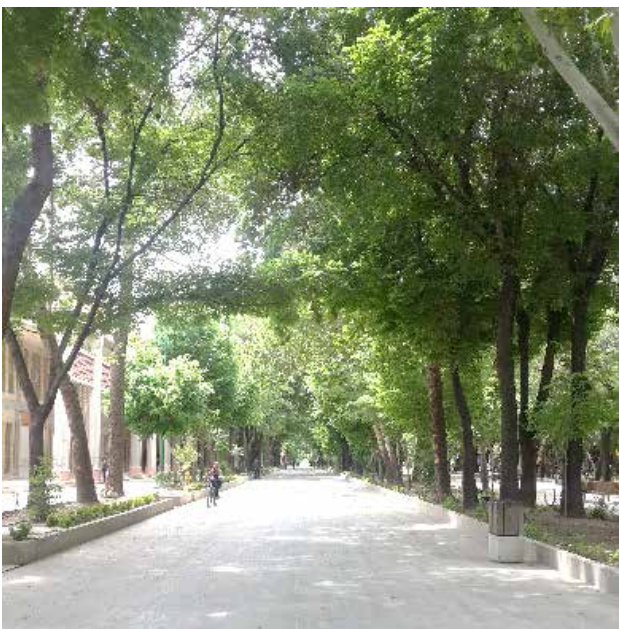
تصویر ۵. نمایی از پیاده‌راه چهارباغ در زمان عدم حضور خرده‌فروشی‌های موقت. عکس: مینا کشانی همدانی، ۱۳۹۸.