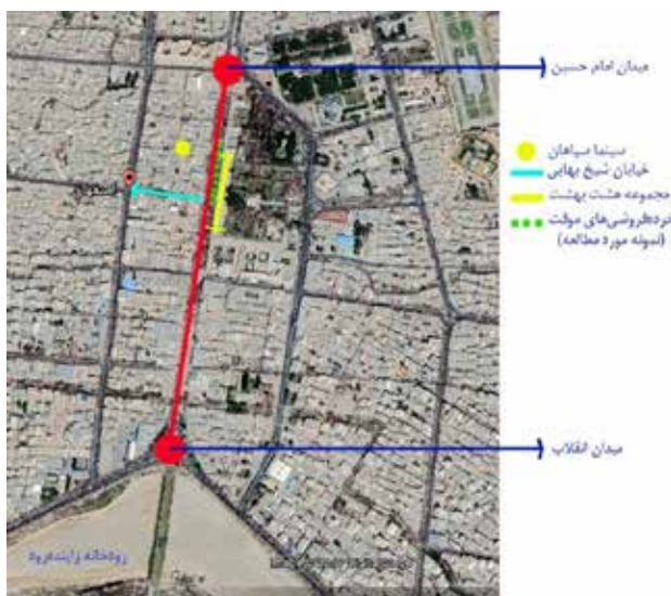
تصویر ۲. موقعیت خیابان چهارباغ بازارچه مورد مطالعه.

در حال حاضر این خیابان به‌عنوان یک پیاده‌راه دائم در قلب شهر اصفهان، فضای متفاوتی را به نمایش گذاشته است. همچنین به‌واسطه سایر تغییرات کالبدی، کیفیت محیطی این خیابان دچار دگرگونی‌هایی شده و با توجه به قطع عبور و مرور سواره، حضور اجتماعی افراد در آن، شکل متفاوتی به خود گرفته است که به‌ویژه سرزندگی و پویایی آن دستخوش تغییراتی شده است. در این میان و به‌منظور افزایش سرزندگی و رونق خیابان مذکور، مدیریت شهری تصمیم به انجام اقداماتی مبنی بر اصلاح شرایط موجود گرفت که از آن جمله می‌توان به برگزاری رویدادهای مناسبی و مقطعی و اجازه ورود و برپایی بازارچه‌های موقت