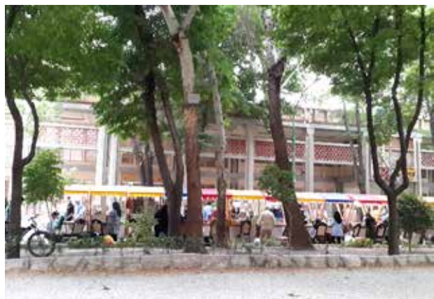
تصویر ۳. نمای پشتی غرفه‌های خرده‌فروشی موقت در چهارباغ، جبهه ساختمان‌هایی که در تصویر مشاهده می‌شود مربوط به مجموعه هشت بهشت است که در حال حاضر غیرفعال هستند. عکس: مینا کشانی همدانی، ۱۳۹۸.

خرده‌فروشی در میانه چهارباغ، اشاره کرد (تصاویر ۳، ۴ و ۵). این بازارچه شامل ۹۰ غرفه صنایع دستی و سایر محصولات روزمره و سه ون-کافه ۵ است.