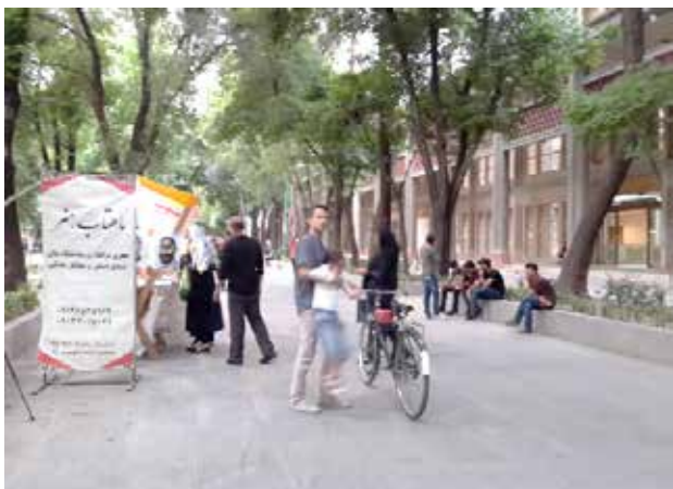
تصویر ۴. نمایی از پیاده‌راه چهارباغ در زمان حضور خرده‌فروشی‌های موقت. عکس: مینا کشانی همدانی، ۱۳۹۸.