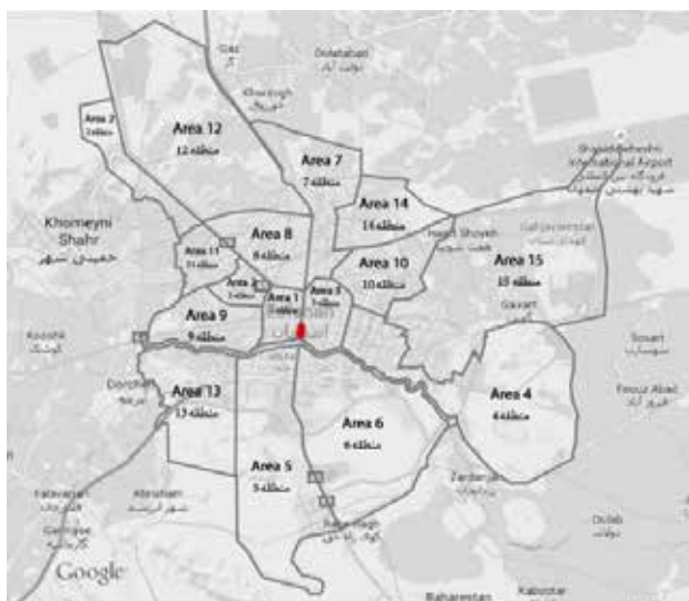
تصویر ۱. موقعیت خیابان چهارباغ در شهر اصفهان.