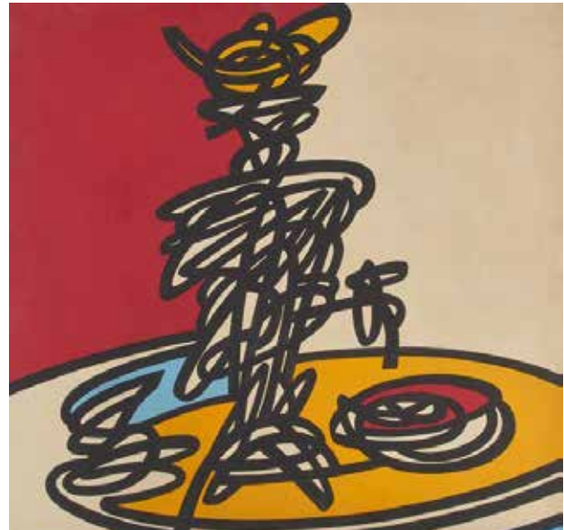
تصویر ۷. سماور، اثر کوروش شیشه‌گران، اکریلیک روی بوم، ۱۹۸۶ میلادی. ابعاد: ۱۳۳*۱۳۳ سانتیمتر.