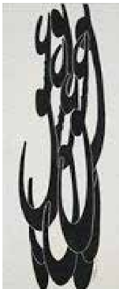
تصویر ۶. عشق، نصرالله افجه‌ای، رنگ‌وروغن روی بوم، ۱۹۸۴ میلادی. ابعاد: ۱۵۰*۵۰ سانتیمتر.