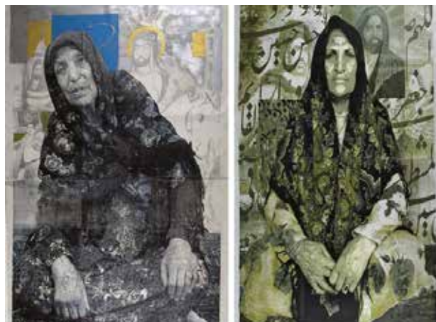
تصویر ۱۴. مادروخواهر (از مجموعه تروریست)، اثر خسرو حسن‌زاده، سیلک‌اسکرین با اکریلیک روی بوم، ۲۰۰۴ میلادی. ابعاد تصویر راست: ۳۰۸*۲۰۴. ابعاد تصویر چپ: ۳۰۰*۲۱۷ سانتیمتر.

جالب توجه باشد، اما امید به تأثیر اجتماعی گسترده‌تر از جمله تقابل یا به‌چالش‌گرفتن نگاه بیننده‌ای که با ذهن آکنده از پیش‌فرض‌ها با مردم شرق روبرو می‌شود، در توان چنین رویکردی به هنر نیست. در نهایت، ضعف نقادانه در روندی معکوس موجب می‌شود محتوای موردنقد در قالب‌هایی جدیدتر و خوش‌نماتر تولید شود. شادی قدیریان با عکاسی در فضای خانگی یا استودیو، در رویکردی به‌مراتب ضعیف‌تر که بر فرمولی ابتدایی از هم‌نشینی تقابل‌برانگیز زن و اشیاء نمادین بنا شده است، تلاش دارد محدودیت‌های اجتماعی زن ایرانی و تنش‌های حاصل از رویارویی سنت و مدرنیته را برجسته سازد (تصویر ۱۹).