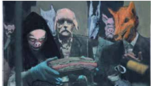
تصویر ۲۱. منشور کوروش به خانه بازمی‌گردد (شهر قصه)، اثر رکنی حائری‌زاده، جسو، آبرنگ و جوهر روی چاپ کاغذی، ۲۰۱۱ میلادی. ابعاد: ۳۰*۳۰ سانتیمتر.