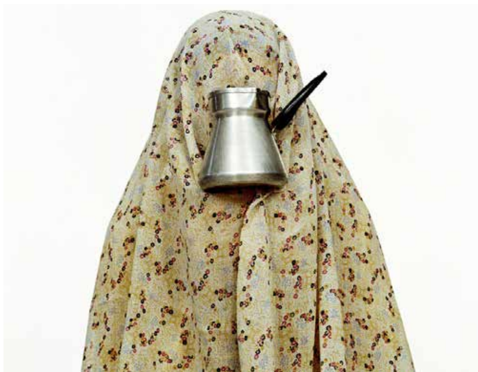
تصویر ۱۹. #۱ (از مجموعه مثل هرروز)، اثر شادی قدیریان، C-print، 2000 میلادی. ابعاد: ۵۰*۵۰ سانتیمتر.