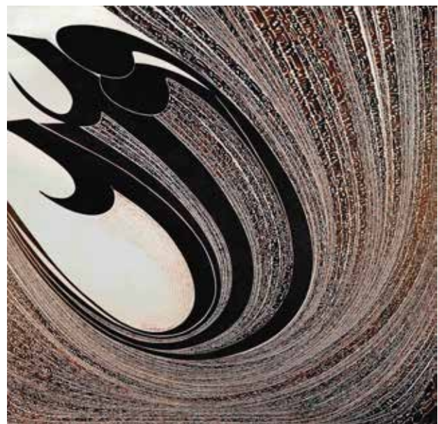
تصویر ۵. عشق، اثر نصرالله افجه‌ای، اکریلیک روی بوم، ۲۰۱۰ میلادی. ابعاد: ۲۰۰*۲۰۰ سانتیمتر.

دورگه‌گی همی بابا تصور می‌شود که به عقیده فیشر «در سال‌های اخیر، محبوب‌ترین الگوی بیان میان فرهنگی [در عرصه تولیدات هنری] بوده است» (Fisher, 2005: 237). دورگه‌گی به معنای آمیزش [انقلابی] قومیت‌ها و فرهنگ‌ها، به گونه‌ای است که شکل‌های فرهنگی تازه‌ای تولید شود [...] به عقیده بابا، دورگه‌گی سلاح توانمندکننده و قدرت‌بخشی برای به‌حاشیه‌رفتگان فرهنگی است؛ زیرا هم خلوص نژادی و فرهنگی و هم تفاوت فرهنگی [ویژه و سفارشی] که دربردارندهٔ میل به اگزوتیسم است را پشت سر می‌گذارد. [...] دورگه‌گی، هویت‌های تکثرگرایی در فضای میان فرهنگی (فضای سوم) می‌سازد که ابزار مقاومت در برابر هویت‌های یکدست و واحد است (Nayar, 2015). آنچه بابا به عنوان مقاومتی مؤثر در برابر تعیین هویت