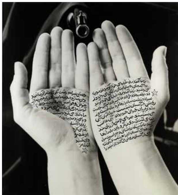
تصویر ۱۶. متولیان انقلاب (از مجموعه زنان الله)، اثر شیرین نشاط، نوشته‌های جوهری بر چاپ نقره ژلاتینی. ابعاد: ۱۱۰*۹۹.۷ سانتیمتر.