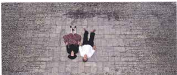
تصویر ۱۷. مونس و مرد انقلابی (از مجموعه زنان بدون مردان)، اثر شیرین نشاط، نوشته جوهری روی C-print، 2008 میلادی. ابعاد: ۱۳۸.۴*۲۴۳.۸ سانتیمتر.