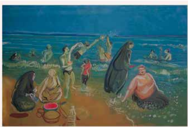
تصویر ۲۰. شمال، اثر رکنی حائری‌زاده، نقاشی روی بوم دولته‌ای، ۲۰۰۸ میلادی. ابعاد هر پانل: ۲۰۰*۳۰۰ سانتیمتر.