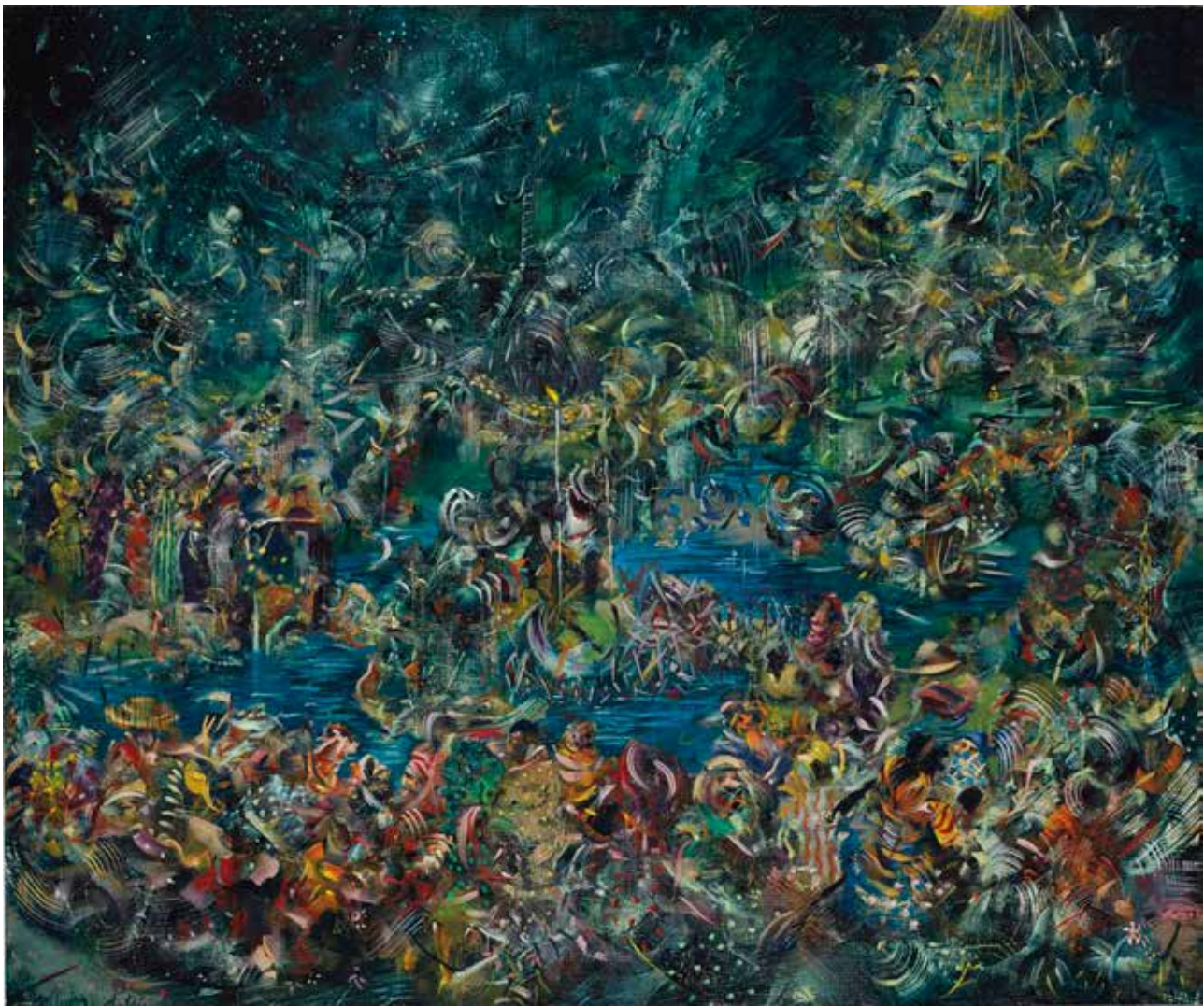
تصویر ۱۱. روشنائی، اثر علی بنی صدر، رنگ‌وروغن روی بوم، ۲۰۱۰ میلادی. ابعاد: ۹۱،۵ * ۷۶،۵ سانتیمتر.

مانند گلدوزی، سنگ‌دوزی یا پولک‌دوزی (تصویر ۱۲ و ۱۳). او در تابلوی «عشق» با صدها قطعه درخشان، از جمله کریستال‌های گران‌قیمت کمپانی سواروسکی ۲۳ ، واژه عشق را به خط نستعلیق مصور کرده است. شاید تصور معمول از هنر فاخر نخبگان زیرسؤال رفته باشد؛ یا آن‌طور که برخی منتقدان، کار مشیری را به سبب کاوش طنزآمیز در مرز باریک (و نامحسوس) مصرف‌گرایی ۲۴ و هنر به عنوان ابژه مصرف ستایش می‌کنند (Babaie, 2011: 142) حساسیت او به تناقضات دنیای هنر قابل توجه باشد، اما زمانی که این تابلو در حراج بونامز ۲۵ ، ۱ میلیون و ۴۸ هزار دلار چکش می‌خورد و مشیری را به اولین هنرمندی در خاورمیانه بدل می‌سازد که اثری را بیش از ۱ میلیون دلار به فروش رسانده، فقط نوع کالای فروخته‌شده (در رده خود) تغییر یافته است؛ اگر تاکنون خرید و فروش تابلوهای خاصی به