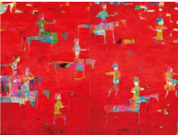
تصویر ۱۰. شکار خونین، اثر رضا درخشانی، رنگ‌وروغن روی بوم دولته‌ای. ۲۰۱۶ میلادی. ابعاد هر پانل: ۱۸۳*۱۲۲ سانتیمتر.