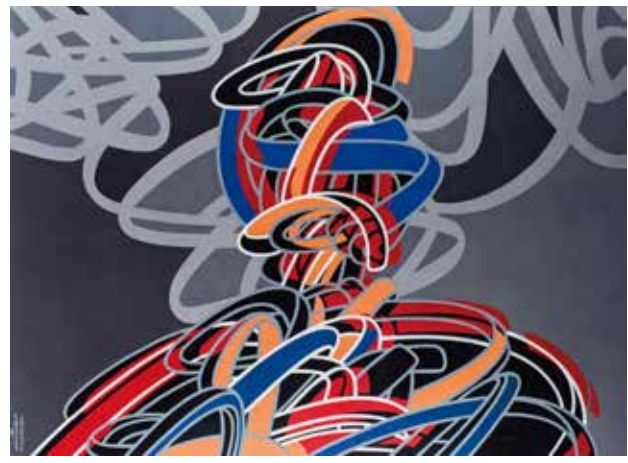
تصویر ۸. فیگور، اثر کوروش شیشه‌گران، اکریلیک روی بوم، ۲۰۱۴ میلادی. ابعاد: ۱۶۰*۲۰۰ سانتیمتر.

کمیک استریپ، آگهی‌های تبلیغاتی، بسته‌بندی و تصاویر تلویزیون و سینما شمایل‌شناسی این هنر را پدید آوردند» (Chilvers & Glaves-Smith, 2009: 1552). ویژگی فرهنگ بصری عوام زرق‌وبرق، ابتذال، پیش‌پاافتادگی یا به اصطلاح کیفیت «کیچ» آن بود که در تقابل با فرهنگ فاخر نخبگان پنداشته می‌شد. پاپ‌آرت به عنوان نمونه‌وارترین شکل پست‌مدرنیستی از بیان هنری (در رویکرد به فرهنگ عامه‌پسند و سلیقه کیچ) قصد داشت جدیت هنر فاخر را به سخره بگیرد؛ هر چند در نهایت به دلیل ضعف شیوه‌های نقادانه، تسلیم سرمایه‌داری متأخر شد و ارزش بازاری