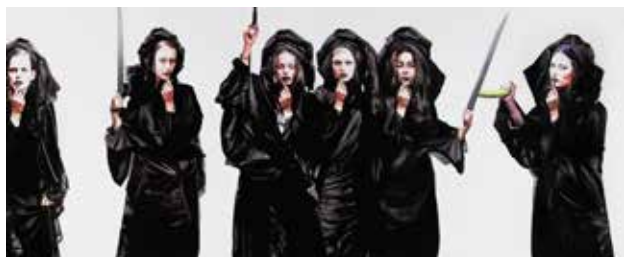
تصویر ۱۸. اغواء، اثر افشین هاشمی، رنگ‌وروغن، ۲۰۱۰ میلادی. ابعاد: ۲۰۰*۲۹۸ سانتیمتر.