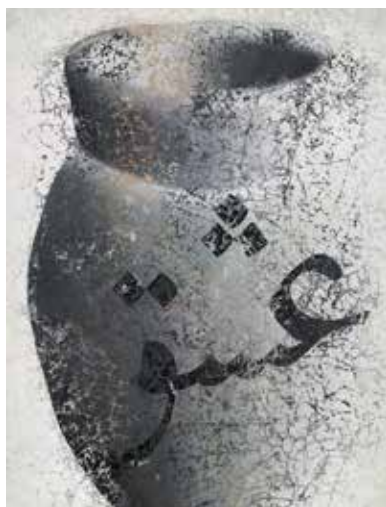
تصویر ۱۳. عشق، اثر فرهاد مشیری، رنگ‌وروغن و اکریلیک روی بوم، ۲۰۰۳ میلادی. ابعاد: ۲۷۱*۱۸۱ سانتیمتر. مأخذ: www.christies.com