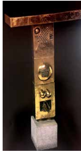
تصویر ۱. شاعر و قفس و لبلب، اثر پرویز تناولی، جنس برنز، ۱۳۴۹ شمسی. ارتفاع ۹۲ سانتیمتر. مأخذ: کشمیرشکن، ۱۳۹۴: ۱۱۱.

بازی زیباشناسانه فرو می‌کاهد، مورد حمله قرار می‌دهد» (ایگلتون، ۱۳۸۳: ۴۵). فرمالیسم ایرانی برای معین کردن بافت منطقه‌ای، نشانه‌های خاص فرهنگی را دستمایه قرار می‌دهد؛ با توجه به اینکه فرم‌گرایی مستلزم به‌حاشیه‌راندن یا حذف محتواست، هویت فرهنگی بدل به آرایه‌ای سطحی می‌شود که تنها به عنوان افزونه‌ای تمایزبخش، هویت فرهنگی-ملیتی «کالا» را تغییر می‌دهد. گرایش‌های فرمالیستی جدیدتر، حتی در رویکردی پسامدرنیستی نیز از ایجاد تحول واقعی در ماهیت اجزای متکثری که به ساختار تصویر شکل می‌دهد، ناتوانند. نمایندگان این رویکرد، عمدتاً به «واسازی» هویت‌های شرقی و غربی در آثارشان شهرت یافته‌اند. رضا درخشانی در تابلوهایی پُرکار با گیرایی بصری عمیق، موضوعاتی برگرفته از ادبیات و نگارگری سنتی ایران را (صحنه‌های شکار و بزم، انار، باغ ایرانی، خوشنویسی و ...) در سبک اجرایی اکسپرسیونیسم انتزاعی به نمایش می‌گذارد (تصویر ۱۰). رویکرد مشابهی را علی بنی‌صدر در «تلفیق فضای نگارگری سنتی با سبک هیرونیموس بوش» (هنرمند اروپایی قرن ۱۵) به نمایش می‌گذارد (Millet, 2016)؛ (تصویر ۱۱). ساختارشکنی در کار این هنرمندان چیزی بیش از ترکیب زبان تصویری شرق و غرب نیست. گرایش به هم‌آمیزی شرقی-غربی، از مشغولیت‌های هنرمندان معناگرایی چون آیدین آغداشلو و بسیاری از هنرمندان جوان‌تر که از دغدغه‌های فرمی فراتر رفته‌اند نیز هست. این هم‌آمیزی عموماً مصداقی از