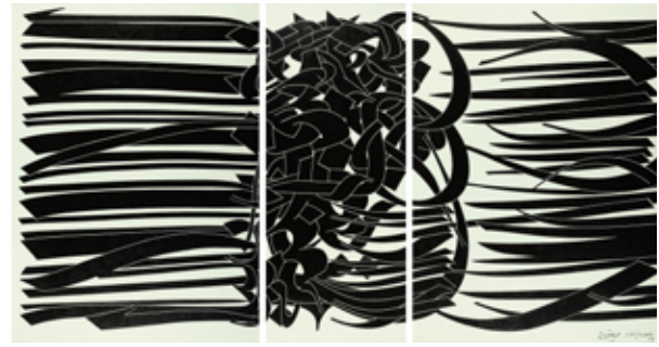
تصویر ۳. ضیافت، اثر محمد اخصایی، رنگ‌وروغن روی بوم، ۲۰۰۹ میلادی. ابعاد: ۵۶۴*۲۶۰ سانتیمتر.