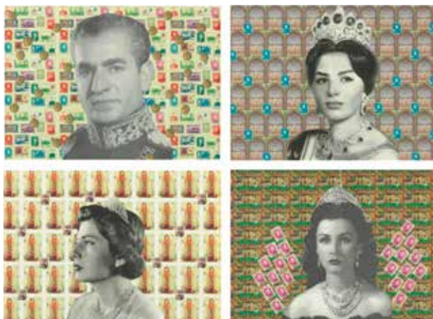
تصویر ۱۵. شاه و سه ملکه‌اش، اثر افسون، فوتوکلاژ چاپ شده روی کاغذ، ۲۰۰۹ میلادی. ابعاد مجموع چهارعکس: ۱۶۴*۵۸ سانتیمتر.