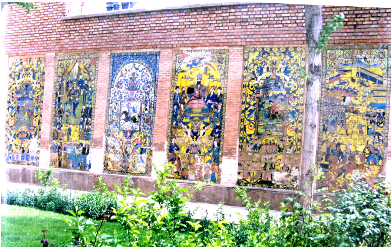
تصویر ۹. نمایی از بافت-بستر اصلی مجموعه کاشی‌نگاره‌های گرمابه نوبر در حیاط عمارت فرشی (شکیللی) در سال ۱۳۷۷ ه.ش.

شهرهای ایران قابل رؤیت است: عمارت‌های باغ ارم و نارنجستان قوام و زینت‌الملوک در شیراز، حسینیه مشیر شیراز، کاخ گلستان و شمس‌العمارة تهران، عمارت آیینه‌خانه بجنورد و تکیه معاون‌الملک در کرمانشاه. بنابراین، برای بررسی فرضیه اصلی این پژوهش، به ترتیب از دو روش مشاهده میدانی و اسناد تاریخی استفاده شده است: در ابتدا لازم بود که از عدم سابقه تصویرنگاری در تزیینات گرمابه‌های تاریخی تبریز اطمینان کافی حاصل شود که البته نتیجه منفی بود (درباره این حمام‌ها، ن.ک. رشیدنجفی، ۱۳۸۹: ۷۰-۳). در نتیجه، سابقه کاشی‌نگاری در خانه‌های تاریخی تبریز تنها گزینه معقول می‌نمود. اما از آنجا که سیف (۱۳۸۹: ۱۹۰-۳ و ۱۳۳) هیچ مشخصات و نام و نشانی از خانه‌ای که آن کاشی‌نگاره‌ها را آنجا رؤیت کرده، منتشر و عرضه نکرده است، ناگزیر عمارت‌ها و خانه‌های تاریخی تبریز باید بررسی و مرور می‌شدند که البته به‌استثنای عمارت متروک خانواده کلانتری، تزیینات معماری آنها فقط شامل گچبری، آجرکاری و نقاشی دیواری (عمارت بهنام) است (درباره تزیینات و پلان خانه‌های تاریخی تبریز، ن.ک. کی‌نژاد، شیرازی، ۱۳۸۹). نمای عمارت کلانتری تبریز با کاشی‌های هفت‌رنگ هندسی آراسته شده