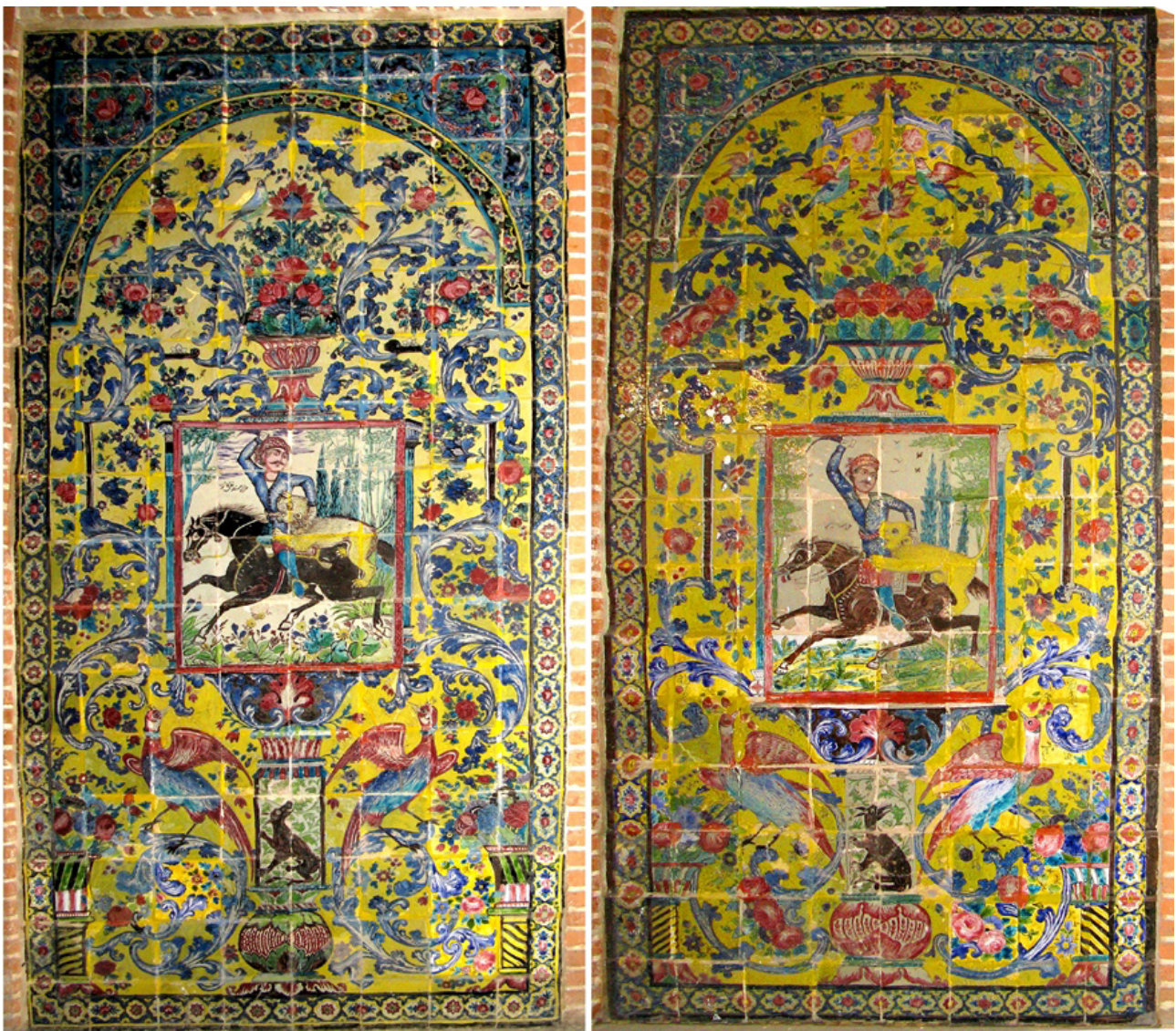
تصویر ۵. صحنه‌های سوارکار شیرافکن یا کور اوغلو با اسب قیرأت.

نمونه‌های گرمابه نوبر تبریز به لحاظ موضوع و مضمون آنها با نمونه‌های قابل مقایسه در دیگر شهرهای ایران با تأکید بر بافت-بستر آنها و همچنین با مراجعه به اسناد تاریخی قابل بحث و بررسی است :