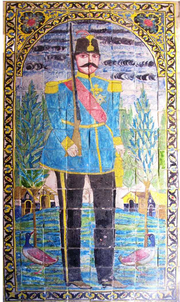
تصویر ۲. کاشی‌نگاره صاحب منصب قاجار، احتمالاً جوانی مظفرالدین شاه قاجار به هنگام ولایت‌عهدی‌اش در تبریز.