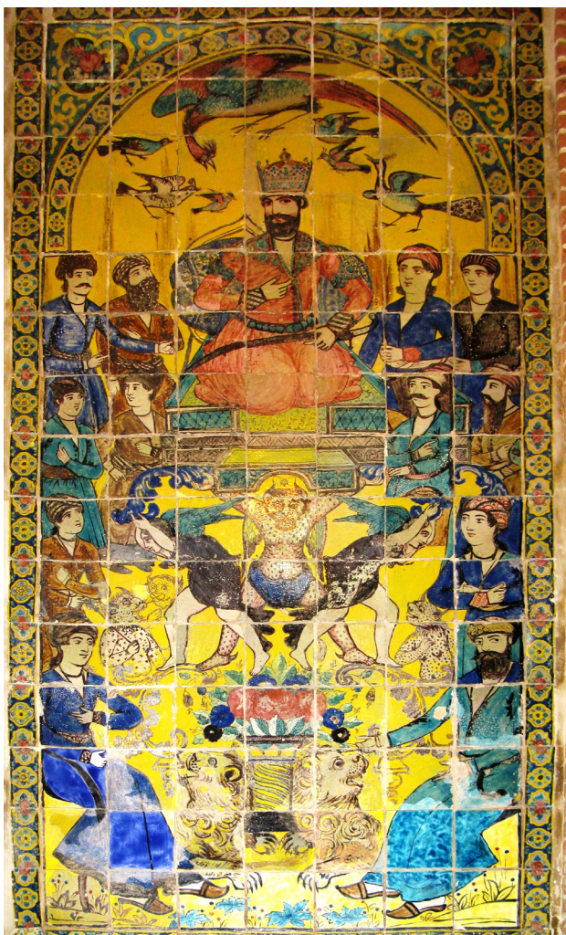
تصویر ۸. بارگاه سلیمان نبی (ع).

ج. مجالس نخجیر و شکارگاه: دو مجلس سوار شیرافکن، گویا بخشی از افسانه معروف کوراوغلو و اسب قیرگون تندرو مشهور به قیرآت را روایت می‌کند. منظره‌پردازی‌های زمینه سوار شیرافکن و جوان شکارچی به شیوه ایرانی است. در حالی که منظره پشت سر آن دو سردار به شیوه اروپایی قلم‌گیری شده است (درباره منظره‌پردازی در نگارگری ایرانی و اروپایی، ن.ک. جوادی، ۱۳۸۳). اما درباره تصویر آن جوان سوارکار شکارچی گویا به نظر می‌رسد که باید یکی از اشراف باشد. این نکته نه تنها از نقش رسمی و دولتی شیر و خورشید در لچکی‌های طرفین بالای نگاره بلکه از نیکه‌هایی که تاج سلطنتی را پیشکش می‌کنند نیز استنباط می‌شود (تصویر ۶). مناظر اشراف سوارکار بر فرسک‌های تالار عمارت بهنام تبریز نیز نقش بسته است. صحنه‌های شکار و نخجیر دارای نمونه‌های مشابهی در عمارت شمس‌العماره و کاخ گلستان در تهران و عمارت باغ ارم و عمارت عطروش در شیراز است که البته منظره‌پردازی آنها اسلوب ایرانی و قاجاری دارد. کاشی‌نگاره‌هایی با مضمون و صحنه