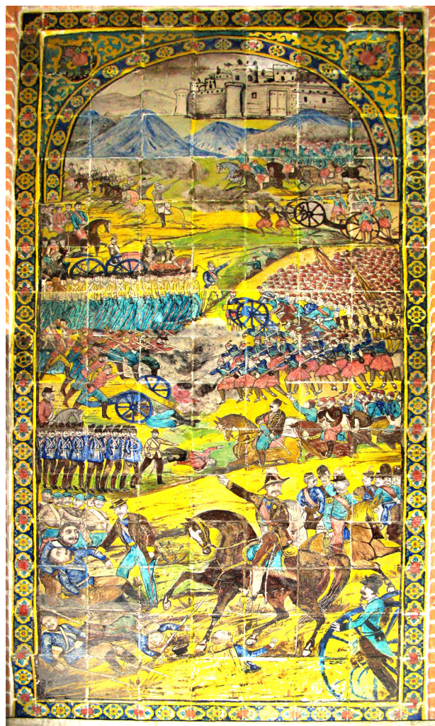
تصویر ۷. صحنه نبردگاه اروپا.