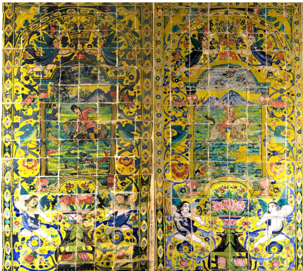
تصویر ۶ صحنه‌های جوان شکارچی.