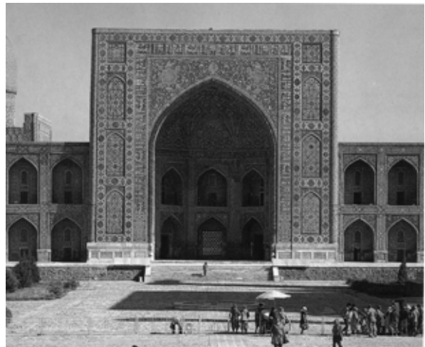
تصویر ۳: مدرسه طلاکاری سمرقند.