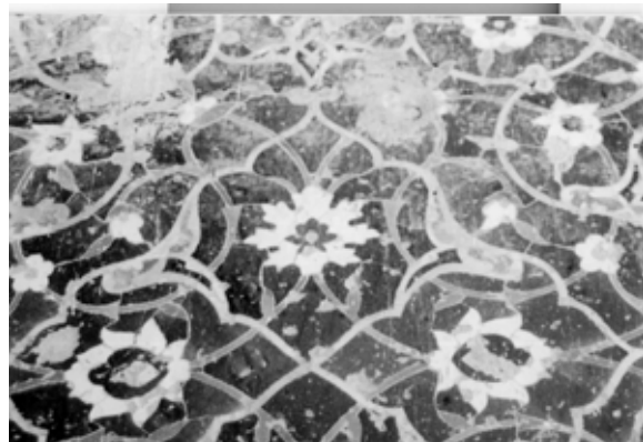
تصویر ۹: کاشیکاری معرق، قبه سبزه، کرمان، قرن ۷ هجری.

هنر عصر صفوی هرگز از نظر کیفیت به خصوص در زمینه معماری و تزیینات با هنر دوران قبل برابری نکرد، بلکه دچار افول شد. معماری دوره صفوی اگرچه شاید فاخرترین و باشکوه ترین نوع معماری در تاریخ ایران باشد، ولی چندان نوآورانه نبود. معماران مجبور بودند وسیع ترین بناها را در کوتاهترین زمان بسازند یا تزیین کنند و بدین