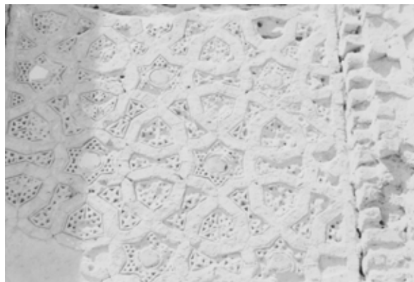
تصویر ۸: آجر کاری و کاشیکاری نگین، مقبره خواجه اتابک سلجوقی، کرمان، قرن ۵ هجری.

همچنین در این دوره، به علت ارتباط دربار صفوی با کشورهای خارجی، رونق فرهنگی و بازرگانی و آمد و شد هنرمندان و تجار از شرق و غرب، تحولاتی در نقش پردازی پدید آمد و عناصری از هنر اروپا و چین به نقوش ایرانی راه یافت. گرچه این عناصر کمابیش از دوران ایلخانی و تیموری نیز در نگارگری و بعضاً در کاشیکاری ظاهر شده بودند، اما در این زمان، رواج و تنوع بیشتری یافتند. از این نمونه ها می توان به نقش سیمرغ، اژدها، ابرهای چینی، انسان بالدار که چهار زانو نشسته (همچون شمایل بودا) و سر و نیم تنه انسان در کاشی های معرق حیاط کاروانسرای گنجعلی خان در کرمان اشاره کرد. همچنین صحنه نیزار و مرغان دریایی در حال پرواز را بر سنگ مرمر کنده کاری شده در ورودی گرمخانه حمام گنجعلی خان مشاهده می کنیم. (کرمان بر سر راه جاده ادویه که شعبه ای از جاده ابریشم بود، قرار داشت و تأثیرات هنر چین بر هنرهای این منطقه حتی قبل از دوره صفوی، آشکار است). آجرکاری، کاشیکاری نگین و معرق کاری که اوج این تزیینات در دوران سلجوقی، ایلخانی و تیموری است، در ابتدای عصر صفوی رایج بود. (تصاویر ۹ و ۸)