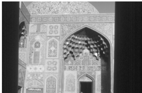
تصویر ۱: سردر مسجد شیخ لطف الله، اصفهان.

بندی، همانند معرق کاری های مسجد کبود نبوده و نمی تواند با آن برابری نماید. (تصاویر ۱ و ۲)