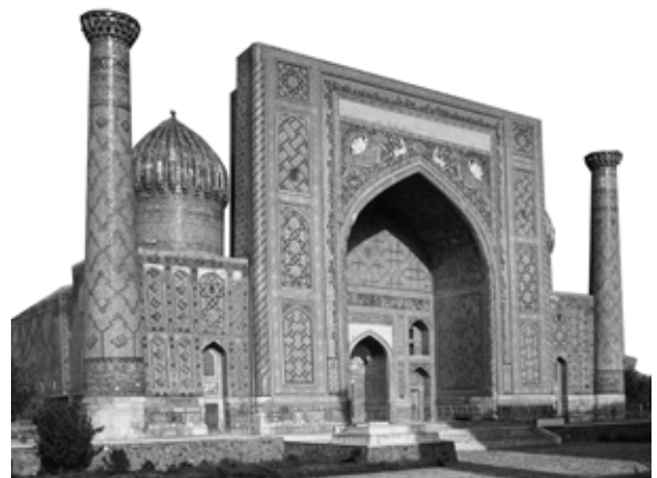
تصویر ۴: مدرسه شیردر، سمرقند.