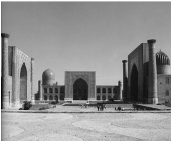
تصویر ۵: مدرسه الخ بیک سمرقند.

تصویر ۶: مجموعه ای در سمرقند شامل میدانی با سه بنا: مدرسه طلا کاری، مدرسه الخ بیک و مدرسه شیردر سمرقند.