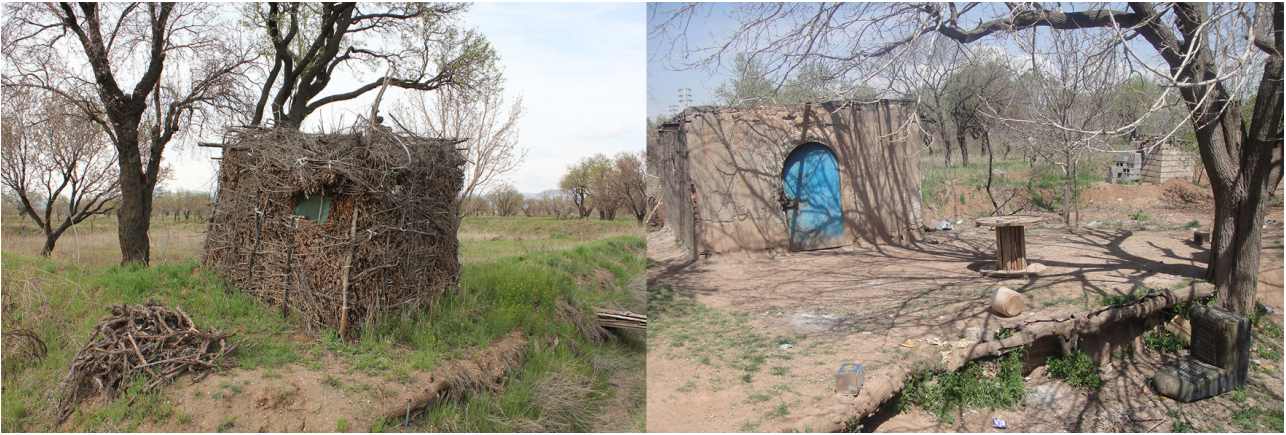
تصویر ۲. راست: چاه‌خانه بادرختان سایه‌انداز همانند توت برای استراحت باغبانان. مأخذ: نگارندگان. چپ: آله ساخته شده از شاخه درخت برای دیده‌بانی باغبانان. مأخذ: نگارندگان.

برگه‌ای (نصفه‌ای) (ورجاوند، ۱۳۷۷: ۱۸). در نظام مالکیت و مدیریت پیش گفته رابطه نزدیک میان مالکان و مدیران بسیار اهمیت داشته و تفاهم آنان بر روی سود حاصل از درآمدها حیاتی بوده است. چنین مناسباتی رابطه انسانی جوامع محلی قزوینی را بسیار قوی می‌ساخته است. جمع‌بندی صفات و خصیصه‌های منظر فرهنگی باغستان سنتی قزوین در جدول فوق نشان می‌دهد که عناصر طبیعی و پوشش گیاهی شامل آب، خاک، پوشش گیاهی و توپوگرافی و عناصر مصنوع شامل سازماندهی فضایی و طرح و نقش زمین، عناصر آبیاری، مسیرهای حرکت و ساختارها و اشیاء به همراه عوامل انسانی و مدیریتی شامل روش‌های آبیاری، روش‌های باغبانی، نظام مدیریت و باغبانی و نظام مالکیت باغستان