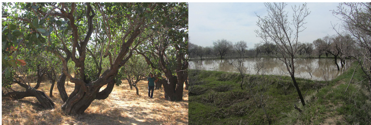
تصویر ۱. راست: شیوه کشت مختلط گیاهان باغستان و آبیاری غرقابی باغستان. چپ: درختان کهنسال پسته در فصل محصول.

باغستان سنتی قزوین طبق تعریف زکریابن محمد بن محمود قزوینی (۶۰۵-۶۸۳)، پس از قرن ششم هجری همانند حلقه‌ای سبز در اطراف شهر شکل گرفته‌اند (گلریز، ۱۳۸۲: ۱۴۶)؛ (تصویر ۳، راست) و در دوره‌های مختلف تاریخی ایران به حیات خود ادامه داده‌اند. شواهد حضور باغ‌ها در سفرنامه‌های متعلق به دوره‌های صفوی (همانند دل لاوله و تاورنیه) و قاجار (همانند مامونف و دیولافوا) موجود است. در نقشه