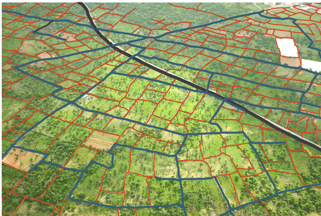
خاکریز دستی مرز باغ‌ها و کرت‌ها جوی پشته‌ها و نهرها جاده

سنتی قزوین همگی به هم پیوسته بوده و دارای رابطه علت و معلولی هستند یعنی وابسته به یکدیگر به وجود آمده و ادامه‌ زندگیشان به هم وابسته است. رویکرد منظر فرهنگی در شناخت خصیصه‌های باغستان بومی تاریخی قزوین تنها به ثبت چند بنای تاریخی یا چند درخت کهنسال محدود