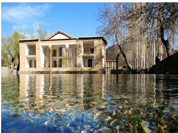
تصویر ۳. چشمه‌های جوشیده از کف دریاچه.