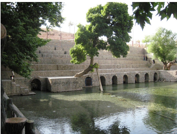
تصویر ۴. چشمه و کوه تپه واقع در کنار آن که البته در حال حاضر مطبق شده است.