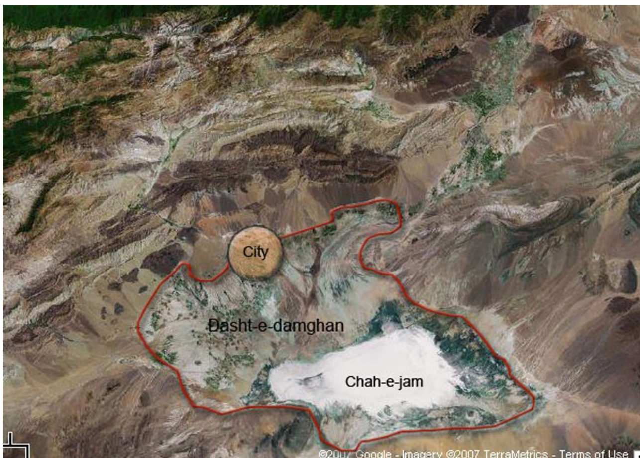
تصویر ۸. موقعیت شهر نسبت به دشت دامغان و کویر جم.

مکشوفه از تپه حصار که در بالا بدان پرداخته شد، باورهای موجود در مورد قنات فی‌خار ۲ واقع در روستایی در ۲۰ کیلومتری دامغان، باورهای مربوط به چشمه بادخان که به احتمال بسیار همان چشمه علی دامغان است، وجود گنبد چهل‌دختران و تزیینات به کار رفته بر روی آن در شهر دامغان ۳ و ... به روشنی روایت می‌کنند اساطیری را که در تاروپود زندگی مردمان این دشت تنیده شده است.