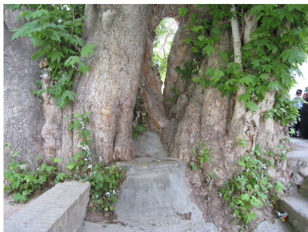
تصویر ۱. چنار مقدس و پارچه‌های دخیل بسته شده به ریشه درخت.