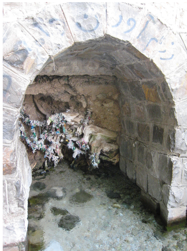
تصویر ۲. چنار مقدس و پارچه‌های دخیل بسته شده به ریشه درخت.

یافتن آب از شکاف‌ها، کوه‌ها و چشمه‌هایی می‌شود که باعث شکل‌گیری آب رودخانه چشمه علی دامغان است. رود پس از عبور از میان پیچ کوه‌ها، به شهر دامغان می‌رسد. به منظور تقسیم صحیح آب و جلوگیری از هدر رفتن آب در ناحیه‌ای که زندگی در آن به دلیل خشک بودن ناحیه کویری و عدم وجود رودخانه دائمی به آب وابسته است، در آخرین پیچ کوه در دامنه گردکوه اقدام به احداث یک سد به نام "سد شهید چراغی" کرده‌اند.