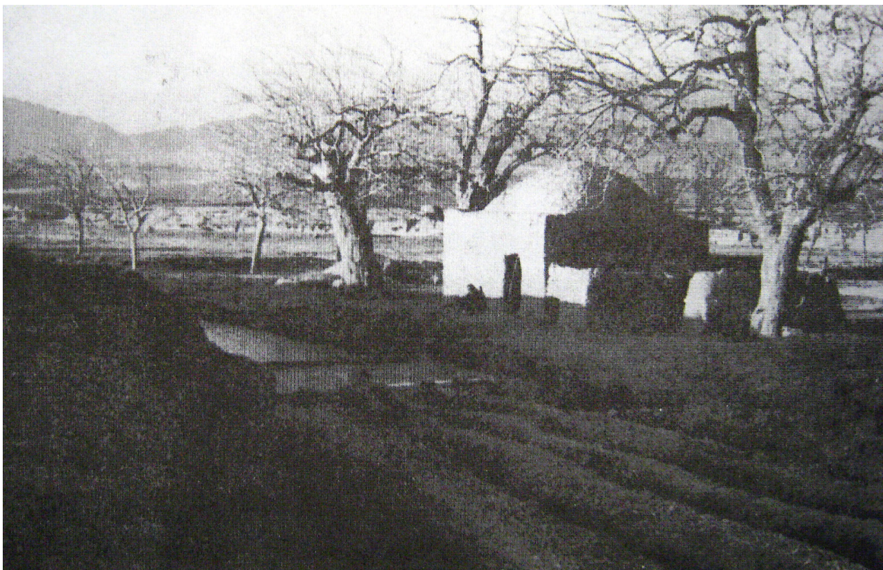
تصویر ۵. بند آببخشان در نزدیکی روستای لب رود که بازمانده‌های آن تا چند دهه پیش وجود داشته است. قدمت آن براساس مستندات تاریخی به عهد ساسانی می‌رسد و خبر از نظام تقسیم آب رودخانه چشمه علی از دیرباز تاکنون می‌دهد.