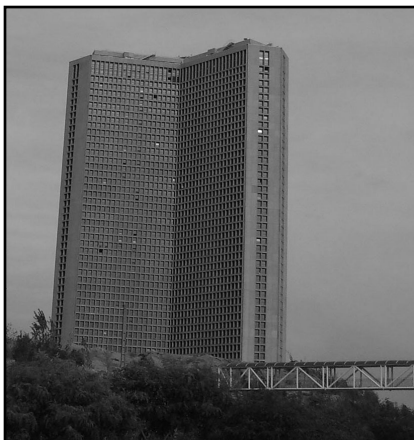
تصویر ۳. برج (بین‌المللی) تهران، مأخذ: کریمی مشاور

این برج (تصویر ۳) در میان ۴ بزرگراه مهم شهر و در ضلع شمالی بزرگراه حکیم واقع شده است، به گونه‌ای که از غرب به بزرگراه شیخ بهایی جنوبی و از شرق به بزرگراه کردستان با دسترسی مناسب به نقاط مختلف شهر بزرگ تهران مشرف است. برج (بین‌المللی) تهران با زیربنای کل ۲۲۰،۰۰۰ متر مربع، و سه بال پهناور در ۵۶ طبقه، مشتمل بر ۵۷۲ واحد و ۱۷ واحد تجاری در همکف است.