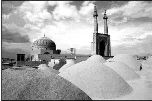
تصویر ۱. اهمیت معنایی ابنیه بلند به عنوان نشانه شهری در بافت قدیمی.

اهمیت است، زیرا به این وسیله شخصیت یک شهر معرفی می‌گردد. علاوه بر این، بحث نمادها و سمبل‌ها در خلق ابنیه بلند به عنوان نقاط شاخص یک شهر نیز دارای اهمیت است، زیرا مردم باید بتوانند با این نمادها و سمبل‌ها به عنوان نشانه‌های شهری ارتباط برقرار نمایند.