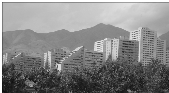
تصویر ۲. مجتمع مسکونی آتی‌ساز

بر اساس آنچه در بخش معیارهای ارزیابی شرح داده شد، ارزیابی تطبیقی میان دو برج (بین‌المللی) تهران و مجتمع مسکونی آتی‌ساز بر اساس سه هدف عمده منظر شهری، به عنوان معیارهای اصلی، و معیارهای فرعی هرکدام از آنها در جدول زیر (جدول ۲) ارائه شده‌است: