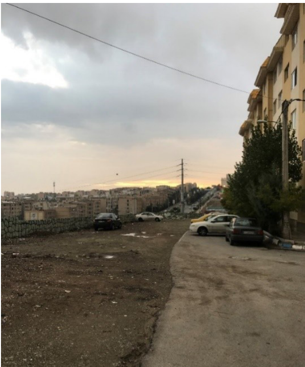
تصویر ۳. فضاهای عمومی بین ساختمانها در مجتمع هسء فضایی منفی و رهاشده.

است. دسترسی و ورودی سواره این سایت نیز در ضلع شمالی آن قرار دارد. کل این مجتمع بر یک زمین نسبتاً شیب دار و دارای توپوگرافی بنا نهاده شده است و غالب مسیرها دارای شیب هستند.