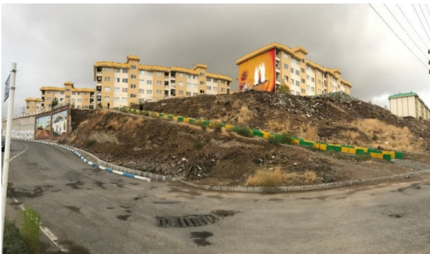
تصویر ۱. دسترسی با شیب زیاد و بسیار دشوار به خیابان اصلی برای افراد پیاده، به خصوص کودکان، بانوان و افراد کم توان.