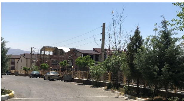
تصویر ۶. وضعیت مناسب مجتمع پارسه از نظر دیوارکشی و امنیت.

جامعه ساکن و عناصری همچون نظام‌های محله‌ای، سازمان فضایی مناسب و مرکز محله است. از طرفی در این مجموعه بلوک‌های ساختمانی بتنی و یکنواخت، همگی از پیش توسط گروه مشاور و بدون دخالت ساکنان، طراحی و ساخته شده است. یکنواختی موجود در بلوک‌های ساختمانی، امکان تشخیص واحدهای مسکونی متعلق به هر خانواده و آدرس‌پذیری را بسیار دشوار ساخته و تکثر هویت‌های فردی را به کلی از میان برده است.