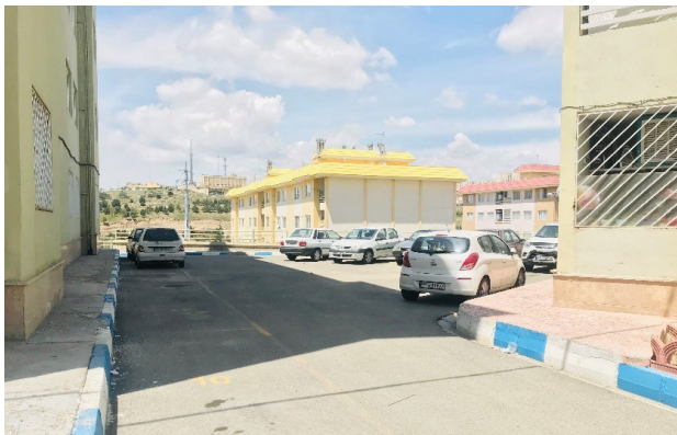
تصویر ۵. وجود فضاهای کنج و دور از دید، بستری مناسب برای مراجعه معتادان و افراد بزهکار.