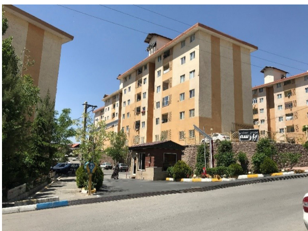
تصویر ۸. وضعیت مناسب مجتمع ثامن از نظر امنیت با کنترل ورود و خروج از طریق نگهبانی.

۳- زیست محیطی: مجتمع ثامن همانند مجتمع هساء هم به لحاظ کمبود فضای سبز و هم به لحاظ مصالح ناسازگار با اقلیم شهر پردیس، به لحاظ زیست محیطی دچار ضعف اساسی است (تصویر ۹).