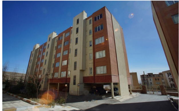
تصویر ۹. وضعیت مناسب مجتمع ثامن از نظر زیست محیطی و سطح پایین فضای سبز.

داشتن مقیاس محله موجب می‌شود که ابعاد اجتماعی در مقیاس محله قابل شناخت و کنترل باشد، امکان مدیریت محلی و دقیق فراهم شود، خودکفایی، یکپارچگی و انسجام اجتماعی شکل گیرد، حس هویت و تعلق مکانی