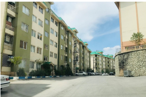
تصویر ۲. پوشش گیاهی پراکنده، خطی و بسیار اندک در سطح مجموعه مسکن مهر هسء شهر پردیس.