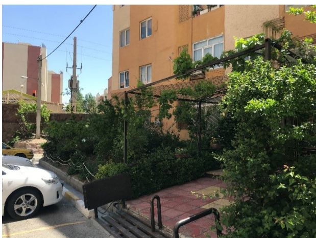
تصویر ۷. وضعیت نسبتاً مناسب مجتمع پارسه از نظر فضای سبز.