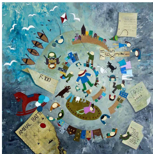
تصویر ۹. شیر ایزبیلگه، قسطنطنیه، از مجموعه داستان‌های استانبول، تصویرسازی متأثر از ساختار نگارگری عثمانی. مأخذ: www.siiozbilge.com .

کشور ترکیه از قرن هجدهم و از اواخر عمر امپراتوری بزرگ عثمانی به دلایل بسیار دچار ضعف و رکود گشت. این در حالی بود که غرب در این زمان مراحل رشد و ترقی خود را طی می‌نمود. این امر سبب شد تا عثمانی‌ها برای جبران ضعف و عقب‌ماندگی خود در زمینه‌های مختلف نظامی و فرهنگی به الگوبرداری از غرب بپردازند. با فروپاشی امپراتوری عثمانی و شکل‌گیری جمهوری در سال ۱۹۲۳م. و رئیس‌جمهوری آتاترک، روند مدرن‌سازی ترکیه در زمینه‌های مختلف از جمله نقاشی سرعت گرفت. در این میان گروه‌های هنری تشکیل شدند که از ویژگی‌های آن‌ها بی‌اعتنایی به هنر پیشینیان بود. این امر سبب شد تا دید