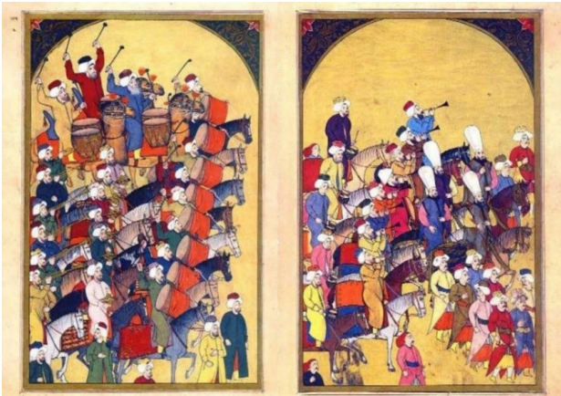
تصویر ۴. لونی، مهترانه (سورنامه وهبی) با تأثیرپذیری از هنر غرب در پیکره‌ها، گنجینه کاخ توپکاپی، برگ چپ فولدر ۱۷۲a و برگ راست فولدر ۱۷۱b.

عنوان مینیاتور عثمانی یاد می‌کنند، آثار عموماً در مقیاس و اندازه‌های کوچک و به منظور تصویرگری متون و کتب تاریخی، ادبی و علمی یا به صورت مرقعات به کار می‌رفت. این اندازه در دوران معاصر به سبب کارکرد متفاوت آثار تغییر یافت و در ابعاد مختلف به کار گرفته شد.