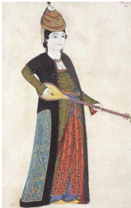
تصویر ۱. عبدالله بوهاری، سازنده ۱ ، نگارگری قرن هجدهم متأثر از پیکره‌نگاری‌های دوران لاله، موزه دانشگاه استانبول.