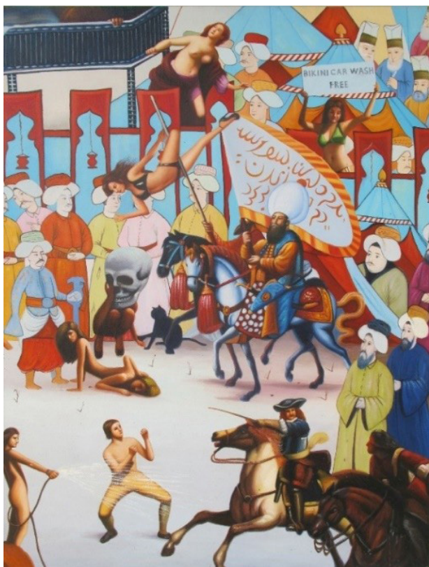
تصویر ۱۰. غازی سانسوی، مجموعه مینیاتور پاپ، رنگ روغن روی بوم ساختار نگارگری با عناصر تصویری از جهان جدید، ۸۰ در ۶۰ سانتی متر، ۲۰۱۴.