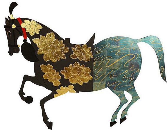
تصویر ۶. گونسلی کاتو، اسب، نقاشی و کولاز متأثر از نگارگری ترکی و ژاپنی.

2016 آثار اوزبلیگه از نظر رنگی دارای غنای بصری بسیارند. او پیکره‌هایش را به صورت معلق در فضا تصویر می‌کند و با این کار حس عدم اطمینان و ناامنی‌ای ایجاد می‌کند که استعاره‌ای از وضعیت فعلی ترکیه است. اوزبلیگه همچنین با هرگونه نمایش سلسله‌مراتبی در آثارش مخالفت می‌ورزد و درست مانند نگارگری‌های عثمانی، کنار گذاشتن چشم‌انداز او را قادر می‌سازد تا یک بوم بدون سلسله‌مراتب ایجاد کند. در آثار اوزبلیگه، در پس یک نمایش شوخ‌طبعانه، انتقادات اجتماعی بسیاری نسبت به شرایط تاریخی و سیاسی ترکیه نمایش داده شده است.