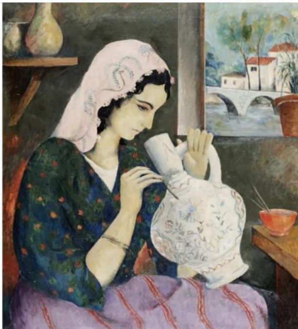
تصویر ۳. تورگوت زعیم، دختر تزئین‌کار ۲۶ ، رنگ روغن روی بوم، اندازه: ۱۱۶ در ۱۰۰ سانتی‌متر.

سختگیرانه به فعالیت‌های خود ادامه دادند. هنر این دوره از ترکیه ترکیبی از کوبیسم، فوویسم و امپرسیونیسم بود که کمتر به مسائل ساختاری و بیشتر به دغدغه‌های اجتماعی می‌پرداخت (Aslier et al., 1988, 237). نقاشی ترکیه در دهه شصت نیز علاوه بر گسترش هنر انتزاعی شاهد گسترش نوعی رئالیسم اجتماعی شد. در کنار این تغییرات، بسیاری از نقاشان با غوطه‌ور شدن در موضوعات محلی که ریشه در میراث فرهنگی آناتولی مرکزی داشتند، از موضوعات روزمره شهری بهره جستند. در دهه ۱۹۷۰م. طی تحولات سیاسی و اجتماعی هنرمندان علاوه بر تأثیرات نقاشی اروپایی، از مواردی چون سنت‌های فرهنگی که طیف وسیعی از گرایش‌های هنری را در بر می‌گرفت تأثیر پذیرفتند. تولید نشریات هنری که از اواخر ۱۹۶۰م. آغاز شده بود منجر به نوعی ارتقا در سطح گفتمان‌های هنری و علاقه به شرکت در دوسالانه‌های هنری شد. پیشرفت تکنولوژی، به ویژه در رسانه‌ها، سطح تبادلات فرهنگی بین جوامع را افزایش داد و سبب کاهش فاصله بین شرق و غرب شد. بحث‌های فرهنگی در ترکیه در مقابل کمالیست‌ها ۲۵ سمت‌وسویی تنوع‌گرا و چندفرهنگ‌گرایی یافت. به مرور بازارهای در حال رشد بین‌المللی هنر، انگیزه هنرمندان ترک را برای ترویج نقاشی ترکی در سایر کشورها فراهم کردند (Marie Baldwin, 2011, 75-78).