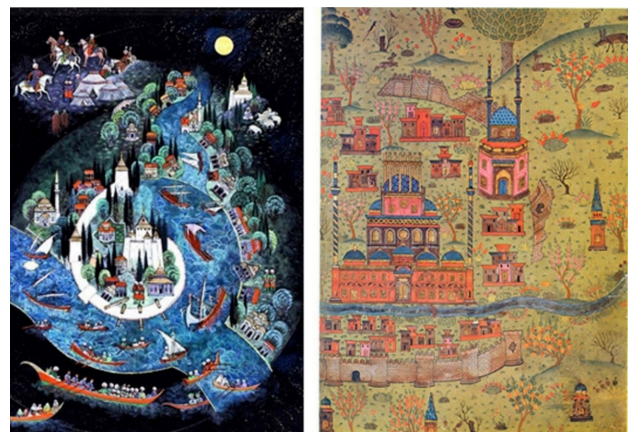
تصویر ۵. راست: اثری از نصح مطراقچی از بیان المنازل سلیمان قانونی. چپ: اثری از نصرت کلپان که از شیوه‌های توپوگرافی مطراقچی بهره برده است.

از جمله پیشگامان نوآوری در استفاده از شاخصه‌های نگارگری در دوران معاصر، گونسلی کاتو ۵۵ از شاگردان سهیل آنور است. مطالعه آثار او نشان می‌دهد که او به تفسیری شخصی از نگارگری دست یافته است. از جمله کارهای او ترسیم نگاره‌هایی به سبک نو-سنتی از عمارت‌های اسکله بسفور است. او همچنین پس از تحصیل در دانشگاه هنر توکیو ژاپن، در آثارش نقاشی ژاپنی را در ترکیب با نگارگری ترکی به کار برد. وی همواره به این مسئله تأکید ورزیده است که در دنیای معاصر، نگارگری باید به سبکی نوین ارائه شود. به نظر کاتو نیاز است تا هنر نگارگری از حالت تصویرگری صرف برای نسخ خطی در آید و روی دیوارها، باغ‌ها و حتی به شکل ویدیو آرت به کار گرفته شود (Ozbilge, 2016, 21). تصویر ۶ نمونه‌ای از آثار کاتو را نشان می‌دهد. همان‌طور که در این اثر و آثار دیگر او قابل مشاهده است، نقاشی‌های کاتو در حین استفاده از عناصر