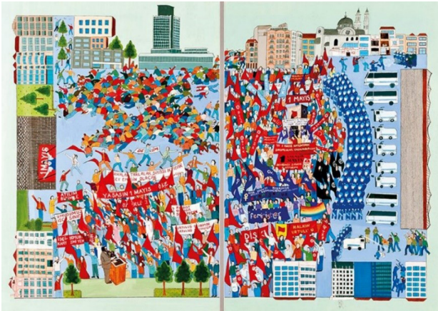
تصویر ۷. کانان سنول، ماه مه، نگارگری، عکاسی و جوهر روی کاغذ مخصوص، ۱۰۰ در ۱۴۰ سانتی متر، ۲۰۱۰.