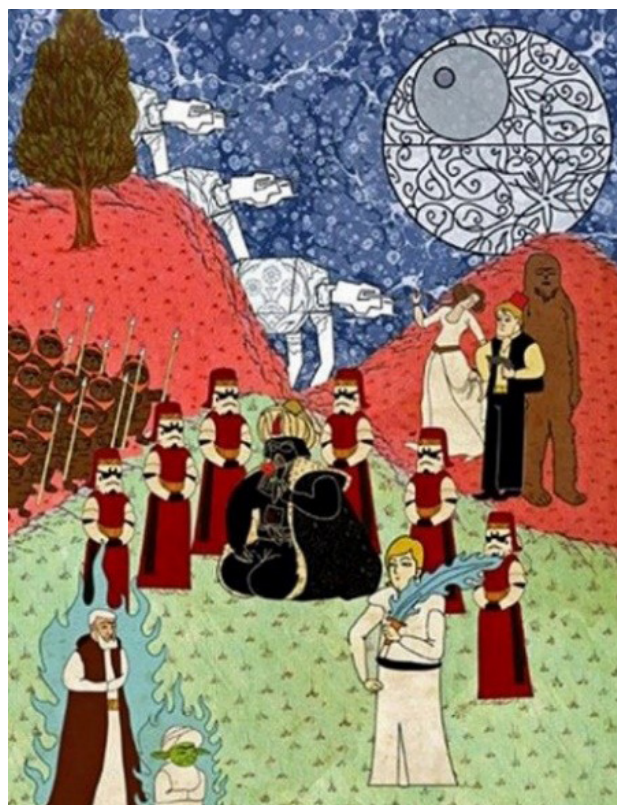
تصویر ۸. مورات پالنا، جنگ ستارگان (الهام از فیلمی به همین نام)، مونوپرینت، ۷۰ در ۴۶. ۵ سانتی متر، ۲۰۱۲.

مسائل سیاسی و اجتماعی استفاده کردند و روح تازه‌ای در آن دمیدند، به طوری که دیدگاه رایج به نگارگری به عنوان هنری عقب‌مانده و متعلق به گذشته را برهم زدند. آن‌ها به نوعی در پی دستیابی به این معنا بودند که سنت‌های یک جامعه برای ساخت آن از ارزش‌های وافر برخوردار است و جامعه‌ای که از این سنت‌ها بی‌اطلاع باشد دچار نوعی بی‌هویتی خواهد شد.