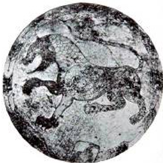
تصویر ۴. سینی نقره‌ای قرن دهم میلادی، اروپای مرکزی، مجارستان.

«علیرضا طاهری» در مقاله «نقوش "حیوان-گیاه" در هنر ساسانی و تأثیر آن بر هنر اسلامی و هنر رومی وار فرانسه» اشاره به ظرف نقره‌ای مربوط به قرن دهم در اروپای مرکزی می‌کند. نگارنده مقاله در خصوص منشأ تولید این ظرف دو احتمال را مطرح می‌کند: