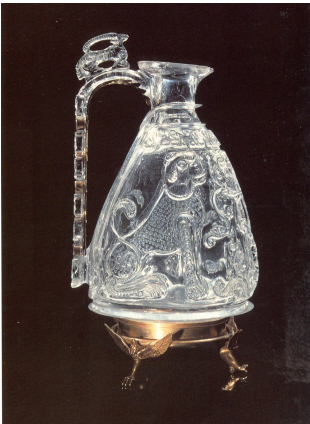
تصویر ۱. ابریق العزیز بالله. گنجینه سن مارک ونیز. قرن دهم میلادی.

آنچه امروز از نمونه آثار منتقل شده به اروپا می‌توان یافت در گنجینه‌های مسیحی نگهداری می‌شوند که شاید ریشه در همان قدرت کلیسا در قرون وسطی داشته باشد که همه چیز حتی هدایا و کالاهای وارداتی می‌توانست تحت سیطره و مالکیت آنها باشد. در بررسی منابع تاریخی و مقالات مورد مطالعه دقت شد آثاری معرفی شوند که در آنها اشاره‌ای مستقیم به حضور آنها در اروپا در قرن مورد نظر داشته باشند. اما نکته‌ای که نباید از نظر دور داشت ضعف مستندنگاری به دنبال عدم توجه مورخین هنر و باستان‌شناسان به مقوله انتقال آثار است. چراکه در خصوص این آثار لازم است دو تاریخ، یکی تاریخ و محل ساخت اثر و دیگری تاریخ انتقال و محل آن ذکر می‌شد تا استناد به آن خالی از اشکال باشد. اما متأسفانه این نقیصه در شرح این آثار چه در منابع داخلی و چه در منابع خارجی دیده می‌شود و تنها تاریخ ساخت اثر به طور دقیق ذکر می‌شود و دقیقاً معلوم نیست این آثار در چه زمان مشخصی به