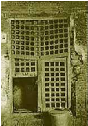
تصویر ۱۰. سقاخانه گذر هارونیه اصفهان.

ضیاءپور در بیان آثارش می‌گوید: «طرح ساده چهار گوشه در تابلوهای من، به صورت القایی عمل می‌کنند مانند القاء به کاشی‌بودن؛ معرف ایرانی، اسلامی و شناخته جهانیان است. وسیله آزادی در جابه‌جایی رنگ، در نوآوری دارای اهمیت است. گویای اصل بینش فلسفی من در جهان زندگی است ... از دنیای بیرون است که از راه دید، ذخایری فزاینده بر ذخایر درون می‌افزاید و این ذخایر، از نظر ما دارای شکل آشنا نیستند و هر کدام از راه تداعی‌ها به ذهن می‌رسند ... شکل‌های بینابین، شکل‌های واسطه‌ای هستند (نه شکل طبیعت محض‌اند و نه شکل‌های مثالی بی‌فرم و سامان هستند) بلکه به صورت رابطی، بین آشنا و ناآشنا، شکل‌های مثال‌گونه می‌نمایند و در ذهن، شکل‌هایی را به صورت ناقص و ساییده (نسبت به طبیعت آشنا) قابل تصور می‌کنند. به کمک شکل‌های اشارتی این رابطه بینابین است که ما باید به دنیای پیچیده درون وارد شویم ... اما اشارات