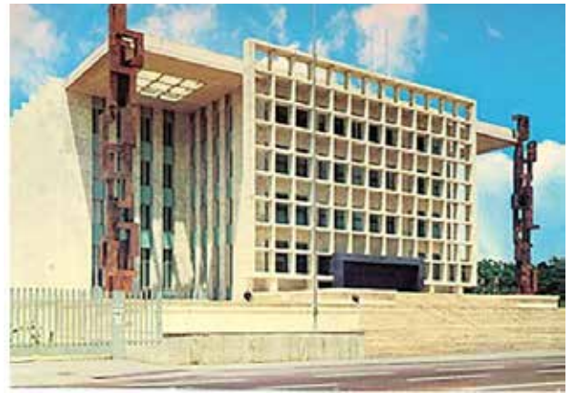
تصویر ۸. مجلس سنا اثر غیایی و فروغی.

تفسیر می‌کند. در رویکرد معاصر یکتایی اثر برآمده از نبوغ، امری بیان‌ناشدنی است و دریافت ما از نبوغ و تعریف آن متأثر از عوامل اجتماعی و مفهومی ساخته اجتماع است. البته نمی‌توان ادعا کرد استعداد بی‌معنا و بی‌اثر است اما نگرش جامعه و اجتماع به نبوغ، تعریف و بازشناسی آن و هدف از آن، مبتنی بر ساختار اجتماعی‌اند. هر کنش تازه‌ای، همچنان که توان بهبود و ارتقاء کنشی موجود یا راه‌حل پیشینی را دارد، توأمان از آبخوری می‌نوشد که پیشینیان برایش فراهم آورده‌اند و کم‌تر خودسرانه است، به نظر وسواس در خلق اثری یکتا، کنشی برای هدر دادن دانش، زمان و منابع باشد. در پاسخ پرسش دوم، محتوای سکناس‌ها و تصاویری که یک فرم و اثر گرته‌برداری شده به ما ارائه می‌دهد، مملو از تمهیدات و ترفندهایی نمایشی و ظاهراً