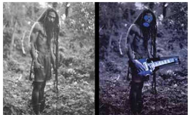
تصویر ۳. راست: اقتباس، اتخاذ و بازیافت=ساخت قطعه خود شما؛ پرنس، چپ عکس از کریوس. مأخذ: www.slideshare.net.

اهمیت امروزشان، که مبتنی بر پیوستگی‌شان در طول زمان فهم می‌شوند و گزارش این رویدادها روایت‌ها را می‌سازد. از این رو آثار معماری و هنری را نیز می‌توان همچون رویدادها پنداشت. جایی که در آن داستانی وجود ندارد و حکایت و ارجاعی نیست. با روایت‌پنداشتن معماری، همچون دیگر روایت‌ها، این هنر، همان قدر که وام‌دار واقعیت است آن را نیز می‌سازد و به تعبیری دیگر جهان خود را شکل می‌بخشد. در بازخوانی هنر و معماری به مثابه روایت و متن، نه بر ایجاد و شکل‌دادن به فهم از حقیقت اثر که بر توالی، درهم‌تنیدگی کنش‌ها و رویدادها تأکید داریم. این نوع خوانش با تفسیر فرق دارد.