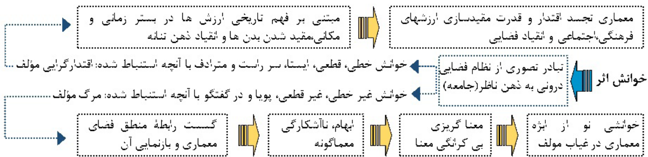
تصویر ۷. فرایند خوانش اثر.