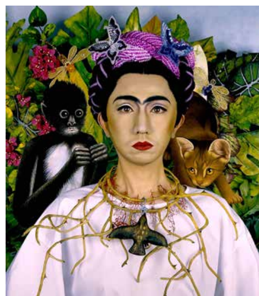
تصویر ۴. گفت‌وگویی درونی با فریدا کالو، موریمورا ۱۷ .

این خوانش توأمان معلوم است و مجهول، در هر تفسیری، شرحی، احوالی، کشفی و شهودی که به تعداد فراوان و طی هزاران سال تلنبار شده‌اند. پس این خوانش از نوع تفسیر نیست ... وضوح و تمایز این خوانش به سریت سر می‌ماند (دریدا و لاکان، ۱۳۹۵: ۱۴). «کالر» آن را «لذت آفرینش مدام» می‌خواند (Culler, 1975: 248). آنچه ناگزیر است، میل به دانستن است و آنچه لذت می‌بخشد، اکتشاف است (Goodman, 1976: 258). لذت این بازی، با گذر از اقتدارگرایی مؤلف، پس از آن هژمونی منتقد و فراتر رفتن از هاله اتوگرافی (تک‌امضایی) گرداگرد اثر، معطوف به خواننده است. خوانش اثر همراه با مرگ مؤلف، با تأکید بر رابطه مخاطب با ابژه تحقق می‌یابد. خوانش مستقل فرم و منطقی ورای ویژگی‌های ضمنی آن (مقتضیات عملکردی، زمینه و بستر طرح و ...) اهمیت دارد و باز تعریفی از رابطه انسان مرکز‌زدایی‌شده با هستی معاصر ارایه می‌دهد؛ تنها مؤلف، سوژه و زاینده اثر تلقی نمی‌شود و اثر در غیاب مؤلف به حیات خود ادامه می‌دهد. این‌گونه معماری از ابژه (محصول عینی) به سوژه (محصول ذهنی، قابل تفسیر) تبدیل می‌شود. در نگاه میان‌متنی، ایده‌های خلاقانه، حتی آنها که کاملاً