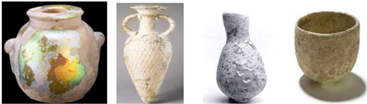
تصویر ۴. ظروف شیشه‌ای بین‌النهرین باستان و دوره ساسانی با حفاظت لایه‌های حاصل از فرسایش سطحی، مأخذ: http://www.britishmuseum.org/research/collection_online/collection_object_details.aspx?objectId=1347558&partId=1&searchText=sasanian+glass+owl&page=1 , https://metmuseum.org/search-results#!/search?q=glass%20sasanian&page=1 . 2018/09/01.11:26am

نهاده می‌شود و ماده‌ای خام را به صورت اثری شاخص که دارای شأن حفاظت و ماندگاری در میان همه اجسام فانی است، آشکار می‌کند و به ظهور می‌رساند و بدین ترتیب حقیقت، از بعد پیوستگی به وجود انسانی سازنده اثر دارای جنبه‌ای فعال و تأثیرگذار است و دریافت آن خارج از دریافت حسیات بوده و نیازمند برهان عقلی و تعقل انسان برای دریافت صحیح آن است؛ و از سویی دیگر به لحاظ انطباق بر وجود ماده‌ای اثر و قرارگیری در نقاب ماده دارای طبیعت مقید و منفعل است و توسط حواس انسان و نیز به کمک توان ابزارمندی او با تجهیزات علوم پایه و مهندسی براساس مطالعات ماده‌ای اثر تا حدودی قابل دریافت است. حقیقت تمامیت وجود اثر تاریخی - فرهنگی در حال و جامع بعد ماده‌ای و فراماده‌ای آن است. با نگاه پدید‌شناسانه وجود انسانی هنرمند سازنده اثر، هنر و فنون ساخت همچنین خود اثر تاریخی- فرهنگی از شیوه‌های ظهور و پدیدارشدن حقیقت بر آگاهی انسان هستند. در مرمت برای زدودن نگاه ابزارگونه به آثار و دستیابی به نگرشی جامع، روشمند و حقیقت- انجام، همانطور که در دیدگاه‌های علمی مورد نظر است، توجه به هر دو جنبه ماده‌ای و فراماده‌ای اثر ضروری است؛ حقیقت فعال پنهان در بطن اثر در کنار شناسایی ماده آن باید شناخته شود و برای تعیین و تحدید عملکردهای آتی و طرح‌افکنی برنامه‌های بهینه برای حفاظت و نگهداری مؤثر، با نگاهی پدید‌شناسانه با به تعلیق درآوردن همه باورها، بازگشتی دوباره به خود شیء انجام شود و مرمت‌گر پیش از هرگونه اقدامی نخست برای دریافت حقیقت با شیوه‌ای پدید‌شناسانه به تمام زوایای پیدا و پنهان اثر گوش فرا دهد یعنی تمام شیوه‌های پدیدارشدن حقیقت، از وجود انسانی محو در اثر که بدان شأن حفاظت و