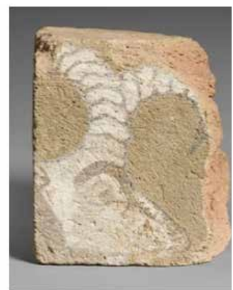
تصویر ۳. آجرهای لعاب‌دار هخامنشی حفاظت‌شده، با سطوح فرسایش‌یافته، موزه متروپولیتن.

حال است که واقعیت دارد و در زمان حال است که بقایای گذشته به شکل آثار و اشیای گوناگون باقی‌مانده از انسان‌ها وجود دارند و آنچه که در آینده طرح‌افکنی خواهد شد نیز فقط به صورت موضوعی ذهنی در اکنون حضور دارد، آثار و بقایای معماری و اشیای تاریخی به گونه‌ای بازگشت‌ناپذیر به زمانی پیشتر و رویدادهای آن زمان تعلق دارند؛ با این حال «اکنون» می‌تواند به عنوان «پاره‌ای از گذشته» در حال، حاضر باشند (هایدگر، ۱۳۹۵: الف: ۴۷۴)، بنابراین درک زمان گذشته دیگر نه مانند درک زمان حال به صورت تجربه‌ی دنباله‌ای از رویدادها، بلکه توسط آن آثار و بقایای ماده‌ای برجای مانده است که در حال صورت می‌گیرد (باردون، ۱۳۹۵: ۵۱). از نظر آگوستین ۱۷ نیز زمان حال واقعیت دارد او تحت تأثیر این اندیشه بود که زمان خاصیت هستی است و آفریده‌ی خداوند که پیش از خلق عالم وجود نداشته است (راسل، ۱۳۹۴: ۴۹۹). مطابق با این دیدگاه تنها زمان حال هست و در زمان حال سه جزء وجود دارد: جزیی در رابطه با گذشته که خاطره است و جزیی در رابطه با آینده که انتظار است و تنها آنچه که در رابطه با زمان حال موجود است، حضور و شهود است (یاسپرس، ۱۳۶۳: ۳۵). از میان اندیشمندان اسلامی خواجه نصیرالدین طوسی نیز زمان حال را واقعی و مقدار آن را بسیار خرد و در حد «آن» دانسته و گذشته و آینده را واقعی نمی‌داند (طوسی، ۱۳۹۳: ۲۱). لازمه‌ی زمان، گذشته و آینده است که گذشته دیگر نیست و آینده نیز هنوز موجود نشده است؛ سرشت زمان گذشته و آینده نابودگی است. به عبارتی زمان دو دست دارد که هر یک به سویی از نیستی دراز شده‌اند، نه گذشته هست، نه آینده و تنها زمان حال هست. در واقع زمان از مجموعه‌ی آنات یا اکنون‌های پیش‌دست درست شده است و در هر «آن»