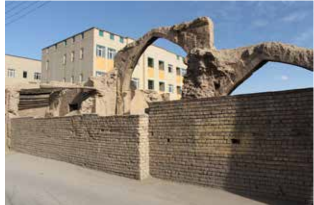
تصویر ۳. خانه‌های نوساز در جوار بافت تاریخی جماله.