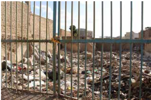
تصویر ۴. خانه‌های متروکه رهاشده در محله جماله.

علی‌رغم آنکه چارچوب نظری بازسازی محله جماله سعی در حفظ ارزش‌ها و بناهای تاریخی علاوه بر اضافه کردن امکانات جدید به محله بود، اما در مرحله اجرا خیابان‌کشی‌های متعدد، سرعتی‌سازی و تخریب خانه‌های نیمه‌ویران بر اثر اصابت موشک و بمب به‌جای بازسازی آنها و مواردی از این قبیل آن‌گونه می‌نمایاند که نظریات معماری مدرن اجرا