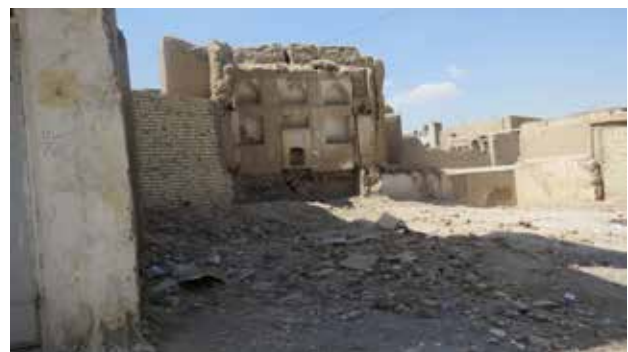
تصویر ۵. خانه‌های قدیمی تخریب شده در محله جماله.

سلسه مراتب است، از بارزترین معضلات امروز بافت محله جماله است.