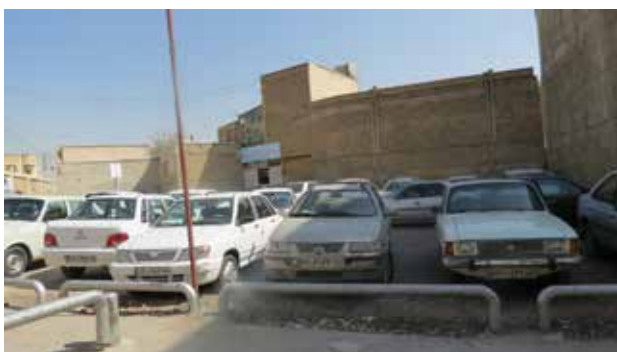
تصویر ۶. فضاهای باز محله جماله که تبدیل به پارکینگ شده است. مأخذ: نگارندگان.