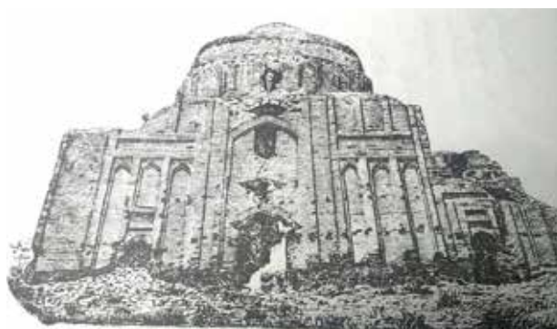
تصویر ۳- نمای شرقی هارونیه در دوره قاجاریه. مأخذ: اعتمادالسلطنه، ۱۳۶۴: ۱۸۱.

تعیین عملکرد، هویت و دوره ساخت اثر است، روش پژوهش منطبق بر روش‌های توصیفی-تحلیلی و روش تحلیل تاریخی، به صورت مطالعه اسنادی و کتابخانه‌ای مبتنی بر بررسی منابع مکتوب، به ویژه متون تاریخی و جغرافیایی و منابع غیر مکتوب و مطالعات میدانی است.