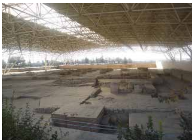
تصویر ۲. مسجد مکشوفه در مجاورت جبهه جنوبی بنای هارونیه. عکس: حسین کوهستانی، ۱۳۹۶.