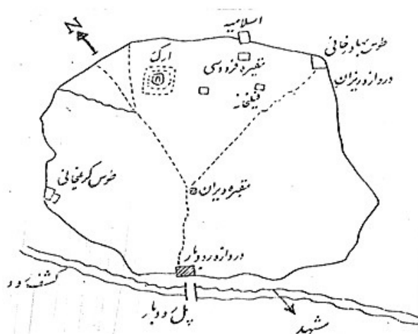
نقشه ۲. تابران توس در دوره قاجاریه.