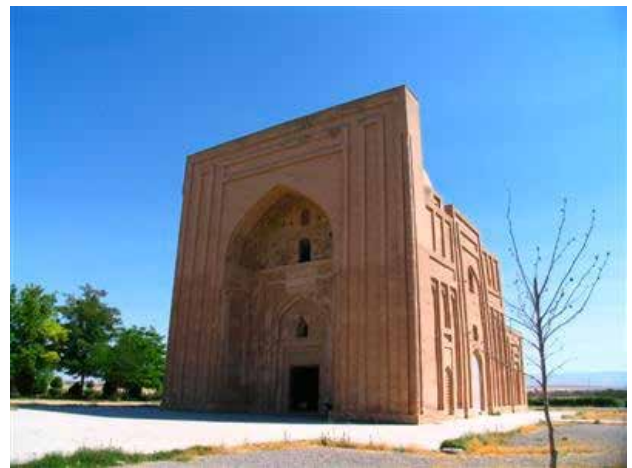
تصویر ۱. هارونیه، نمای جنوبی و شرقی.

در دهه‌های اخیر، تحقیقاتی به صورت مکتوب در مورد معماری بنای هارونیه و کارکرد و قدمت آن توسط محققان ایرانی و غیرایرانی انجام شده است (تصویر ۱، نقشه ۱). در این میان محققانی نظیر «ویلیبر» (۱۳۶۵: ۱۵۸-۱۵۷) و «پوپ» (Pop, 1938: 1702, 1704) به تشریح و تحلیل کامل‌تری از بنا پرداخته‌اند. از میان محققان ایرانی نیز در دهه‌های اخیر افرادی همچون «محمد محیط طباطبایی» (۱۳۵۳: ۱۰)، «مهدی سیدی» (۱۳۳۹: ۲۶)، «رجبعلی لباف خانیکی» (۱۳۷۸: ۶۵) و سید محسن حسینی (۱۳۷۴: ۴۹) هرکدام سعی کرده‌اند به بررسی و تجزیه و تحلیل ابهامات بنا بپردازند. در این میان نتایج قابل توجهی نیز به دست آمده است. همچنین در راستای شناخت بنای هارونیه، در سال ۱۳۵۴ ه. ش. کاوش‌هایی در داخل بنا انجام گرفته است (آرشیو اداره کل میراث خراسان رضوی). بنای هارونیه هر چند امروزه به صورت یک بنای منفرد تقریباً در وسط شهر تابران توس قرار گرفته است، اما با توجه به شماری از نوشته‌های سیاحان دوره قاجار همچون فریزر (Fraser, 1825: 517) خانیکف (۱۳۷۵: ۱۲۱) و اعتمادالسلطنه (۱۳۶۴: ۱۸۱) می‌توان استنباط کرد تا دوره قاجاریه در پیرامون این بنا آثار معماری دیگری از جمله یک منار و یا قلعه چهاربرجی وجود داشته است. نتایج کاوش‌های باستان‌شناسی دهه‌های اخیر (موسوی، ۱۳۷۰؛ لباف خانیکی و بختیاری شهری، ۱۳۷۵ و طغرای، ۱۳۸۲) نیز تأییدی به این نکته است. از توصیفات بازدیدکنندگانی به طور کلی از