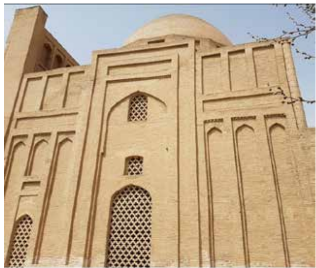
تصویر ۶. تاق نماها و نغول‌های ضلع شرقی. عکس: حسین کوهستانی، ۱۳۹۶.

با بررسی متون تاریخی، به احتمال فراوان می‌توان تاریخ اولیه ساخت بنای هارونیه و همچنین علت ناتمام ماندن این بنا از نظر ساختمانی را در دوره کوتاه حکومت شیعه‌مذهب