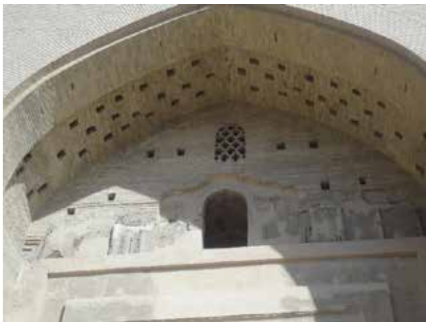
تصویر ۴. بقایای اندود گچ در زیر پیش‌تاق ورودی هارونیه. عکس: حسین کوهستانی، ۱۳۹۶.

گنبد دو پوش بنای هارونیه نیز از جمله مواردی است که به علت ارتفاع زیاد و دید مناسب می‌توانست مکان مناسبی برای