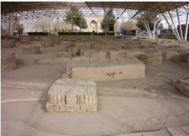
تصویر ۷. بقایای مسجد مجاور بنای هارونیه.

منفرد دیده می‌شود اما بررسی و تحلیل معماری بنا نشانگر آن است که این قسمت از ابتدا به عنوان بخشی از یک مجموعه طراحی شده است. وجود سه اتاق در بخش شمالی بنا، محرابی در نمای بیرونی شمال ساختمان، وجود چهار ورودی در چهار طرف بنا و همچنین ناتمام بودن معماری ساختمان بیانگر آن است که ساختمان فعلی تنها قسمتی از مجموعه‌ای بوده که امکان ساخت آن فراهم شده است. ضمن آن که کاوش‌های باستان‌شناسی نیز در دهه هشتاد شمسی موفق به کشف بقایای از مسجد بزرگی شده است که احتمالاً در دوره‌هایی قسمتی از مجموعه معماری هارونیه محسوب می‌شده است (تصویر ۷).