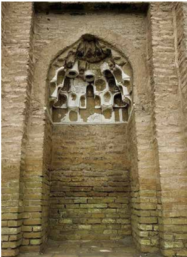
تصویر ۸. محراب بیرونی جبهه شمالی بنا. عکس: حسین کوهستانی، ۱۳۹۶.

هیچ‌گاه امکان تکمیل این بنای عظیم فراهم نشد. در همین راستا تفکرات مذهبی حکومت غالب یعنی آل کرت موجب تخریب نشانه‌های مذهبی یا تاریخی این بنا شد، این امر موجب شد که چپستی بنای مذکور در دوره‌های بعد در هاله‌ای از ابهام و گمنامی فرورفته و پرسش‌های بی‌پاسخ فراوانی در مورد کارکرد و قدمت آن پدید آید. چندی بعد، سقوط دولت آل کرت توسط میران شاه (در سال ۷۹۱ ه. ق.) و قتل و غارت گسترده مردم شهر توس توسط او باعث شد تا انتقال هویت شخص مدفون در بنا از طریق روایات شفاهی مردم شهر ناممکن شده و قدمت یا کارکرد بنا نیز به فراموشی سپرده شود. عوامل دیگری نیز در هرچه بیشتر فراموش شدن کارکرد و قدمت واقعی بنای هارونیه مؤثر افتاد که از جمله آنها می‌توان به انتقال آب شهر توس به مشهد در دو دوره تیموری و صفوی اشاره کرد که موجب تسریع روند تخریب و ویرانی شهر شد. اهمیت یافتن شهر مشهد، به ویژه در دوره صفویه، تحت تأثیر حرم امام رضا(ع) در نتیجه سیاست مذهبی این دولت در مهم شمردن هرچه بیشتر مقابر امامان و امامزادگان و کم‌توجهی به مقابر شیوخ و عرفا باعث شد بار دیگر شهر توس و تک بنای ماندگار آن به فراموشی سپرده شود. اندک مردم باقی‌مانده