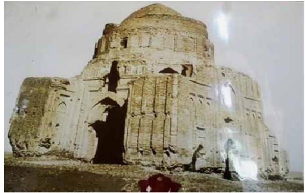
تصویر ۵. هارونیه، نمای شرقی و جنوبی.

سربداران در آغاز حکومت، با توسعه کارهای عمرانی شهر توس سعی در جلب حمایت بیشتر مردم داشتند. عمل توسعه و عمران با ترمیم خرابی‌های حکومت جانی قربانی‌ها آغاز شد (همان). مسلماً بازتاب مثبت این فعالیت‌ها می‌توانست به عنوان حمایت‌کننده و پشتیبان ایدئولوژیک اهداف درازمدت سیاسی-مذهبی سربداران مورد استفاده قرار گیرد. همچنین با توجه به نقش عمده و مهم توس در کشمکش‌ها و رقابت‌های قدرت طلبانه حکومت‌های سده ۸ ه.ق، احتمالاً سربداران پس از مرگ دراویش و شیوخ مورد احترام شهر، ساخت مقبره‌ای