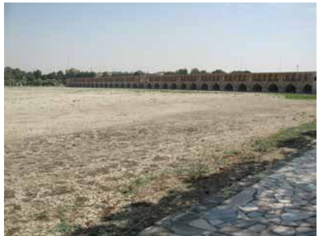
تصویر ۳. خشکی زاینده‌رود.

• کاربری‌های خدماتی حاشیه محور مادی‌ها (با مساحت ۱۰۰۰ متر و بالاتر) بایستی با رعایت ضوابط و مقررات