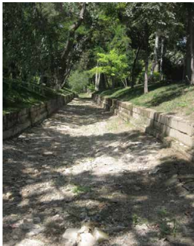
تصویر ۴. خشکی مادی نیاصرم که به عنوان یکی از مادی‌های اصلی شهر اصفهان محسوب می‌شود.