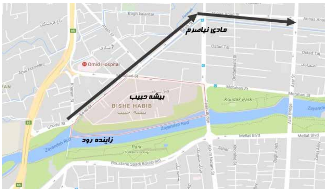
تصویر ۲. محله بیشه حبیب.

در اکثر نقاط شهر قیمت املاک در کنار مادی ها کمتر از مناطق دیگر بود اما موارد جزئی مانند محله بیشه حبیب (تصویر ۲) نیز وجود دارند که با توجه به قرار گرفتن در بین رود زاینده رود و قسمتی از مادی نیاصرم دارای ارزش افزوده بالاتری هستند.