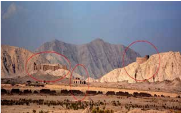
تصویر ۲. دخمه مانکجی لیمجی (سمت راست). دخمه ساسانی (سمت چپ) و ساختمان مراسم (مرکز).