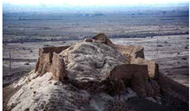
تصویر ۵. بقایای دخمه قدیمی؛ دید از دخمه مانکجی. شهر کرمان در جنوب و در پس زمینه عکس دیده می‌شود.

و در کنار دخمه قدیمی کرمان قرار گرفته است (تصاویر ۱، ۲ و ۵).