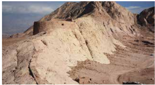
تصویر ۴. دخمه مانکجی؛ اتاق دخمه بان در گوشه پایین سمت راست دیده می‌شود. مأخذ: نگارندگان.

فهم این دارایی ملی و دانستن تاریخ و معنای آن، گامی اساسی در جهت اقدام برای چگونگی حفاظت این اثر تاریخی است. در تشخیص میزان اهمیت حفاظت بنا مؤلفه‌های متعددی از جمله: تصویر جایگاه فرهنگی، اجتماعی،