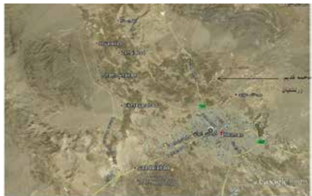
تصویر ۱. موقعیت دخمه زرتشتیان نسبت به شهر کرمان.

پس از ورود اسلام، با وجود محدودیت‌ها، زرتشتیان بخش‌های زیادی از آیین‌های خود را نگاه داشتند و اگرچه اجزای رسوم آیینی آنها احتمالاً دچار تغییراتی شد، بنیان و شالوده آنها همواره ثابت باقی ماند (مزدآپور، ۱۳۸۳: ۱۴۷). به تدریج زرتشتیان فارس و خراسان به سیستان و مکران رفته