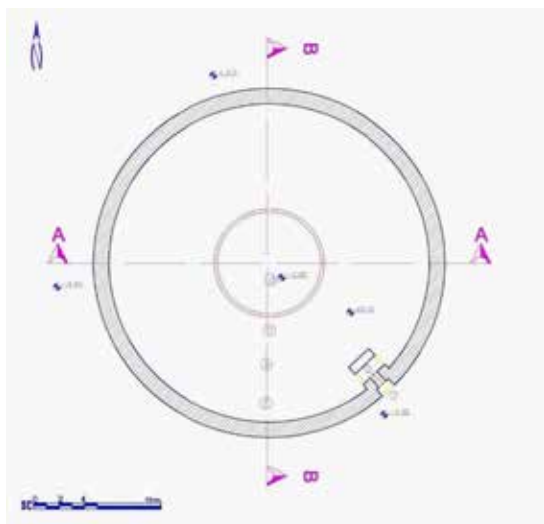
تصویر ۳. پلان دخمه مانکجی لیمجی.

و عده‌ای نیز به هند مهاجرت کردند (همان: ۳۷۶ - ۳۷۲). زرتشتیان هند (معروف به پارسیان هند) که توانسته بودند موقعیت اجتماعی قوی را به دست آورند پس از خبر شدن از اوضاع زرتشتیان ایران در دوران قاجار، انجمنی با عنوان «انجمن بهبودی حال زرتشتیان ایران» تشکیل داده و نماینده‌ای به نام «مانکجی لیمجی هوشنگ هاتریا» را به ایران فرستادند تا در جهت بهبود حال زرتشتیان ایران اقداماتی را انجام دهد (نائبیان، ۱۶۰-۱۲۹). مانکجی در سال ۱۲۳۳ هـ.ش (۱۲۷۱ هـ.ق) و در زمان ناصرالدین شاه قاجار به ایران آمده و نزدیک به ۲۸ سال در ایران به اصلاح امور زرتشتیان پرداخت که از جمله اقدامات وی بازسازی دخمه‌های یزد و کرمان بود (همان، به نقل از بویس: ۴۲۷ و ۴۲۸). دخمه شهر کرمان معروف به دخمه مانکجی در حومه شهر و در نزدیکی روستای سیدی در مسیر کرمان - یزد و در فاصله ۱۵ کیلومتری شمال شهر کرمان، بر فراز کوهی کم ارتفاع