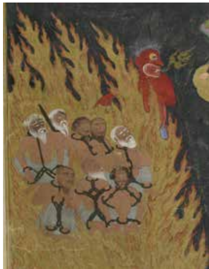
تصویر ۱۸. نمایش غل و زنجیر. بخشی از تصویر ۱۲.