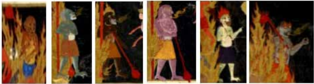
تصویر ۲۰. نگهبانان دیو شکل همراه با گرز، از سمت راست بخشی از تصاویر ۱۳ تا ۱۸.

هستند : آتشی که شعله‌اش مانند قصری است، درکات آن، درخت زقوم با میوه‌های شیطانی، چشمه آب سوزان، نگهبانان، غل و زنجیر و تغییر رنگ پوست و چهره دوزخیان؛ این عناصر با اندکی تغییر در نگاره‌های دیگر نیز مشاهده می‌شوند از جمله آتش و تاریکی که در تمامی نگاره‌ها به عنوان نشانه تصویری دوزخ هستند، مأموران عذاب و نگهبانان دیو شکل نیز از جمله عناصر ثابت دیگر هستند که در اکثر نگاره‌های این نسخه، در میانه تصویر همراه با گرز در آتش ایستاده‌اند همچنین ریختن آب جوش بر سر دوزخیان از جمله مختصاتی است که در قرآن به آن اشاره شده است؛ اما در نگاره‌ها وجود ندارد و دو عنصر عقرب و مار به عنوان عذاب‌های دوزخیان که در یکی از نگاره‌ها دیده می‌شود در بسیاری از احادیث سخن به میان آمده اما در قرآن به آنها اشاره‌ای نشده است. نگارگر در بازنمایی بصری این نگاره‌ها که براساس منابع ارزشمندی همچون قرآن، احادیث و روایات بوده است؛ علاوه بر مصور کردن داستان، به بیان مفاهیم نمادین مورد نظر خود پرداخته است. به این ترتیب چنین می‌توان بیان کرد : مفاهیم عرفانی همچون آتش، تاریکی و ... در نگاره‌های این نسخه نشان دهنده آگاهی نگارگر از جهان عرفانی و عالم معنا است و به کارگیری مضامین عرفانی در این نگاره‌ها در جهت به خدمت گرفتن آموزه‌های اخلاقی است.