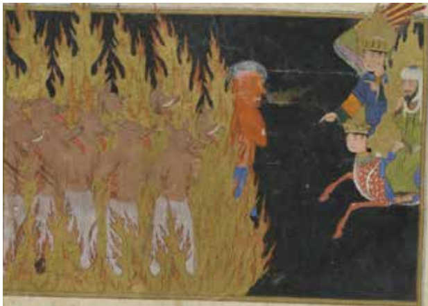
تصویر ۱۹. سیمای دوزخیان. بخشی از تصویر ۴.

کرده است: "دوزخ را هفت در است که اقوال و افعال ناپسند درهای آن هستند، و بهشت را هشت در که افعال و اقوال پسندیده درهای آن بود، مشاعر آدمی نیز هشت است پس حس ظاهر به اضافه خیال و وهم و عقل و هرگاه عقل با این هفت همراه نباشد و این هفت بی فرمان عقل کار کنند، هر هفت درهای دوزخ بوند" (نسفی، ۱۳۴۱: ۲۹۶).