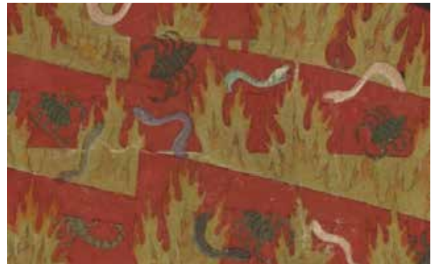
تصویر ۲۱. عذاب متکبرین. بخشی از تصویر ۱۶.

نمادین در تمام نگاره‌های دوزخ، تاریکی است که درآیه ۴۰ سوره نور آمده است؛ و اعمال کافران را به ظلمت‌هایی تشبیه کرده، مولانا تحت تأثیر همین آیات تاریکی را انکار حقایق و جهل می‌داند، ملاصدرا نیز اشاره می‌کند که دوزخ سرای روحانی خالص نیست، بلکه تیره است. تغییر چهره از دیگر خصوصیات دوزخ و دوزخیان است، ملاصدرا در رساله سه اصل آورده است: هر صفت که در دنیا بر کسی غالب شود به سبب بسیاری افعال و اعمالی است که صاحب آن