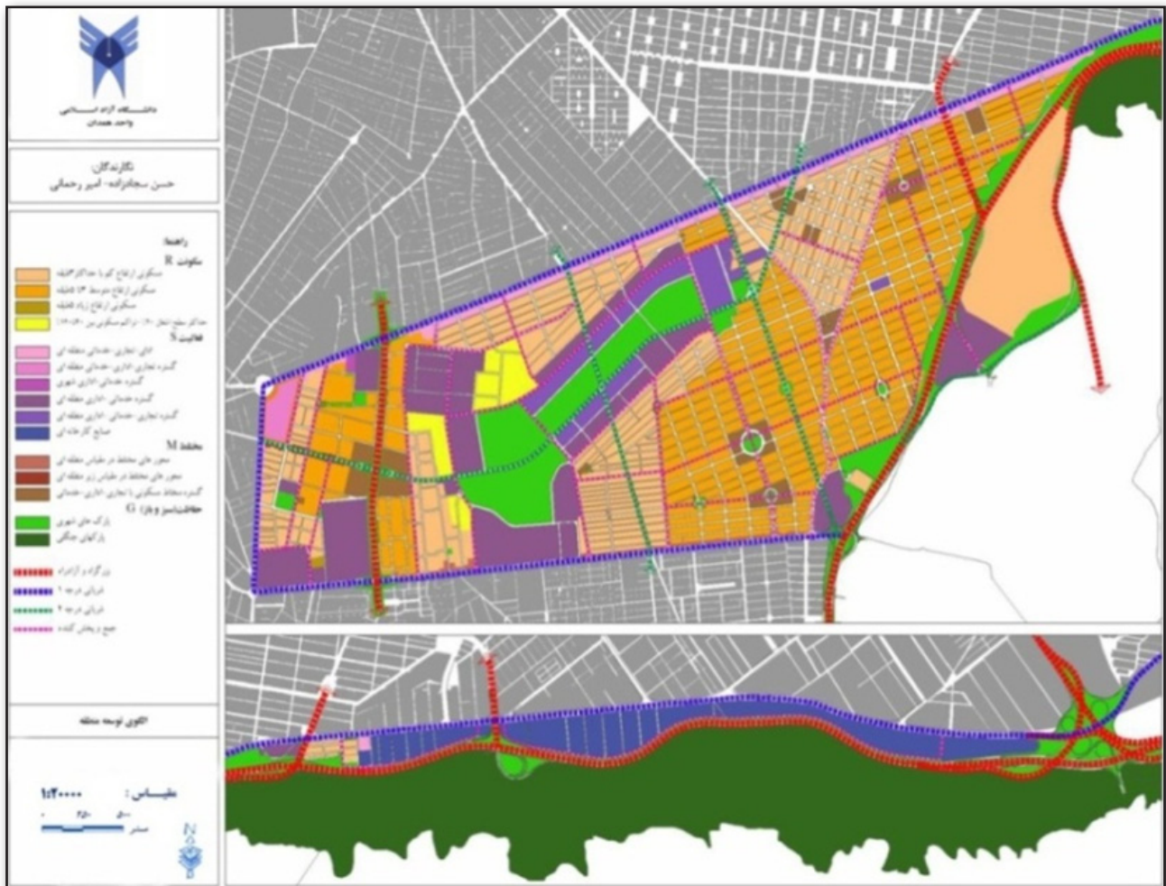
تصویر ۳. الگوی توسعه پیشنهادی منطقه ۱۳ شهر تهران.