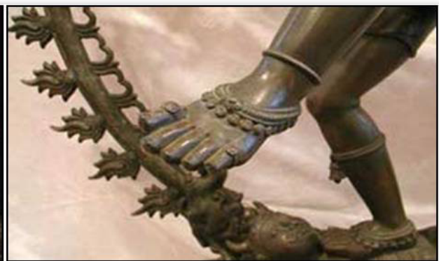
تصویر ۵: تطبیق پای کوبی درویشان در مراسم سماع با پای کوبی شیوا در رقص نداننا. Fig. 5. Matching of Dervishes hoofing in whirling dance with ritual dance of Shiva.