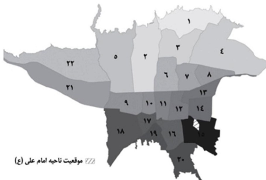
تصویر ۲- ب. موقعیت ناحیه امام علی در استان تهران.