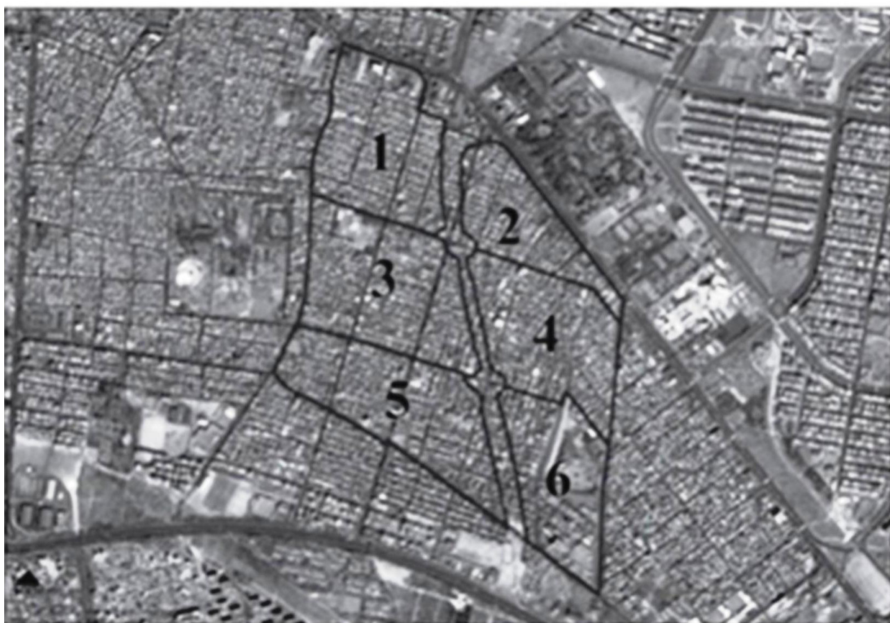
تصویر ۲- الف. محلات ناحیه امام علی.