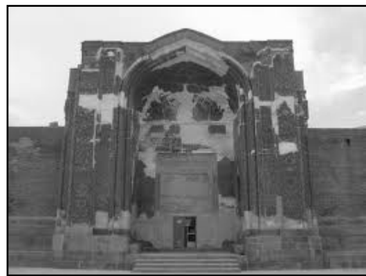
تصویر ۵. الف. مسجد کبود تبریز.

هر دو آثار را می‌توان جزء آثار جاودان به حساب آورد. اما آنچه موجب جاودانگی هر دوی اینها شده است، توجه به تمام ساحات معماری در طراحی و ساخت آنها است. اگر چه میزان توجه به این عوامل در هریک متفاوت است به طوری که اولی با گرایش غالب نخبه‌پسند و دومی با گرایش غالب عام‌پسند شکل گرفته است. لازم به ذکر است هر جامعه‌ای به هر دو نوع آثار احتیاج دارد.