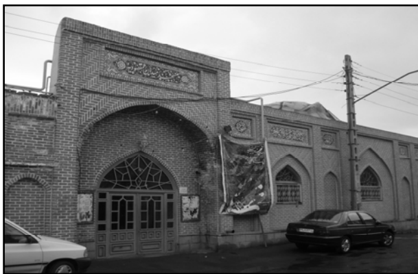
تصویر ۵. ب. مسجد مقصودیه تبریز.

در واقع بحران معماری امروز ناشی از کمبود خلاقیت نیست، بلکه از کمبود مبانی نظری ما نشأت می‌گیرد. مبانی که روزگاری قدرتمندانه در وجود ما ریشه داشت و اکنون بر اثر غفلت و ناسپاسی خود آنها را از دست داده‌ایم. در واقع آنچه ضامن بقا و جاودانگی این میراث تمدن معماری شده است، عدم اتکاء آفرینش‌های هنری، آفرینندگانشان و انتساب آن به خالق هستی‌بخش در کنار توجه متعادل به تمام ابعاد مطرح در معماری است.