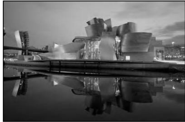
تصویر ۱. موزه گوگنهایم گری

در هر دو آثار می‌توان چیره‌گی خواست هنرمند بر جامعه، نیاز مردم و طبیعت را دید. گویی این آثار تنها در جهت معرفی خود و معمار خود ساخته شده است. در "جامعه وفور نعمت"، معماری حتی از منطق عمومی و کارکردی و... نیز فاصله می‌گیرد و نقش معیارهای وحدت بخش اجتماعی بسیار کم‌رنگ می‌شود.