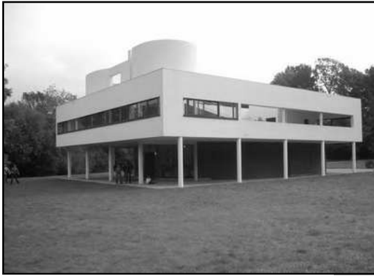
تصویر ۲. ویلا ساوای لوکوربوزیه

تا به امروز ماندگار بوده لزوماً جاودانه نیست و گاه تنها به عنوان یک میراث فرهنگی مرده و غیرفعال باقی مانده و شاید در آینده هم ماندگار باشد ولی حیات جاودان نداشته باشد. مطابق برخی تحلیل‌ها اگر چه اهرام اصول معمارانه جاودانه‌ای را به نمایش گذاشته، ولی بر اساس استبداد و فرعونیتی غیراجتماعی و غیرانسانی تحت فشار شکل گرفته است و به همین جهت هرچند ماندگار اما غیر جاودانه است.