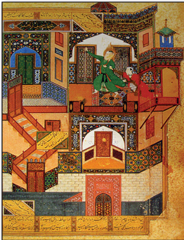
تصویر ۱. یوسف و زلیخا، بوستان سعدی، سال ۸۹۴ ق، کتابخانه ملی قاهره، امضا قسمت بالا و سمت چپ داخل تزئینات معماری، عمل العبد بهزاد.

مشهدی، رئیس کتابخانه شاه اسماعیل، کاریکاتورساز، نادره دوران، اعجوبه زمان، نقاش شخصیت‌پرداز، متکی به خط و رنگ (در نقاشی)، به کارگیرنده خطوط سیال و موضوعات روزمره، اردکننده حرکت در نقاشی ایران، پایان‌دهنده اصول قدیمی نگارگری مانند سکون شخصیت‌ها آغازگر سبک جدید نقاشی، فراهم‌کننده الگوی نگارگری آینده و غیره از جمله دال‌های بی‌پایان ارجاع‌دهنده هستند. بنابراین نام و امضای او در این متون خود به دام دال‌های بی‌شمار می‌افتد و از این نقطه متن را دارای تزلزل و گسست می‌کند. بنابراین پیگیری مؤلف و نام او نمی‌تواند به عنوان نقطه اتکای متن تلقی شود، چرا که تا بی‌نهایت ادامه دارد و طرز تلقی سنتی از مؤلف را با چالش مواجه می‌کند. چگونه می‌توان در اثری که نام مؤلف ردپایی از دال‌های بی‌شمار است به دنبال مؤلف سرراستی بود؟ بسیاری از آثار این هنرمند منسوب به او هستند، مانند پسر پدر مرده از منطق‌الطیر، هارون‌الرشید در حمام و ساختن کاخ خورنق در خمسه نظامی، و نیز آثاری در مرقع بهرام‌میرزا (با انتساب دوست‌محمد) و نیز طرحی خطی در موزه هنرهای کلیولند. تا جایی که مشاهده می‌شود، دوران‌سازترین نگاره‌های مربوط به بهزاد از بر دوش گرفتن امضای او شانه خالی کرده است. چه باید از میان آثار انتسابی جانب احتیاط را گرفت و جایی را برای اشتباه و تشخیص نادرست نیز باز گذاشت. نمی‌توان به استفاده از نحوه قلم‌گذاری و رد قلم‌موی به سبک بهزاد در