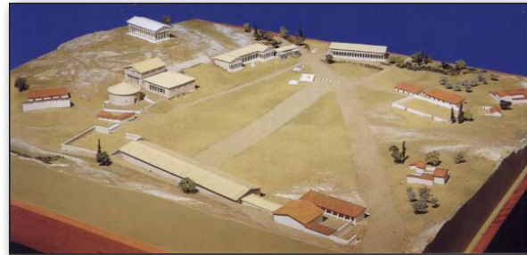
تصویر ۲. مدل آگورا در ۴۰۰ ق.م از ضلع جنوب شرقی. Fig. 2. Model of the Agora in 400 B.C from the southeast wing.

از آنجایی که دوره کلاسیک از مهم‌ترین ادوار استفاده از این فضای بسیار کلیدی در آتن است، در ادامه به توصیف بناهای این دوره بر پیرامون آن (تصویر ۲ و ۳) پرداخته شده است.