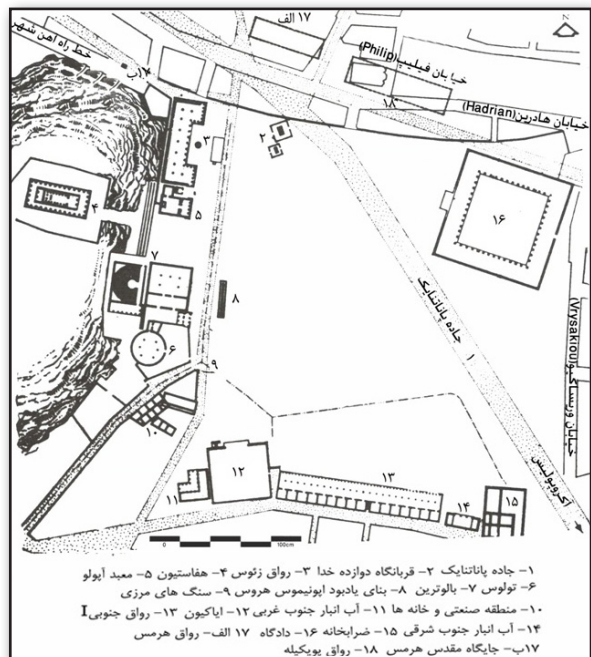
تصویر ۳. پلان آگورا در دوره کلاسیک (قرن ۵ و ۴ ق.م). [Camp, Lang, 2004: 4]. 2003: 3 و موریس، ۱۳۷۳: ۵۱. Fig. 3. Model of the Agora in 400 B.C from the southeast wing.