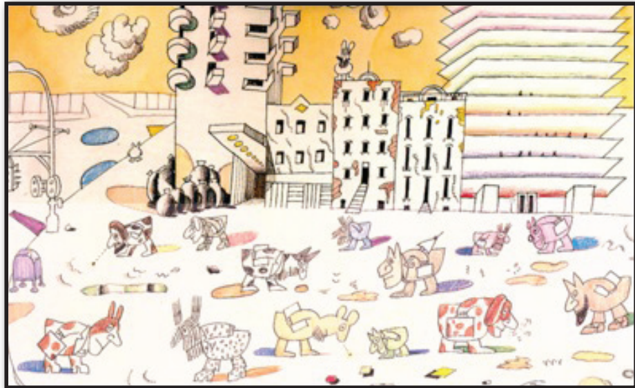
Fig 2. City Dogs; Street is the performance scene, A space for a nation that celebrates itself. Here the streets are numerous: Indians, ranchers, astronauts, dogs, beauty queens, skeletons, and cowboys. Within each group, individuals are clones of each other. It is only to be numerous; they are all alike.

تصویر ۲. سگ‌های شهری ۱۱ ؛ خیابان فضای نمایش است. فضایی که یک ملت خود را می‌شمرد و خود را جشن می‌گیرد. اینجا خیابان‌ها متعدد هستند: هندی‌ها، دامداران، فضانوردان، سگ‌ها، ملکه‌های زیبایی، اسکلت‌ها، کابوی‌ها. در هر گروه، افراد شبیه‌سازی شده‌های یکدیگرند. فقط بحث تعدد مطرح است و گرنه همه به یکدیگر شبیه هستند.